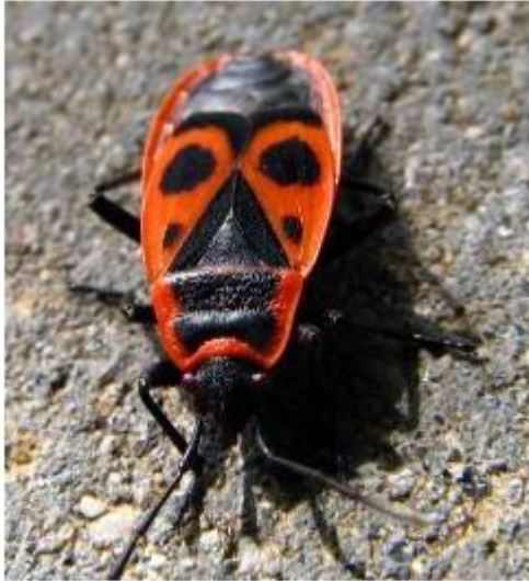
Клоп - солдатик