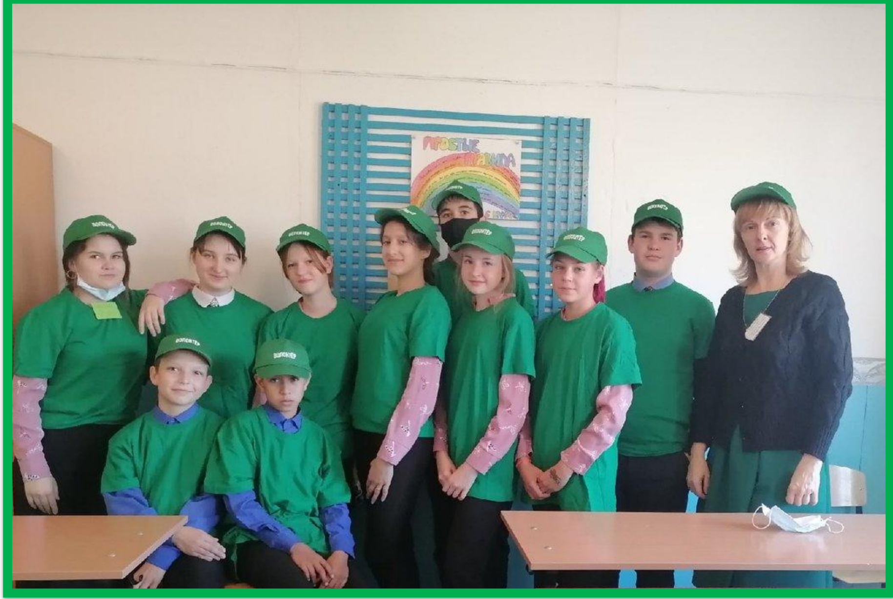
Отряд волонтеров «Радуга добра»