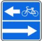
Знак 5.13.3. Выезд на дорогу с полосой для велосипедистов