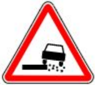
Знак 1.19. Опасная обочина