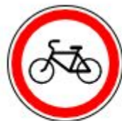
Знак 3.9. Движение на велосипедах запрещено