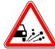
Знак 1.18. Выброс гравия