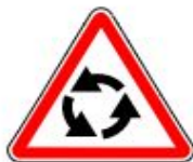
Знак 1.7. Пересечение с круговым движением