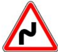
Знак 1.12.1. Опасные повороты (с первым поворотом направо)