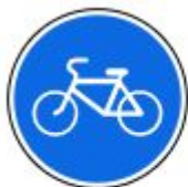
Знак 4.4.1. Велосипедная дорожка