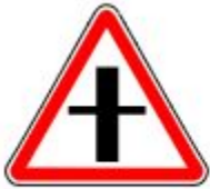
Знак 2.3.1. Пересечение со второстепенной дорогой