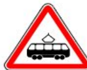
Знак 1.5. Пересечение с трамвайной линией