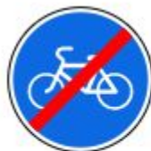
Знак 4.4.2. Конец велосипедной дорожки