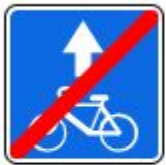
Знак 5.14.2 Полоса для велосипедистов 5.14.3. Конец полосы для велосипедистов