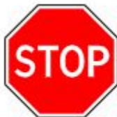
Знак 2.5. Движение без остановки запрещено