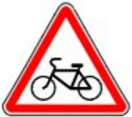
Знак 1.24. Пересечение с велосипедной дорожкой или велопешеходной дорожкой