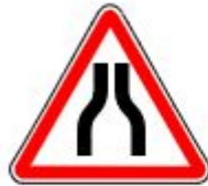
Знак 1.20.1. Сужение дороги.