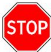
Знак 2.5. Движение без остановки запрещено