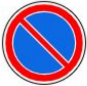
Знак 3.28. Стоянка запрещена