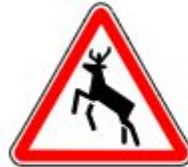
Знак 1.27. Дикие животные