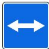
Знак 5.10. Выезд на дорогу с реверсивным движением