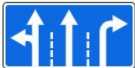
Знак 5.15.1. Направления движения по полосам