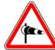
Знак 1.29. Боковой ветер