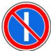
Знак 3.29. Стоянка запрещена по нечетным числам месяца