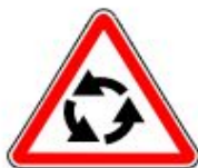
Знак 1.7. Пересечение с круговым движением