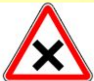
Знак 1.6. Пересечение равнозначных дорог