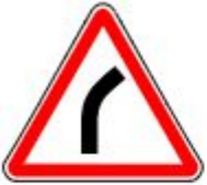
Знак 1.11.1. Опасный поворот (правый)