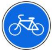
Знак 4.4.1. Велосипедная дорожка