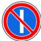
Знак 3.29. Стоянка запрещена по нечетным числам месяца