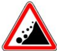
Знак 1.28. Падение камней