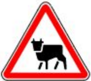
Знак 1.26. Перегон скота