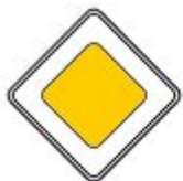
Знак 2.1. Главная дорога