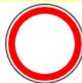
Знак 3.2. Движение запрещено