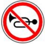
Знак 3.26. Подача звукового сигнала запрещена