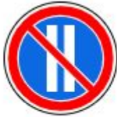
Знак 3.30. Стоянка запрещена по четным числам месяца