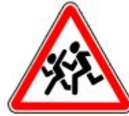
Знак 1.23. Дети