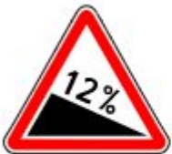
Знак 1.13. Крутой спуск