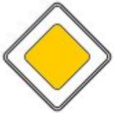
Знак 2.1. Главная дорога