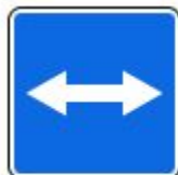
Знак 5.10. Выезд на дорогу с реверсивным движением