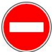
Знак 3.1. Въезд запрещен