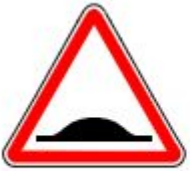
Знак 1.17. Искусственная неровность