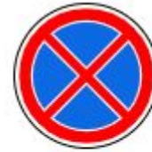
Знак 3.27. Остановка запрещена