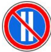
Знак 3.30. Стоянка запрещена по четным числам месяца