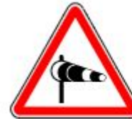
Знак 1.29. Боковой ветер