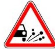
Знак 1.18. Выброс гравия