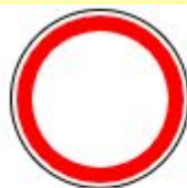
Знак 3.2. Движение запрещено