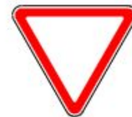
Знак 2.4. Уступите дорогу