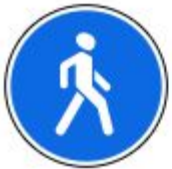
Знак 4.5.1. Пешеходная дорожка