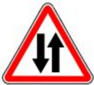
Знак 1.21. Двустороннее движение