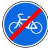
Знак 4.4.2. Конец велосипедной дорожки