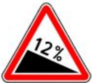
Знак 1.13. Крутой спуск