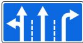
Знак 5.15.1. Направления движения по полосам