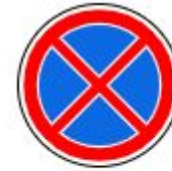
Знак 3.27. Остановка запрещена