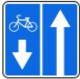
Знак 5.11.2. Дорога с полосой для велосипедистов