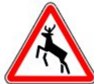
Знак 1.27. Дикие животные