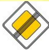
Знак 2.2. Конец главной дороги