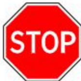
Знак 2.5. Движение без остановки запрещено