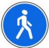
Знак 4.5.1. Пешеходная дорожка