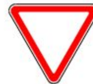
Знак 2.4. Уступите дорогу