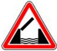
Знак 1.9. Разводной мост