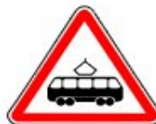
Знак 1.5. Пересечение с трамвайной линией