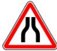
Знак 1.20.1. Сужение дороги.