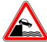
Знак 1.10. Выезд на набережную