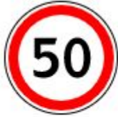
Знак 3.24. Ограничение максимальной скорости