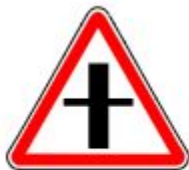
Знак 2.3.1. Пересечение со второстепенной дорогой