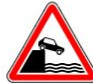
Знак 1.10. Выезд на набережную