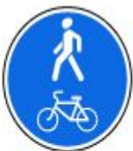
Знак 4.5.2. Пешеходная и велосипедная дорожка с совмещенным движением (велопешеходная дорожка с совмещенным движением)