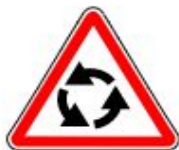
Знак 1.7. Пересечение с круговым движением