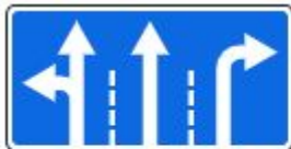
Знак 5.15.1. Направления движения по полосам