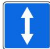
Знак 5.8. Реверсивное движение