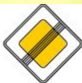
Знак 2.2. Конец главной дороги