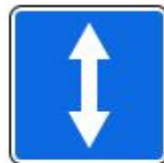
Знак 5.8. Реверсивное движение