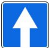
Знак 5.5. Дорога с односторонним движением