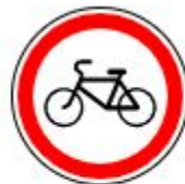
Знак 3.9. Движение на велосипедах запрещено