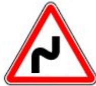
Знак 1.12.1. Опасные повороты (с первым поворотом направо)