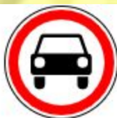
Знак 3.3. Движение механических транспортных средств запрещено