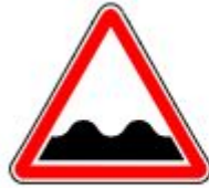
Знак 1.16. Неровная дорога