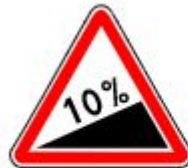
Знак 1.14. Крутой подъем