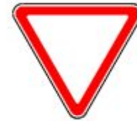
Знак 2.4. Уступите дорогу