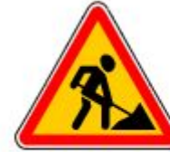
Знак 1.25. Дорожные работы