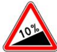
Знак 1.14. Крутой подъем