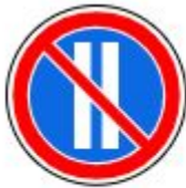
Знак 3.30. Стоянка запрещена по четным числам месяца