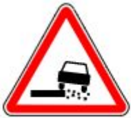
Знак 1.19. Опасная обочина