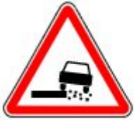
Знак 1.19. Опасная обочина