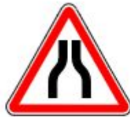
Знак 1.20.1. Сужение дороги.