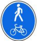
Знак 4.5.2. Пешеходная и велосипедная дорожка с совмещенным движением (велопешеходная дорожка с совмещенным движением)