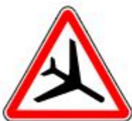
Знак 1.30. Низколетящие самолеты