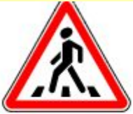
Знак 1.22. Пешеходный переход