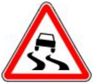
Знак 1.15. Скользкая дорога