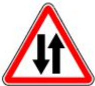
Знак 1.21. Двустороннее движение