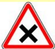
Знак 1.6. Пересечение равнозначных дорог