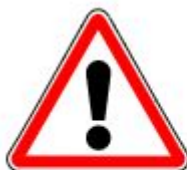
Знак 1.33. Прочие опасности