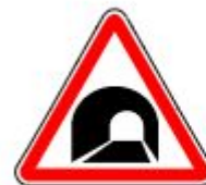
Знак 1.31. Тоннель