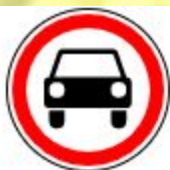
Знак 3.3. Движение механических транспортных средств запрещено