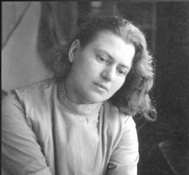
Марианна Брандт (1 октября 1893 г. 18 июня 1983 г.)