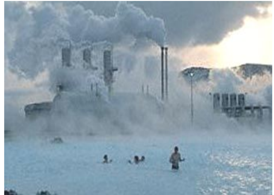
Паужетская геоТЭС на Камчатке

ГеоТЭС устроены относительно просто: здесь нет котельной, оборудования для подачи топлива, золоуловителей и многих других приспособлений, необходимых для тепловых электростанций. Поскольку топливо у таких электростанций бесплатное, то и себестоимость вырабатываемой электроэнергии низкая.