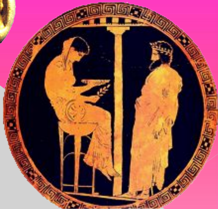
Царь Крез и дельфийский оракул