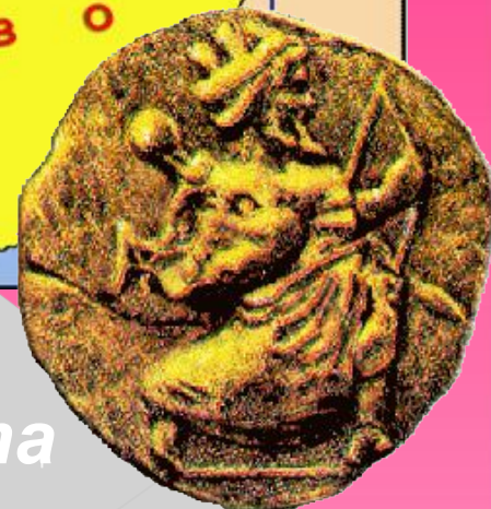
Персидская золотая монета