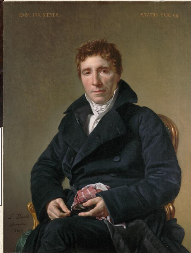
2 консул – Эммануэль Жозеф Сийес