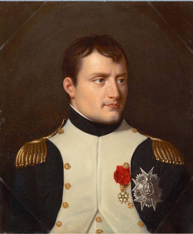
1 консул – Наполеон Бонапарт