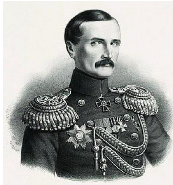
Владимир Алексеевич Корнилов

Боевая мощь: 6 линейных кораблей 2 фрегата 3 парохода 720 корабельных орудий Потери: 37 убитых 233 раненых 13 орудий