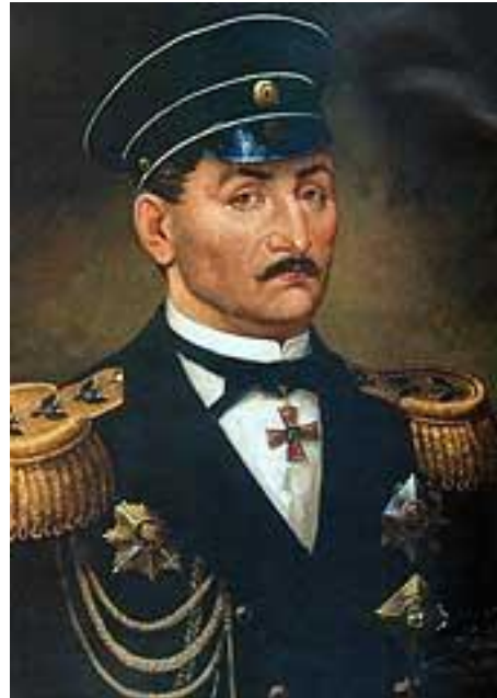
Нахимов Павел Степанович