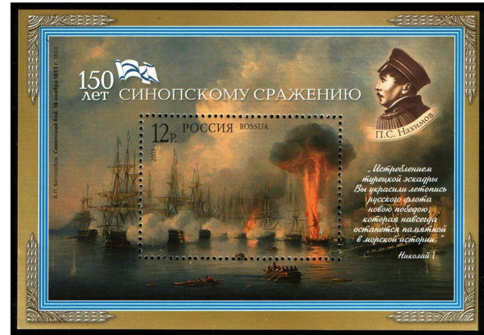
Почтовый блок России, посвящённый 150-летию Синопского сражения, 2003