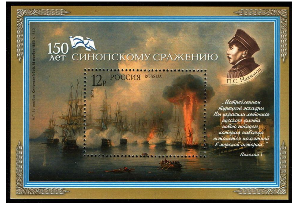
Почтовый блок России, посвящённый 150-летию Синопского сражения, 2003