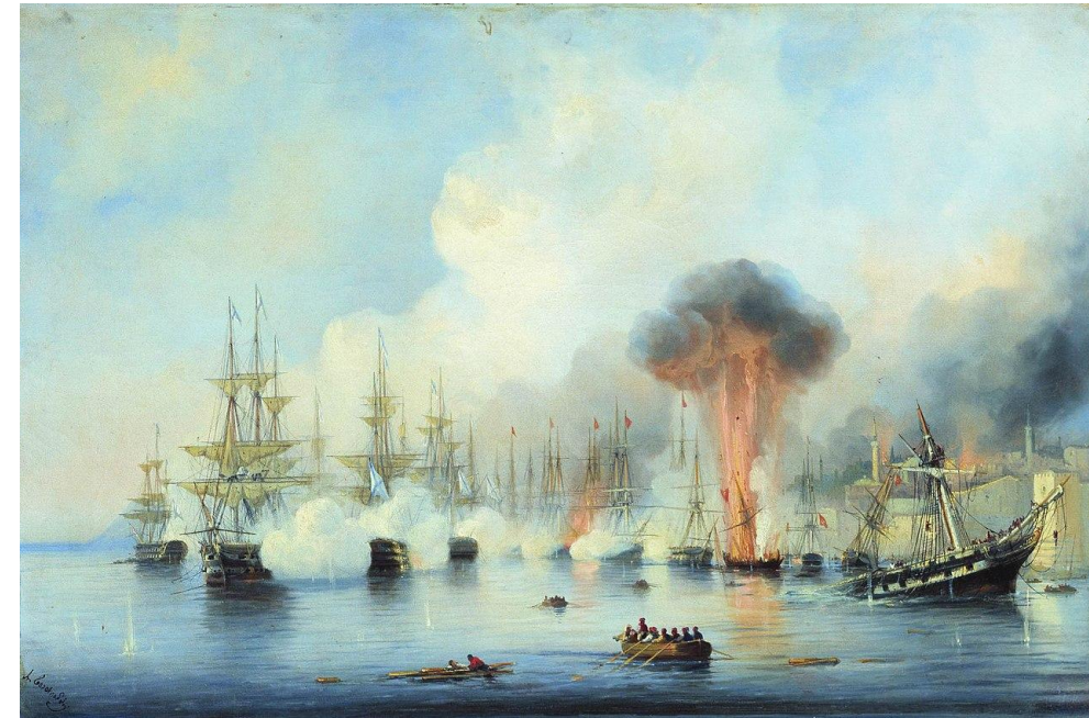
А. П. Боголюбов. Синопский бой 18 ноября 1853 года