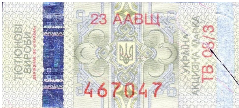
Украина. Марка для табачных изделий.