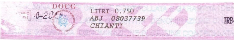
Италия. Марка для вина.