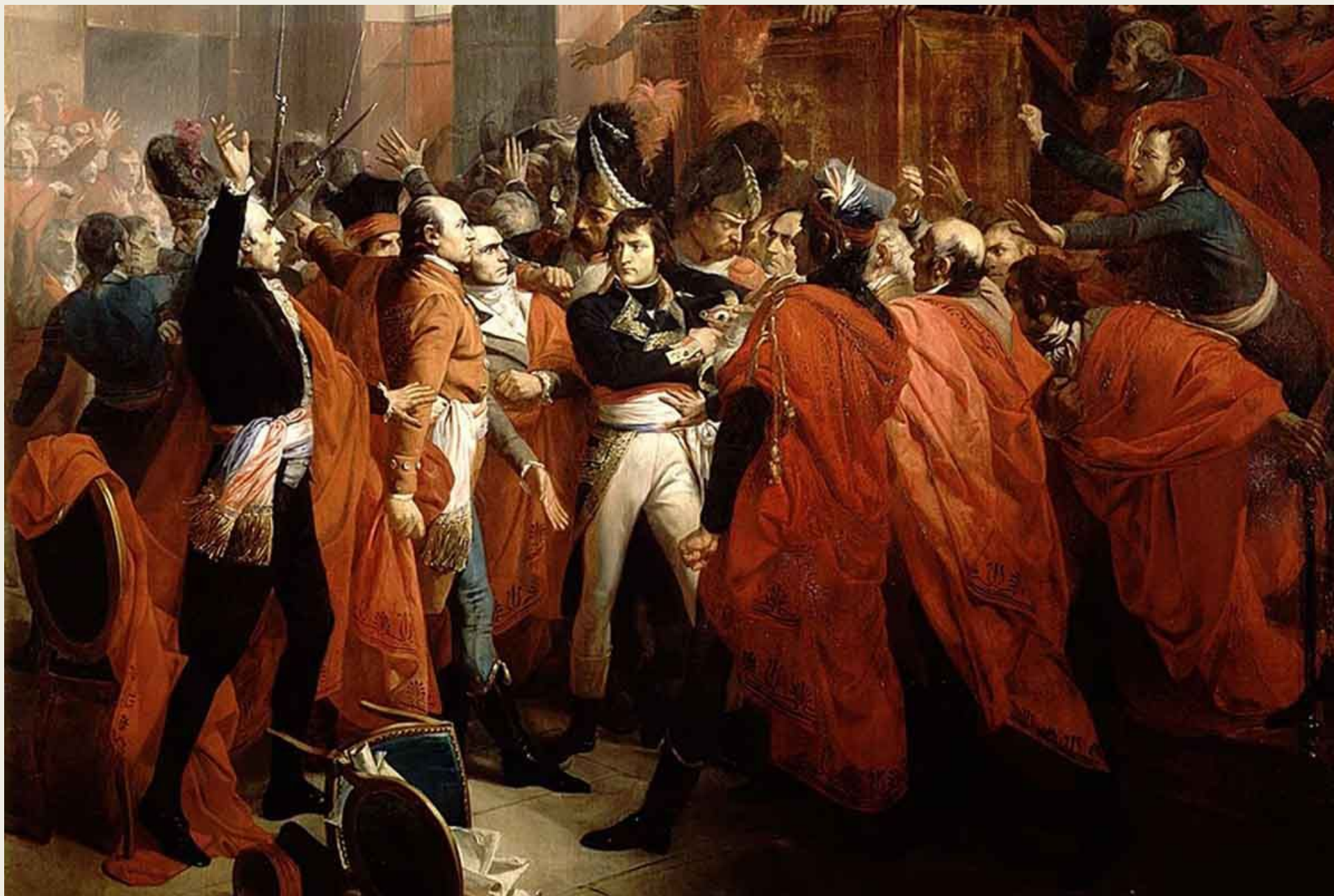
Ф. Бушо «Переворот 18»