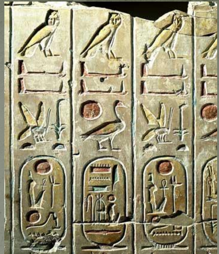
Тасқа жазылған иероглифтер.

Египеттіктер тасқа, ағаш қабығына, балшыққа, теріге жазған. Соның ішінде ең көп тарағаны папирус өсімдігінен жасалған қағаз-папирус болды.