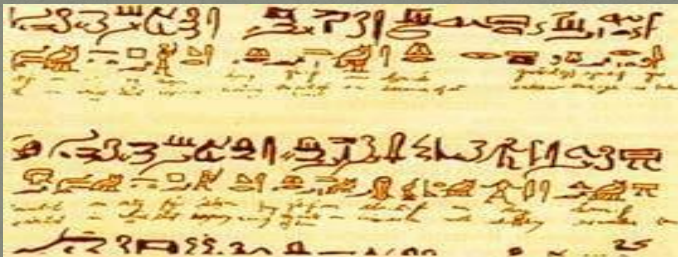
Түрлі жарақаттардың емі жазылған Смиттің хирургиялық папирусы ( б.з.б. 13 ғ.).