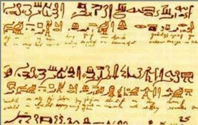
Папирусқа жазылған иероглифтер.

Египетте жазу өнері б.з.б. IV м.ж. пайда болды. Ең алғаш жазулар сурет ретінде салынған. Ең алғаш жазуларды таңбалар мен суреттер құрады. Бұндай таңбалар иероглифтер деп аталды, ал египеттік жазу иероглифика деп аталады. Олардың саны 700-ден аса болды, ал кейінірек тіпті бірнеше мыңға дейін жетті. Иероглифтер ондағы бейнелер қайда қарап тұр, солай оқылады. Оңнан