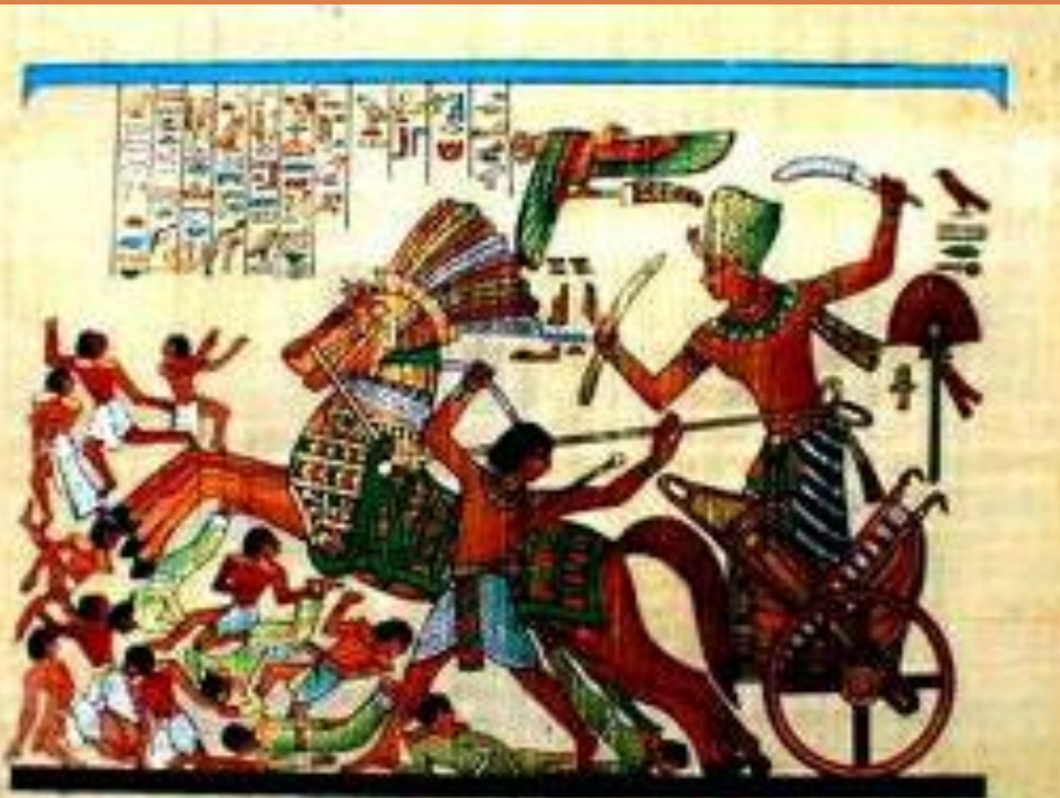
БИТВА ПРИ КАДЕШЕ (ПАПИРУС)

Одних египтян войны обогащали: фараоны щедро награждали военачальников и колесничих. Вельможи становились ещё богаче. Других египтян длительные войны доводили до обнищания. Войны разоряли основное население страны – её тружеников.