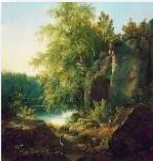
Вид на острове Валааме