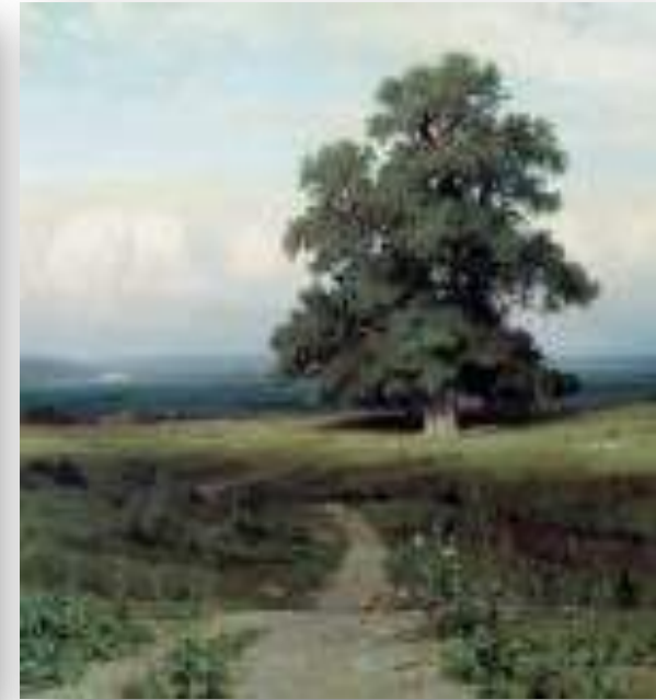
Среди долины ровныя

С особой охотой художник пишет породы самые мощные и крепкие типа дубов и сосен — в стадии зрелости, старости и, наконец, смерти в буреломе. Классические произведения Ивана Ивановича — такие, как «Рож» или «Среди долины ровныя...» (картина названа по песне А. Ф. Мерзлякова; 1883, Киевский музей русского искусства), «Лесные дали» (1884, Третьяковская галерея) — воспринимаются как обобщенные, эпические образы России.