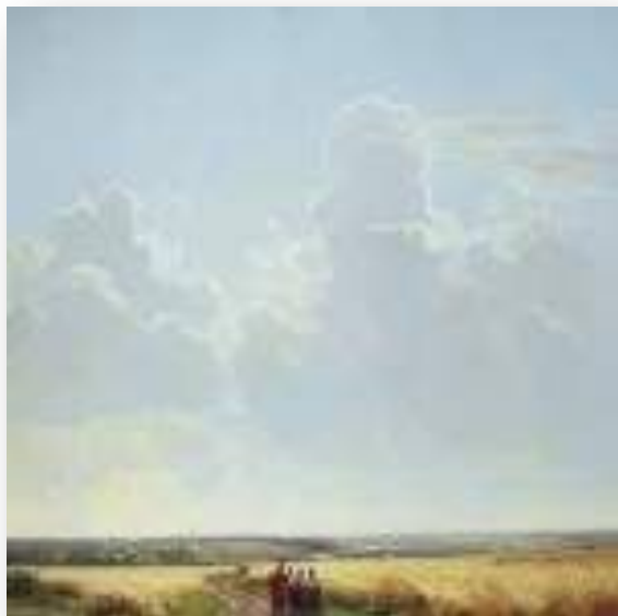
Полдень. В окрестностях Москвы