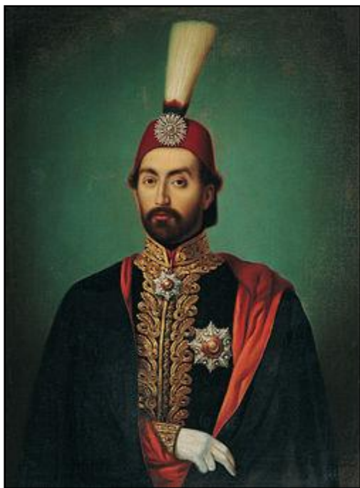
Абдул Меджит I Султан (1836-1861)