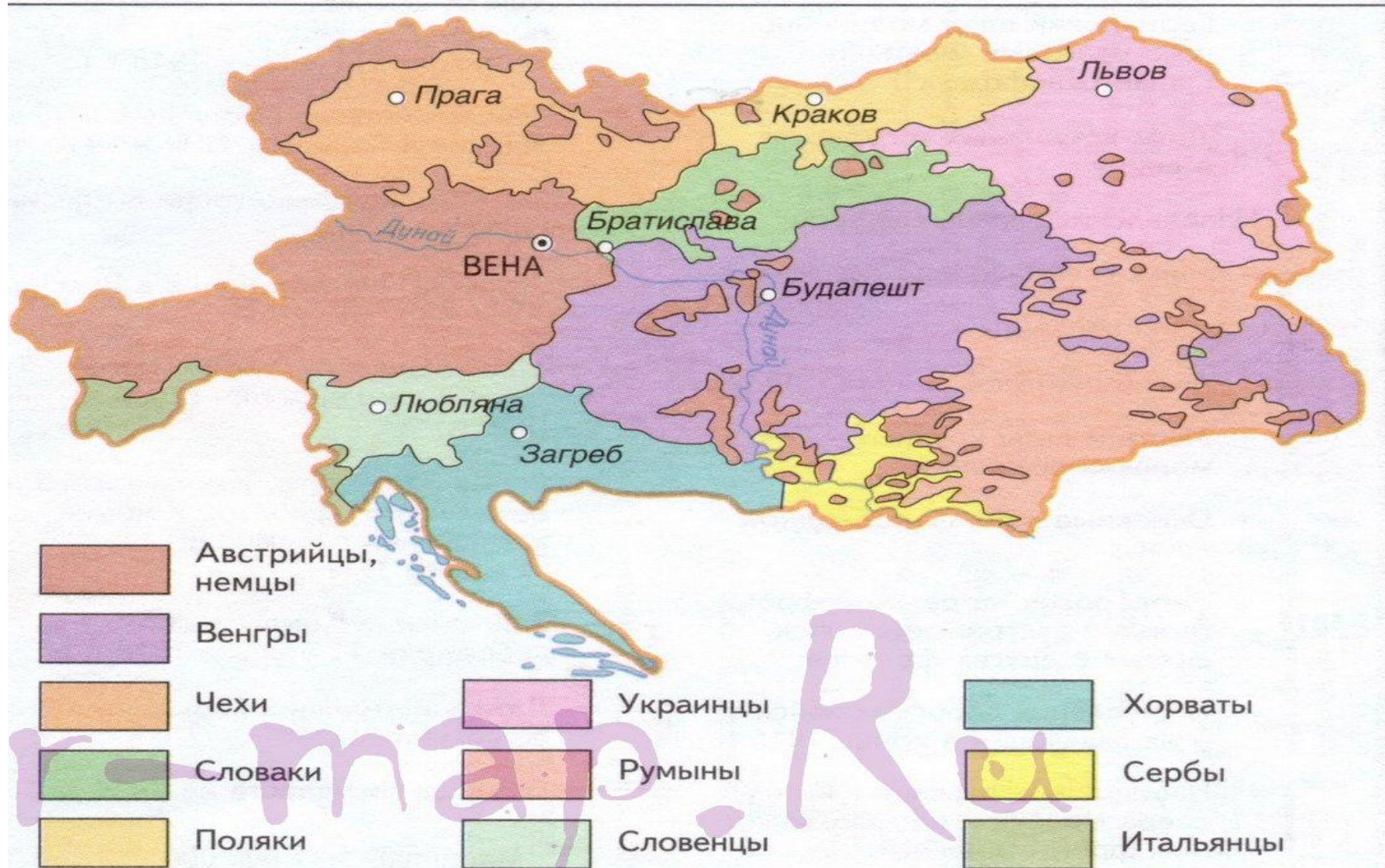
НАРОДЫ АВСТРО-ВЕНГРИИ в 1908 г. (схема)