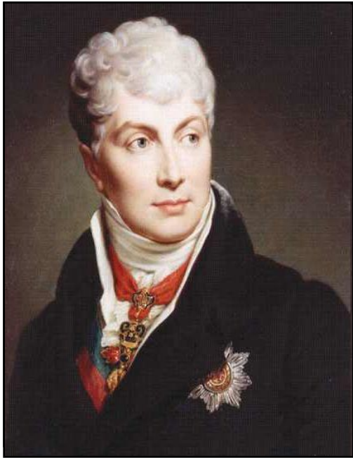
Канцлер К. Меттерних

Австрийская империя – абсолютная монархия