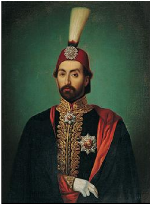
Абдул Меджит I Султан (1836-1861)