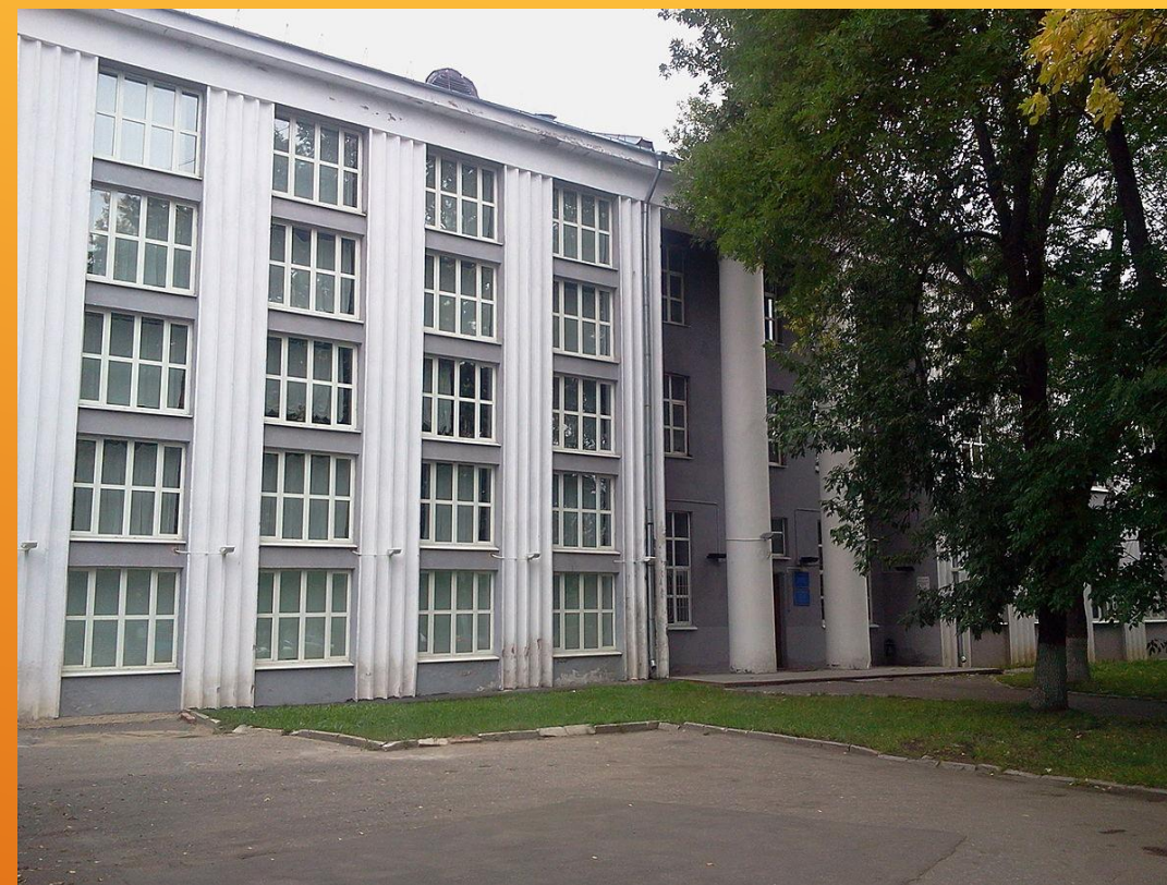
Научная библиотека в Иваново- Вознесенске