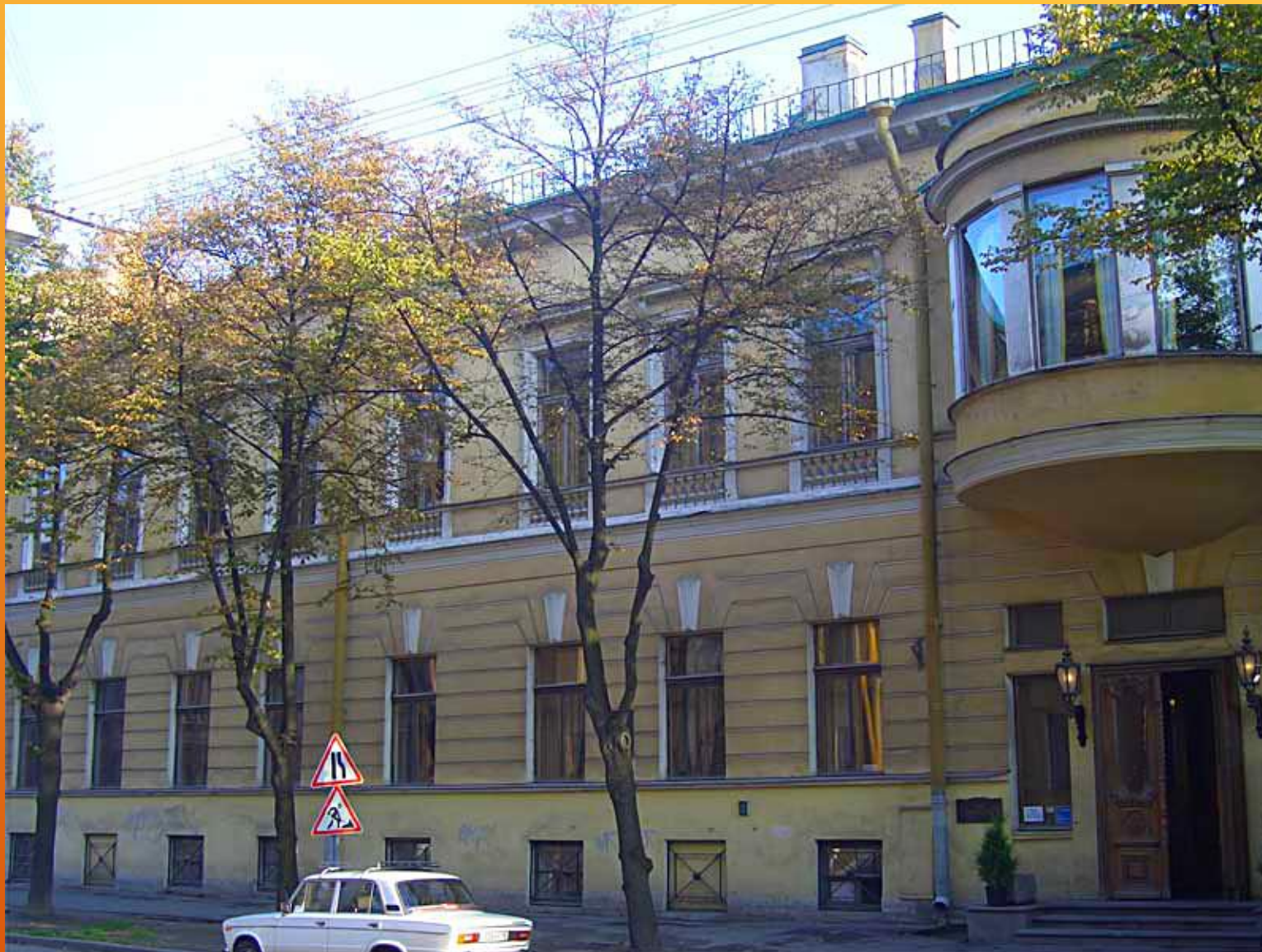
ДОМ ПОЛОВЦЕВА (Г. САНКТ-ПЕТЕРБУРГ)