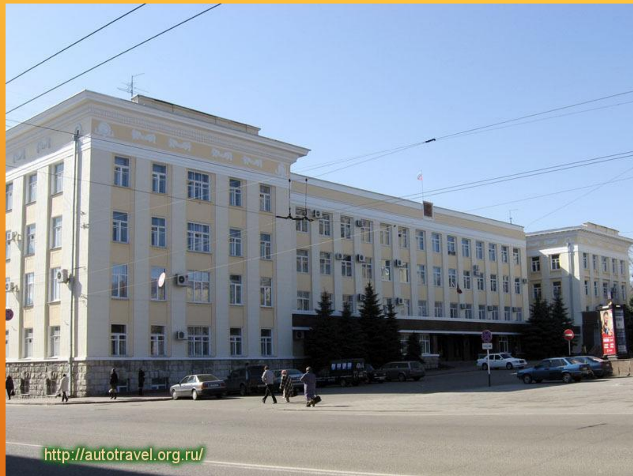
Дом Советов в Брянске