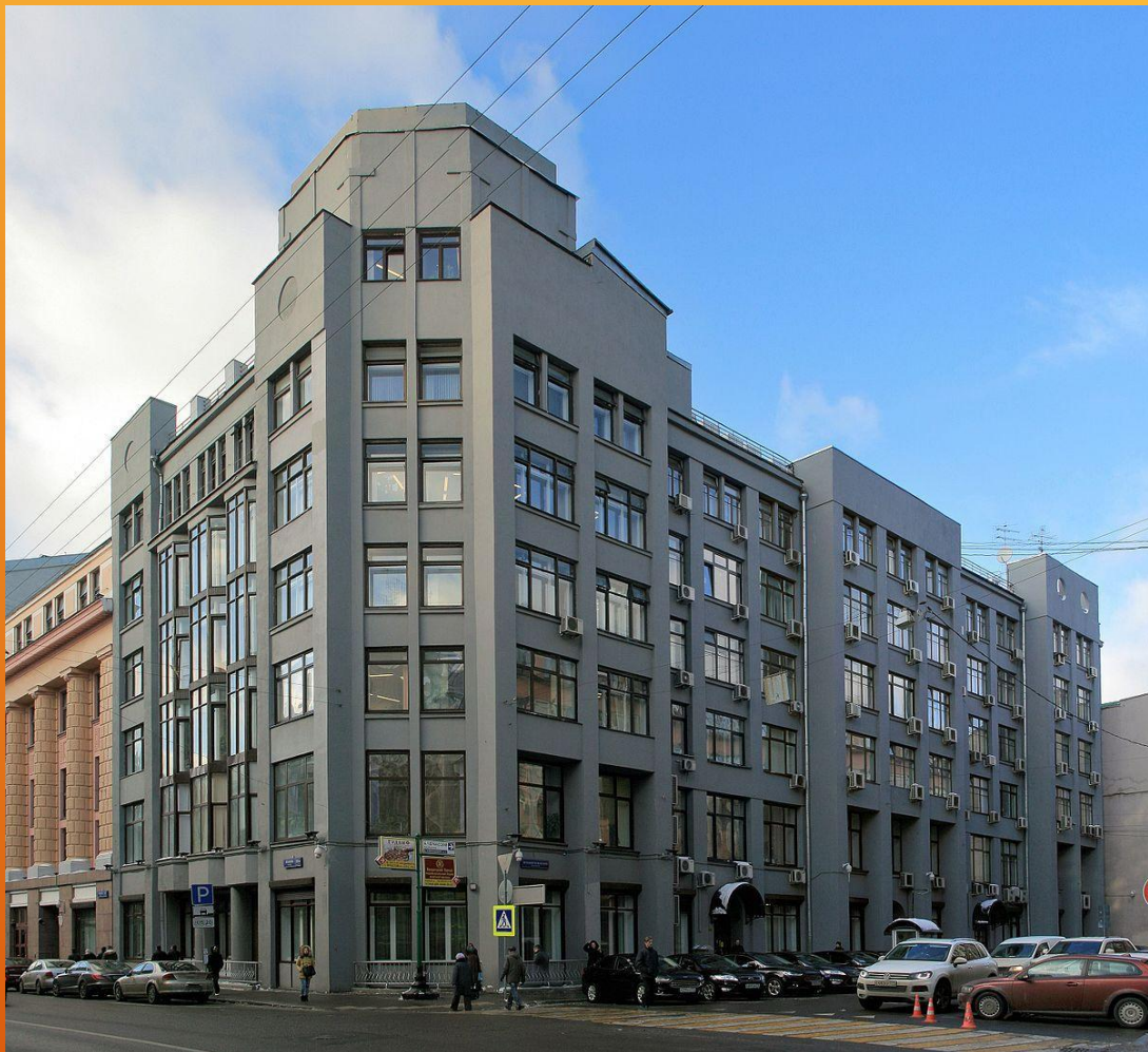
ЗДАНИЕ ОБЩЕСТВА «АРКОС» В МОСКВЕ