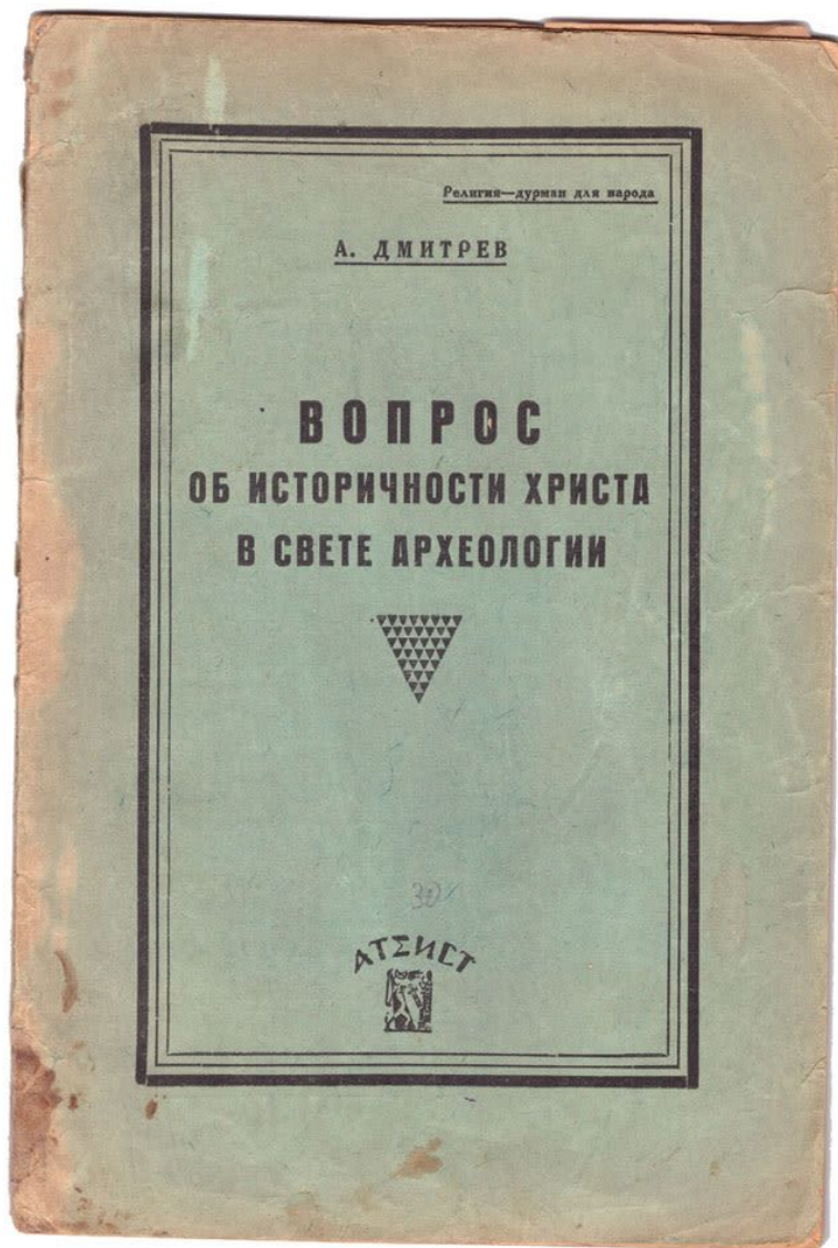
Рис. 1 – первая печатная работа А. Дмитрева