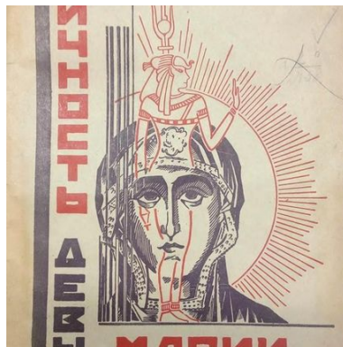
«Личность девы Марии в свете археологии»

Автор сравнивает этого персонажа христианской религии с богинями, такими, как Исида или Артемида, которые и послужили основой для создания образа.