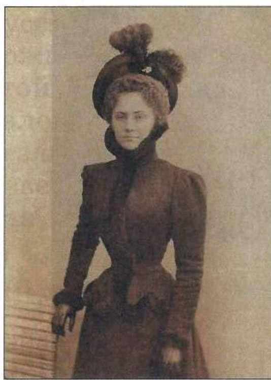
жакет с меховой опушкой