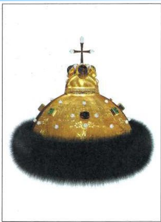
шапка с меховой опушкой