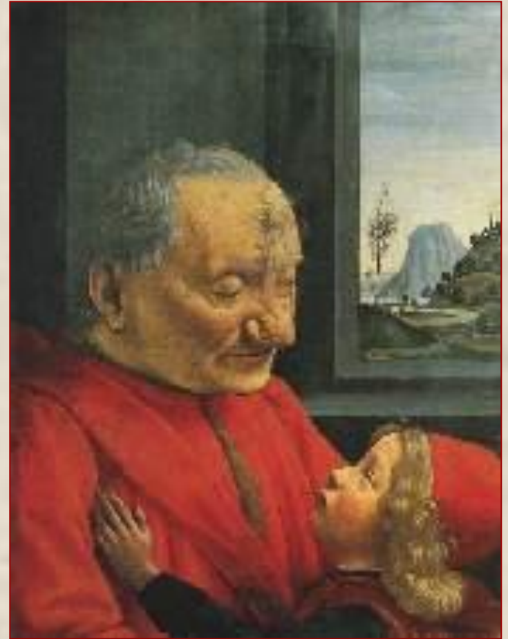
Портрет старика с внуком Гирландайо Д. Италия 1480

Портрет старика, несмотря на натуралистические подробности, полон обаяния.