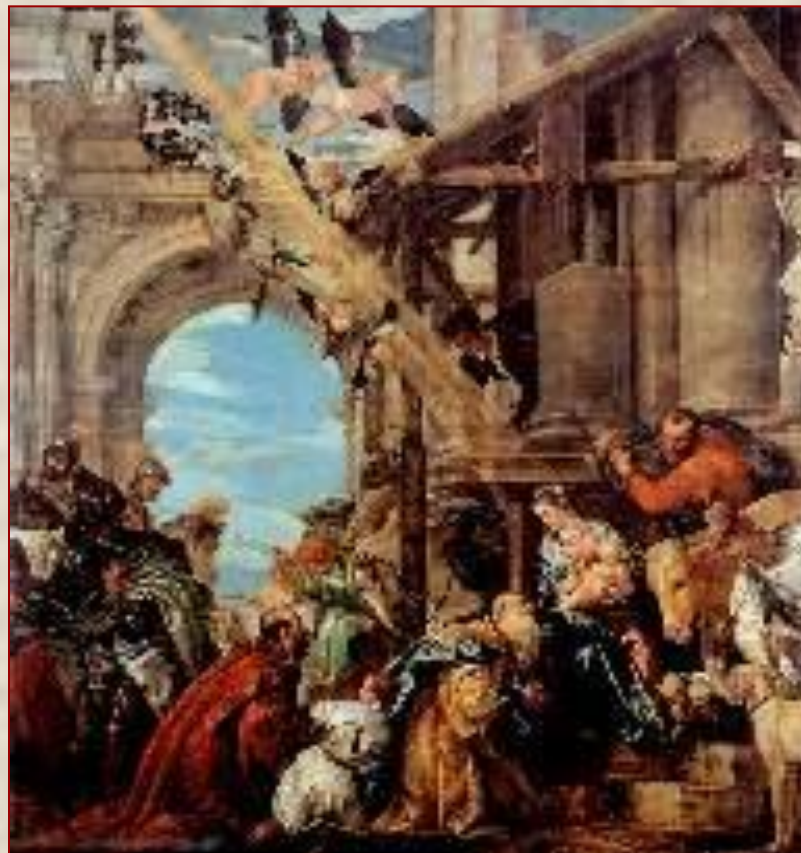
Поклонение волхвов Веронезе П. Италия. Начало 1570-х годов

Паоло Кальяри (Веронезе), Это был необычайно одаренный художник - в 25 лет он уже прославился росписями для венецианского Дворца Дожей. Паоло быстро завоевывал художественный Олимп Венеци, демонстрируя в своих работах богатство и гармонию красочной палитры, безупречный рисунок, прекрасное чувство композиции. Как и большинство художников его времени, Веронезе писал в основном картины на религиозные и мифологические сюжеты. Маленькая (45х34 см) картина "Поклонение волхвов" уникальное произведение. Его можно увеличить до размеров фрески, и оно не потеряет своих художественных достоинств. Веронезе воссоздал один из самых значительных моментов жизни Христа.