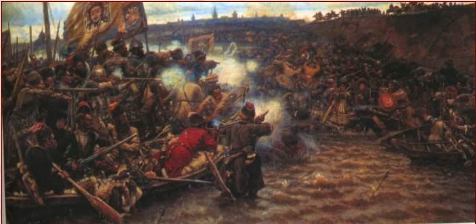
Василий Суриков. Покорение Сибири Ермаком.

События прошлого, библейские истории и былинные времена вдохновляют художников на создание картин этого жанра. Творчество Сурикова – яркий пример исторической живописи.