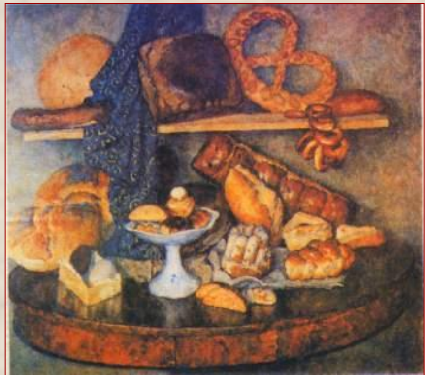
И. Машков. Московская снедь. хлеба