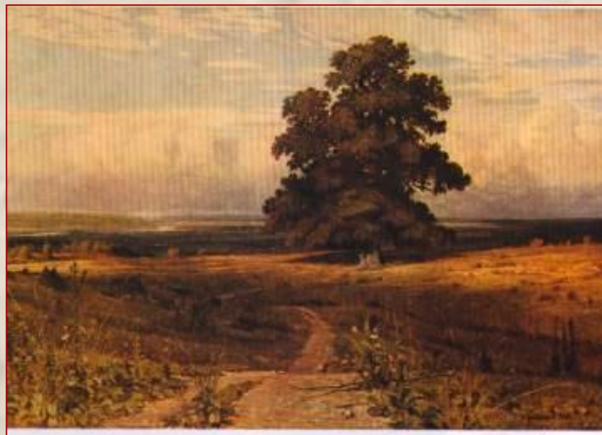
И. Шишкин. Среди долины ровныя...

Бескрайние просторы полей, Колышущееся под свежим ветром море колосьев, лесные дали на картинах Шишкина порождают мысли о былинном величии и мощи русской природы.