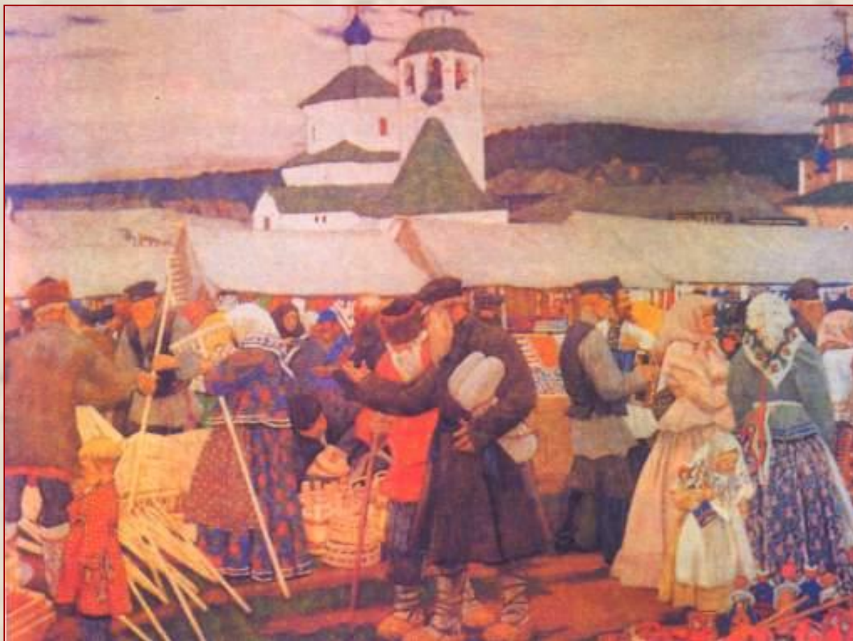
Б. Кустодеев. Ярмарка.

Бытовой жанр – картины о различных событиях в жизни людей.