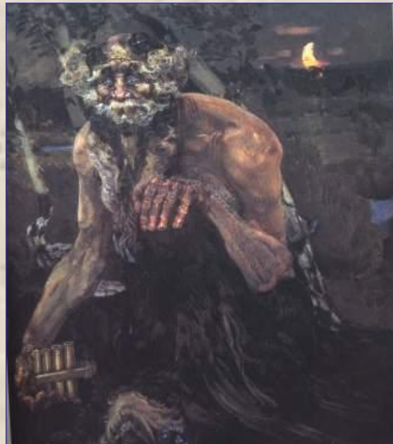
Михаил Врубель. Пан.