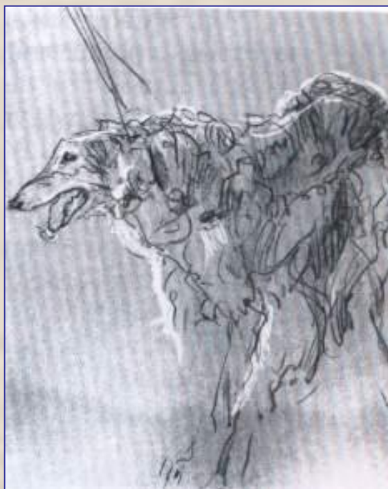
В. Серов. Борзая.