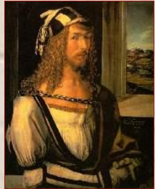
Автопортрет в 26 лет Дюрер А. Германия 1498

Художник изобразил себя под аркой на фоне окна с тщательно прописанным пейзажем. Молодой красивый мужчина в богатой, элегантной одежде, с роскошными, струящимися по плечам, золотистыми волосами. Умный, проницательный взгляд. Перед нами самодостаточный человек. Дюрер открывает зрителю ценность индивидуальности, осознанность собственной значимости. Характерный жест сложенных, крепко сжатых рук выдает огромную внутреннюю энергию, готовность к действию, решимость. С 1498 года у Дюрера была собственная мастерская и он пользовался успехом как художник и был известен как эрудит. За универсальность взглядов и знаний и пристальное изучение природы Дюрера называли "северным Леонардо да Винчи".