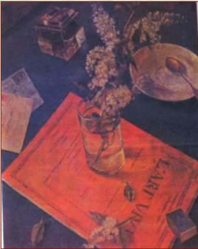
К. Петров – Водкин. Натюрморт с черёмухой.

В России мастерами натюрморта были П. Кончаловский, И. Машков, К. Петров – Водкин, М. Сарьян и др.