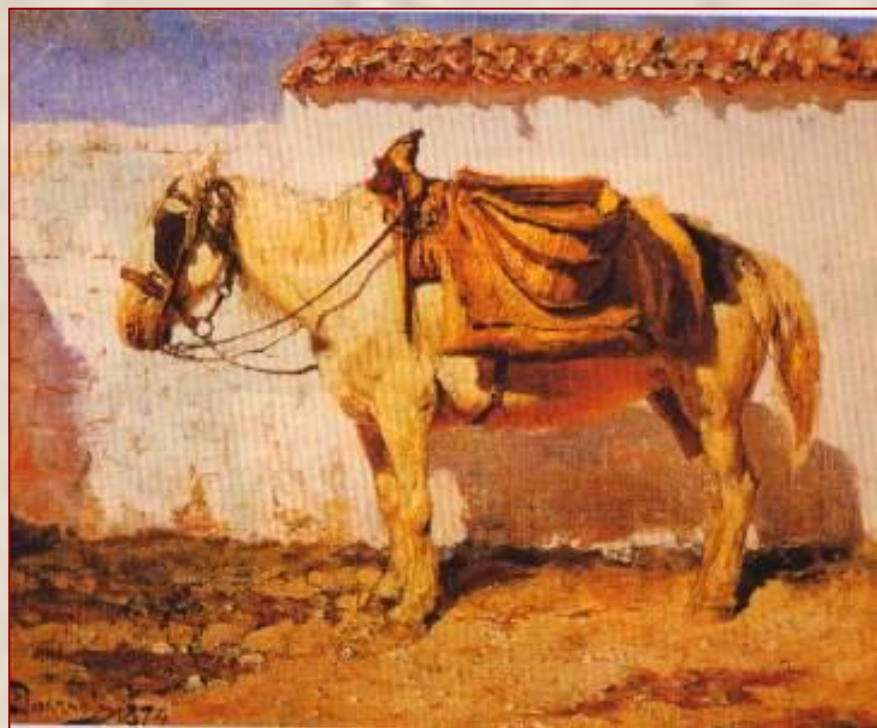
В. Поленов. Белая лощадка.