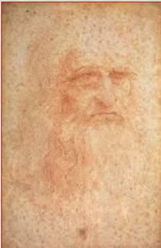
Автопортрет Леонардо да Винчи Италия 1512

Творчество Леонардо да Винчи (1452 - 1519), гения итальянского Возрождения, вызывает восхищение людей вот уже пятьсот лет. Великий ученый и мыслитель, гениальный художник, он соединил в себе весь опыт, накопленный европейской культурой, и осмыслил его.