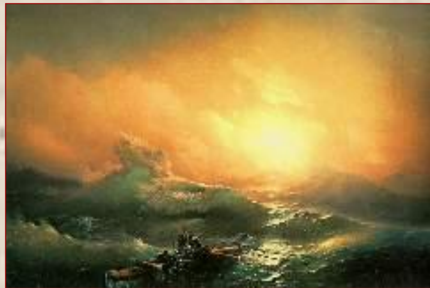
Девятый вал Айвазовский И.К. Россия 1850

Разбушевавшаяся стихия и борющийся с ней человек, который не сдаётся, - тема прославленной марины. Чарующе красиво бурное море, написанное яркими, поражающими своим великолепием синими, оранжевыми, зелеными и желтыми цветами. Небо и море слились на полотне воедино, миллиарды брызг, вздымаемых сильным ветром, стерли грань между ними. Ветер подхватывает вспененный гребень самой страшной волны - девятого вала - и неожиданно зритель видит приоткрытую для нас красоту - сквозь толщу воды проникает свет, окрашивая ее сочным бирюзовым цветом.