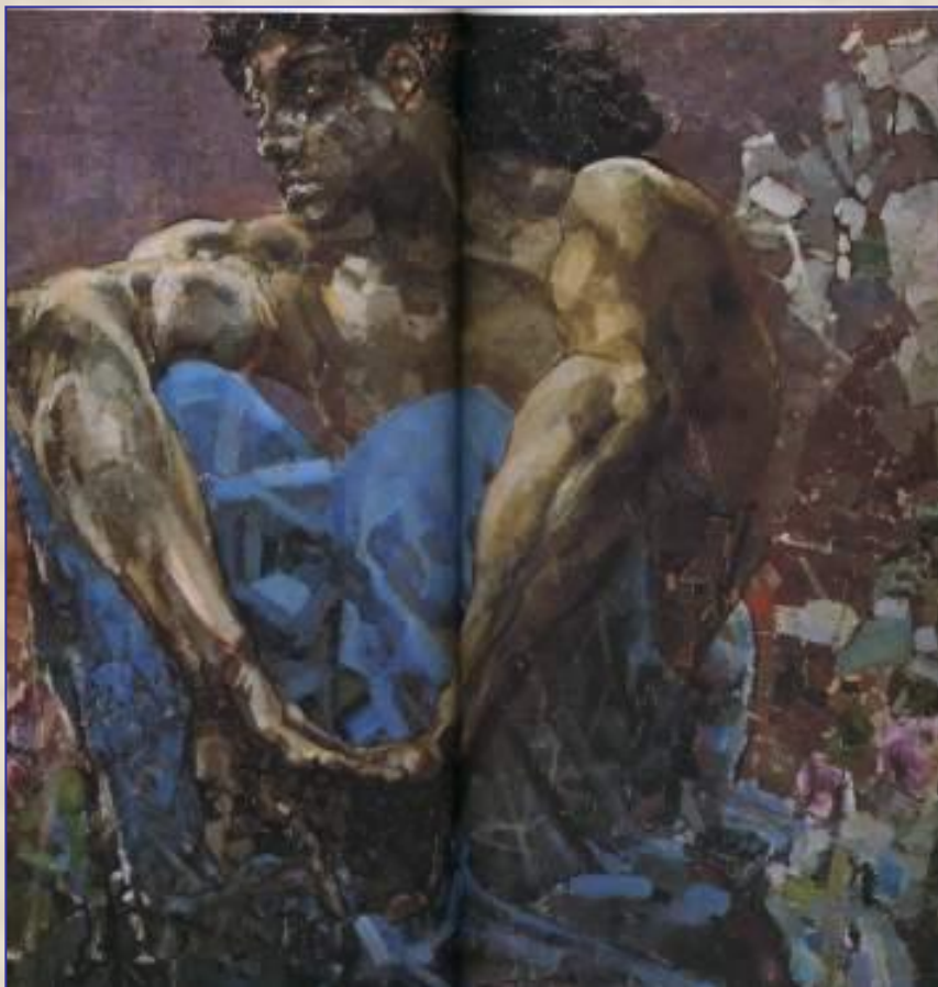
Михаил Врубель. Демон

Картины написанные на сюжеты из мифов, относятся к мифологическому жанру.