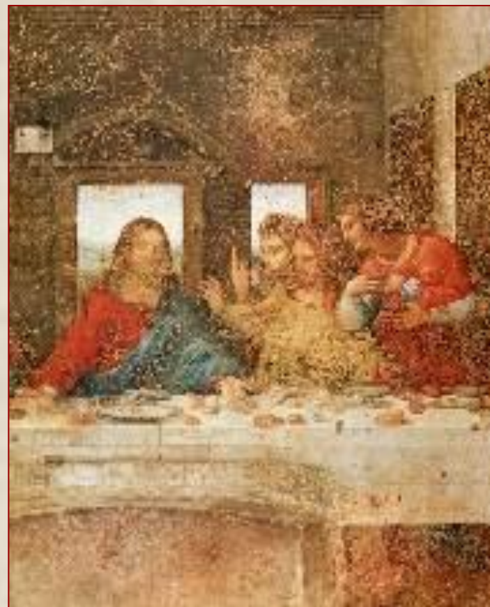
Тайная вечеря. Фрагмент Леонардо да Винчи Италия 1497

К несчастью, это произведение дошло до нас в плохом состоянии. Написанное масляными и непрочными красками прямо на стене, оно было подпорчено уже в 1500 г. наводнением. Кроме того, руководство монастыря из хозяйственных соображений пробило в картине дверь.