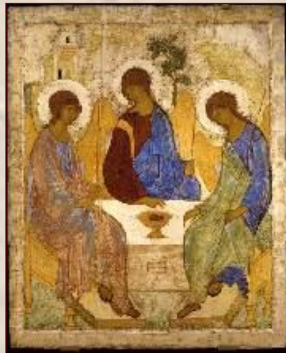
Троица Рублев Андрей Россия 1420-е годы

"Троица" Андрея Рублева стала образцом для многих поколений иконописцев. Вплоть до конца XVII века большинство изображений Святой Троицы так или иначе было ориентировано на рублевский оригинал. Так, знаменитый Стоглавый собор 1551 года на вопрос о том, как писать иконы Святой Троицы, дал следующий ответ: "Писать живописцам иконы с древних образцов, как греческие живописцы писали и как писал Андрей Рублев и прочие пресловущие живописцы. А от своего замышления ничтож претворяти".