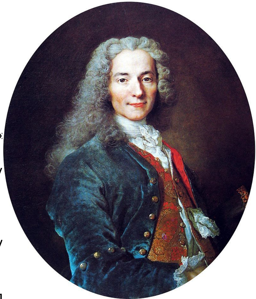
Франсуа Вольтер (1694-1778)

Философ, писатель, публицист, один из основоположников французского Просвещения. Страстно выступал против религии : «Раздавите гадину!» Выступал за гуманное отношение к простому народу и уважение его прав. Идеалом государства считал «просвещённый абсолютизм» . Вёл переписку с «просвещёнными» монархами Европы, в том числе с Екатериной II, и давал практические советы по обустройству государства.