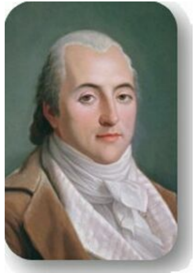
Клод Сен-Симон (1760-1825)

Выдвинул идею о замене существующей религии «новой религией», смыслом которой будет лозунг « Человек человеку – брат ».