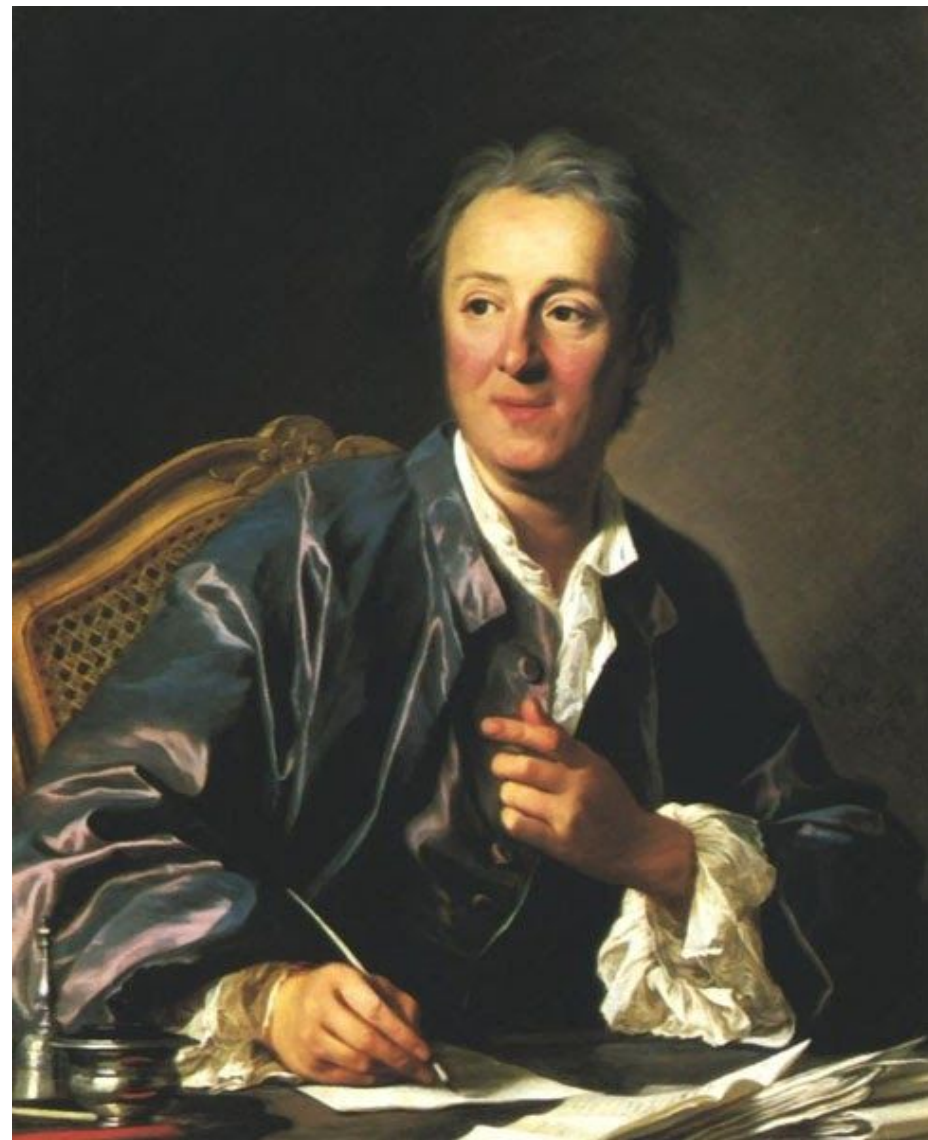
Дени Дидро (1713-1784)

Идеалом экономической системы считал свободный