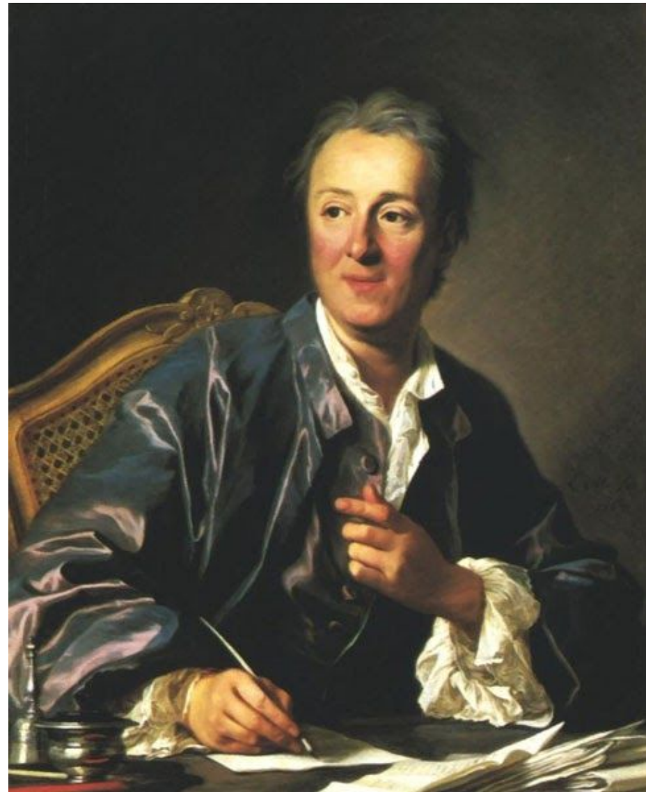
Дени Дидро (1713-1784)

Идеалом экономической системы считал свободный