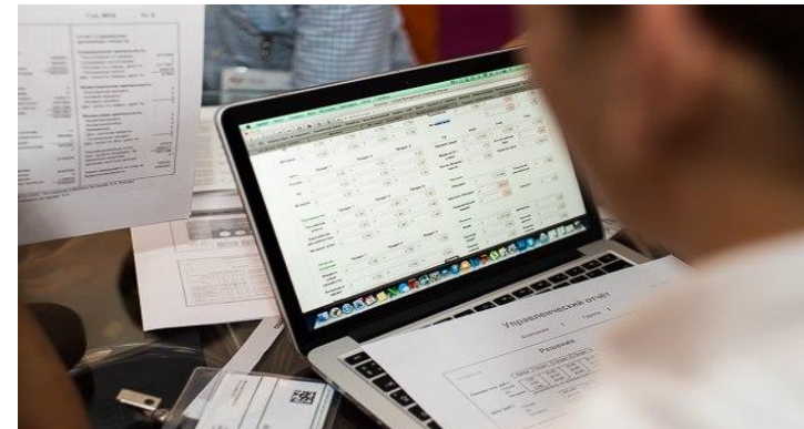
Пример работы с цифровой платформой ГМС и управленческой отчетностью