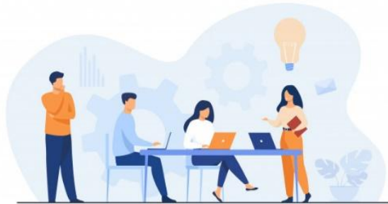
Команда из 3-5 человек