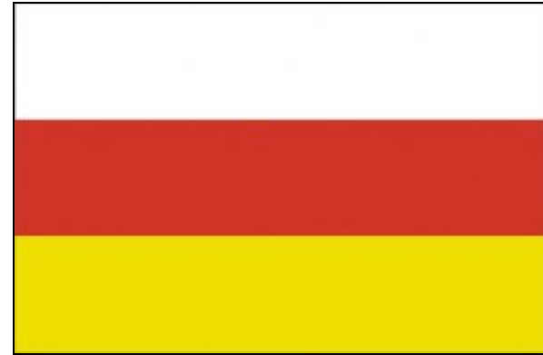
Республика Северная Осетия