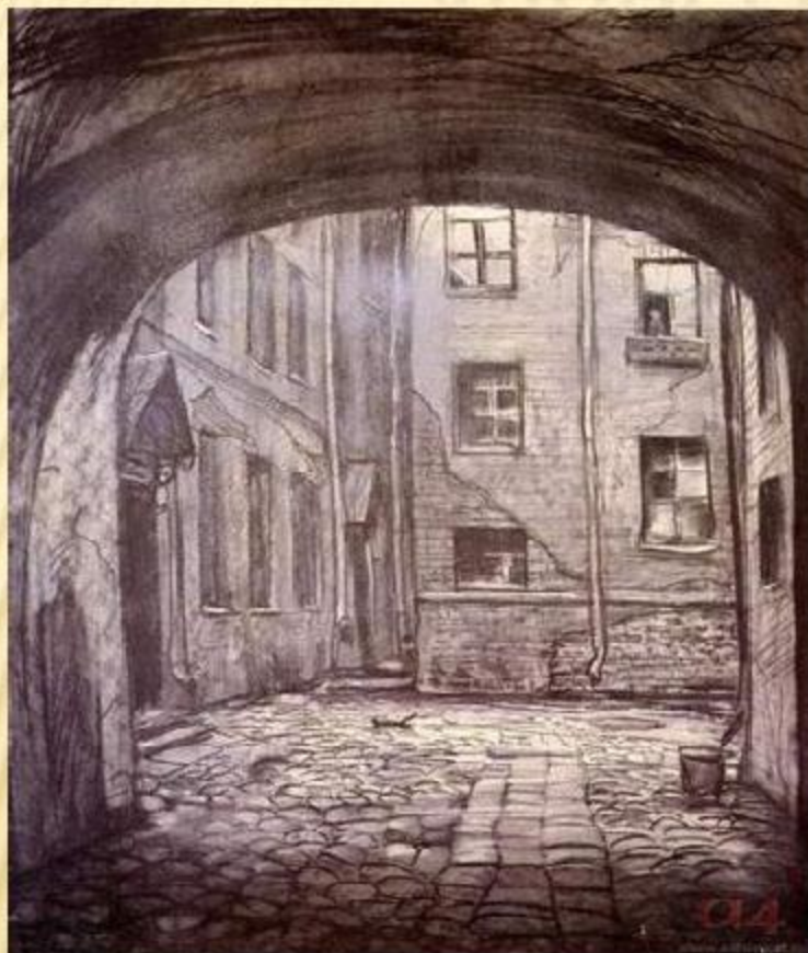
«Преступление и наказание». Двор Раскольникова. Художник И. Глазунов