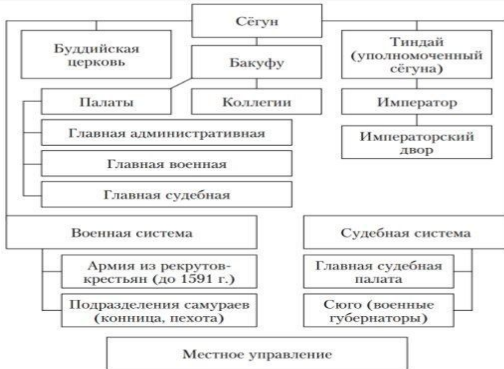
Рис. 26. Государственный строй Японии в XIII–XVII вв.