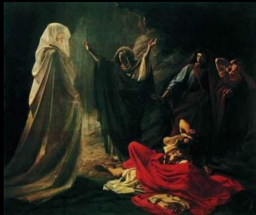
Саул у Аэндорской волшебницы