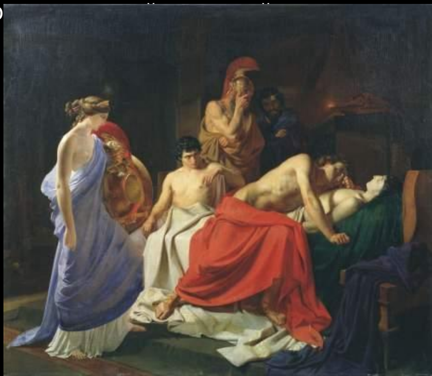
Ахиллес, оплакивающий Патрокла