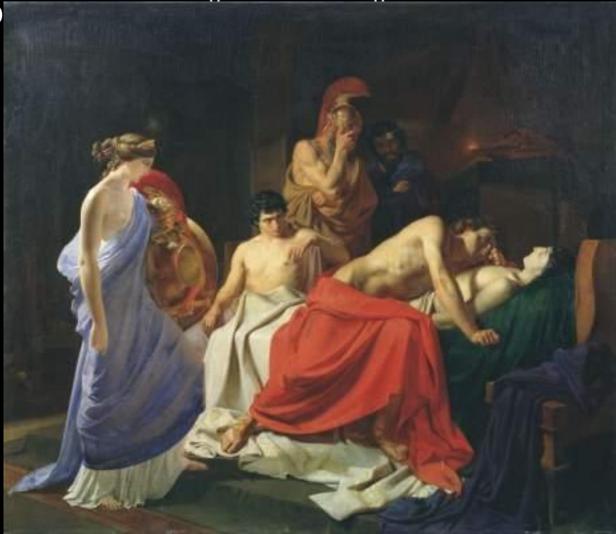
Ахиллес, оплакивающий Патрокла