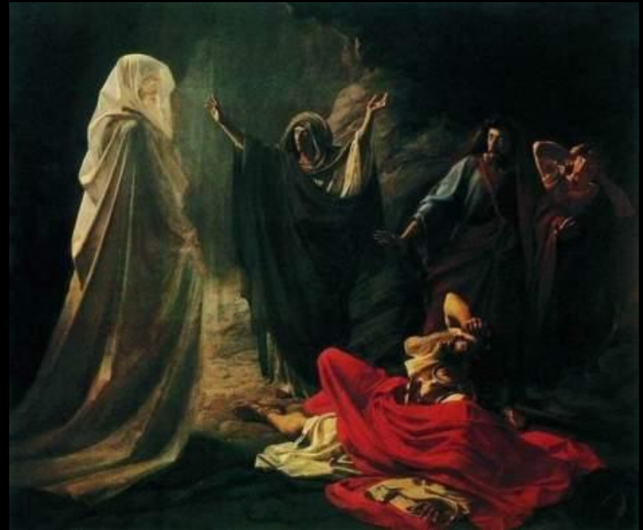
Саул у Аэндорской волшебницы