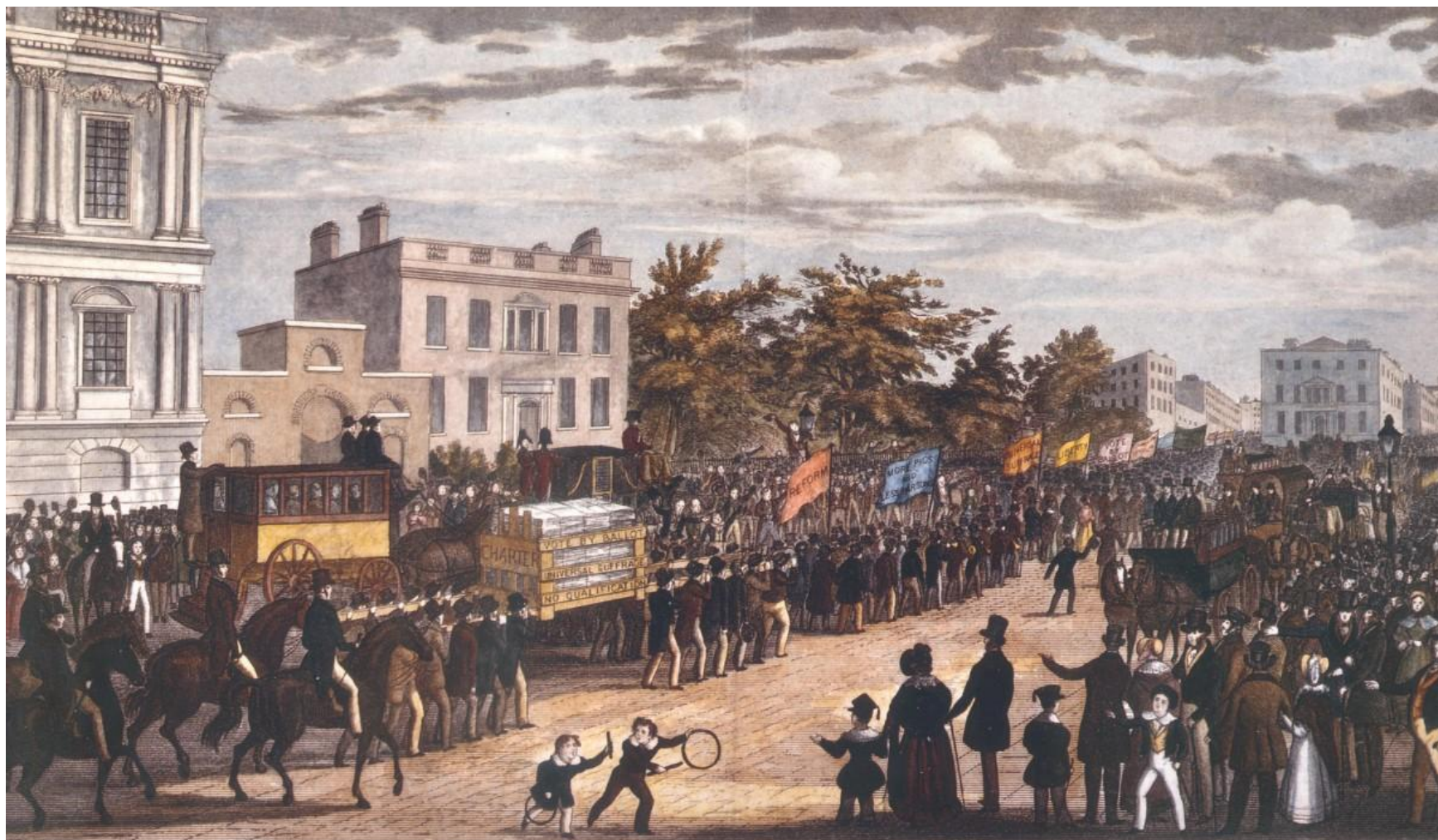
PROCESSION ATTENDING THE GREAT NATIONAL PETITION OF 3,317,702, TO THE HOUSE OF COMMONS, 1842.