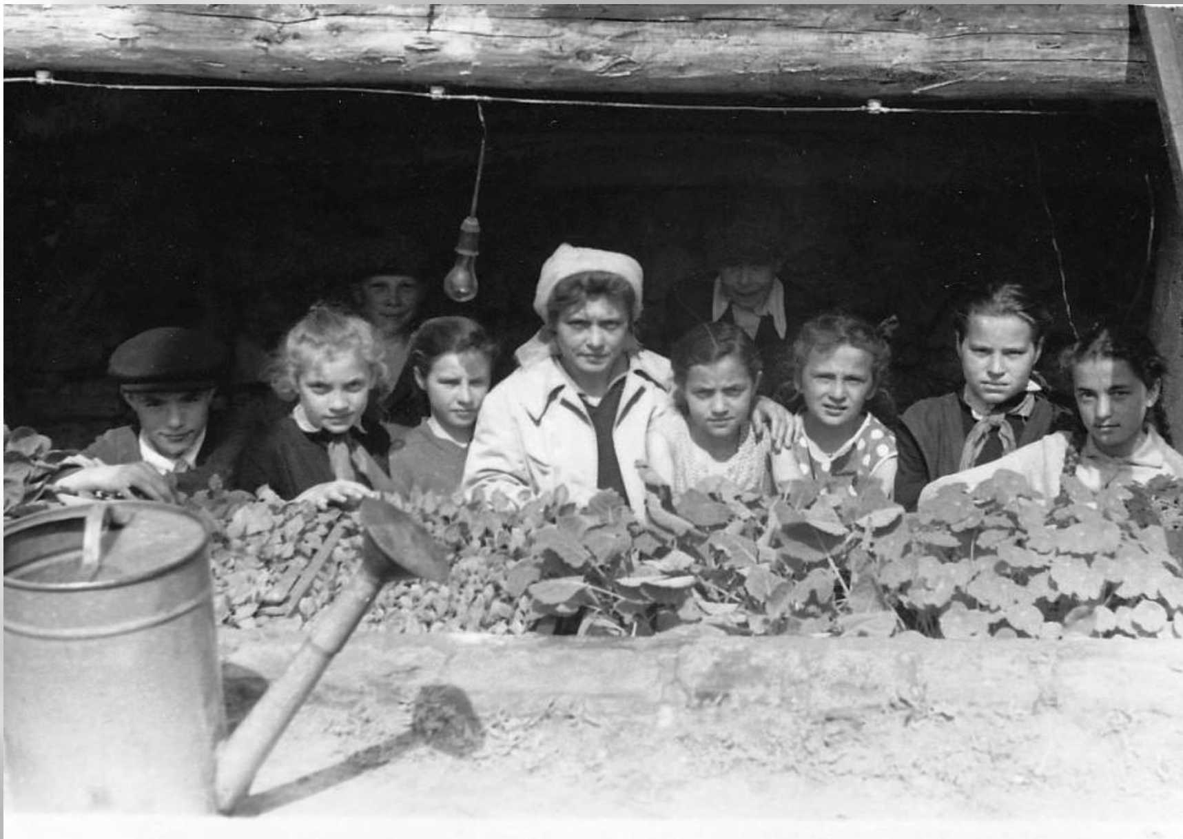
Приусадебный участок. Моя бабушка-учитель биологии.