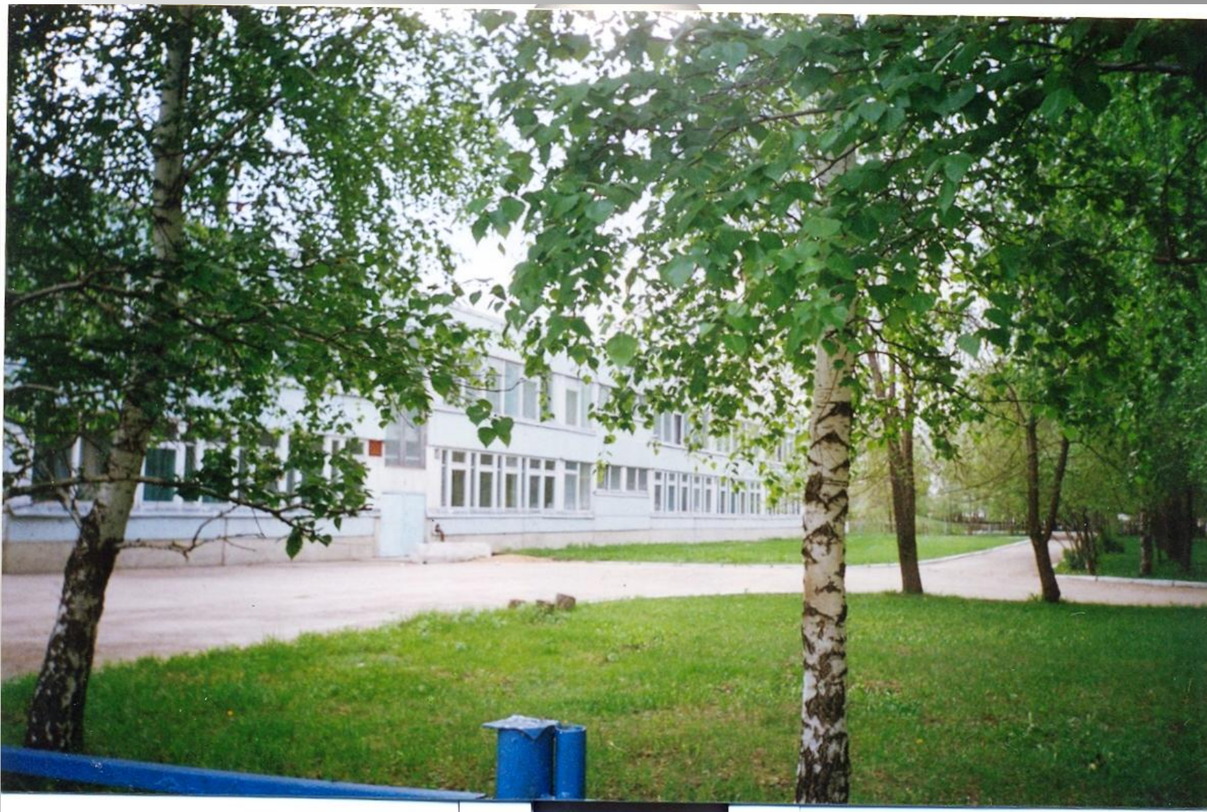
Здание новой экспериментальной школы