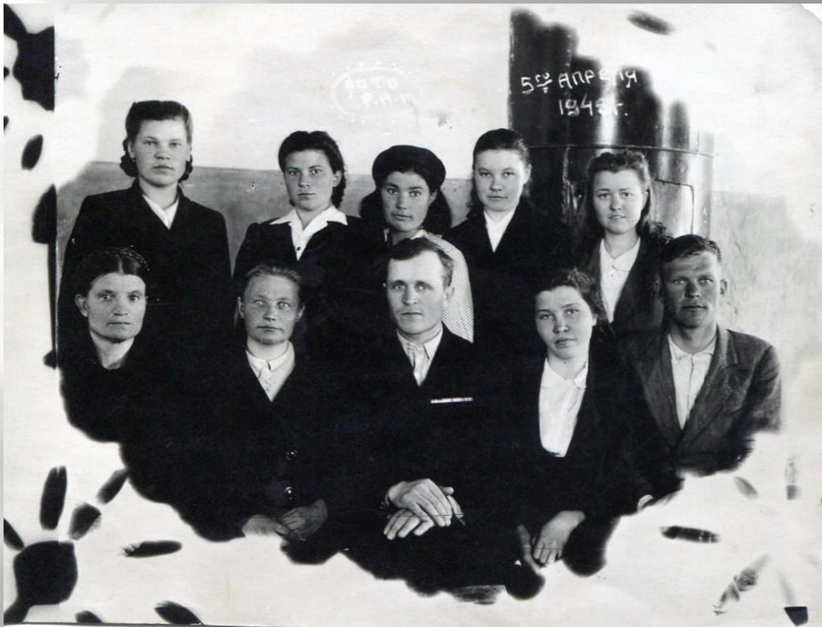
Педагогический коллектив. 1948г.