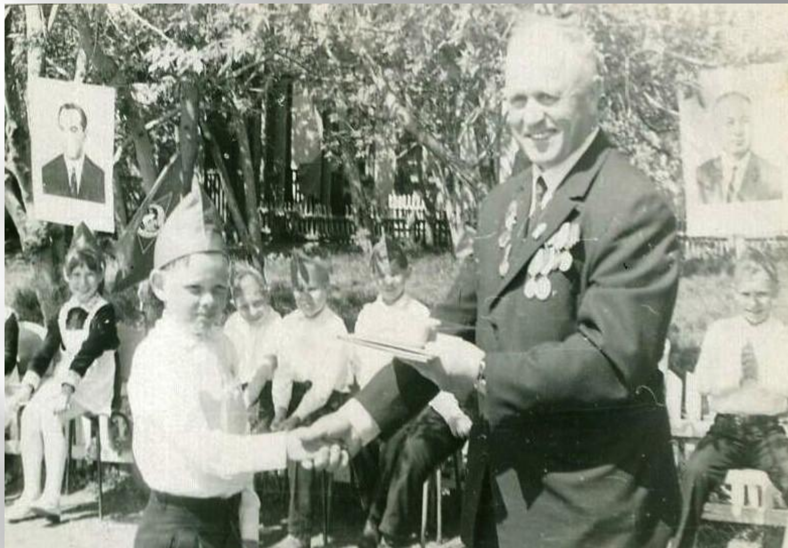
Награждение отличников. 1978г.