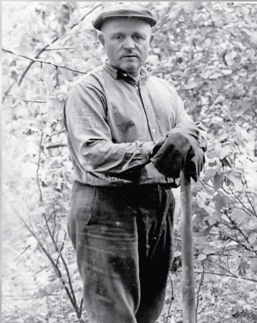
Директор Приморской школы