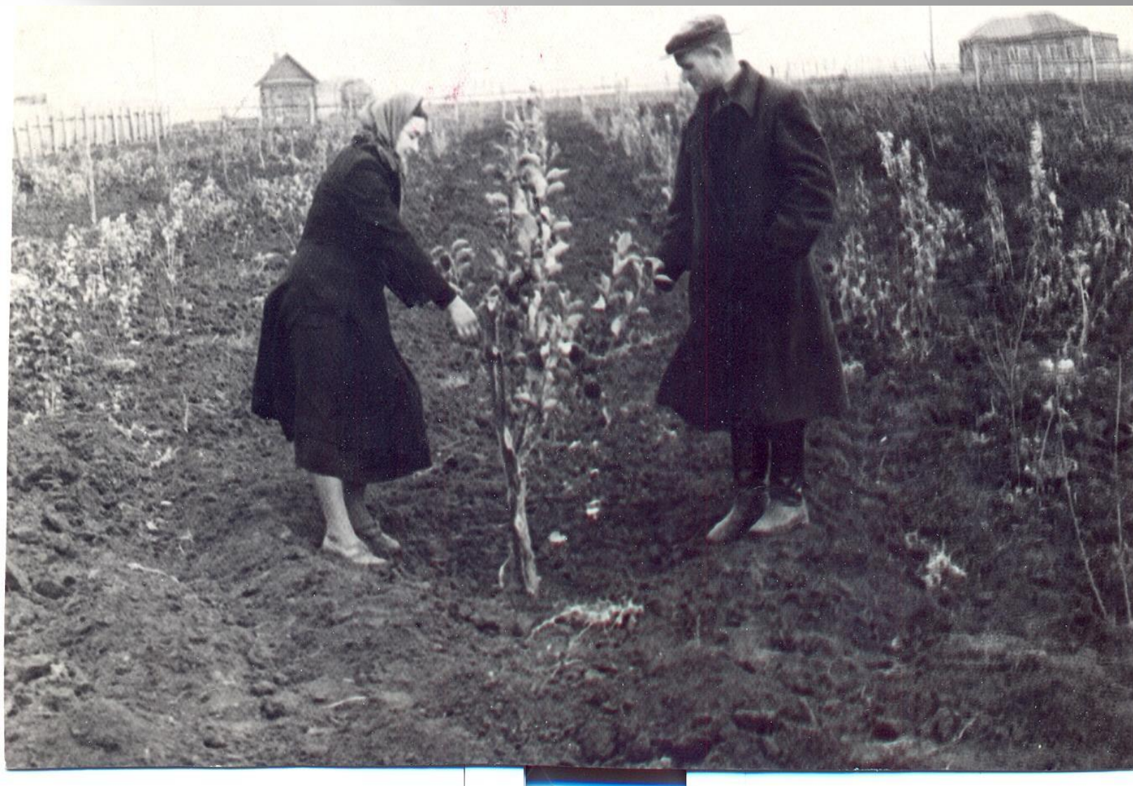
Закладка фруктового сада в школе. 1954г.