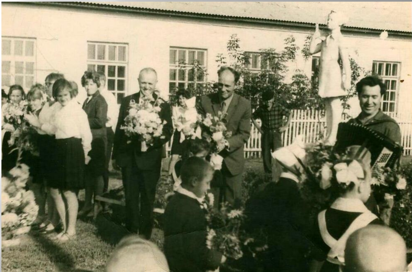
Открытие нового здания старой школы 1962 г.