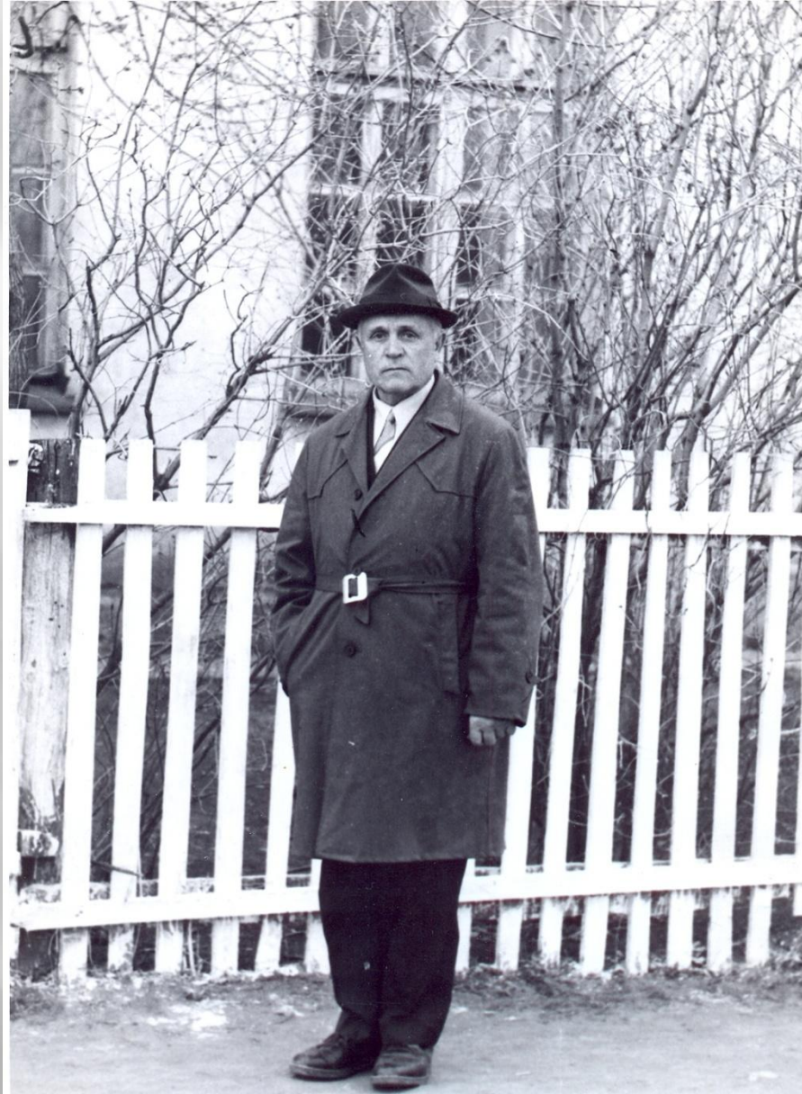
Директор у здания старой школы