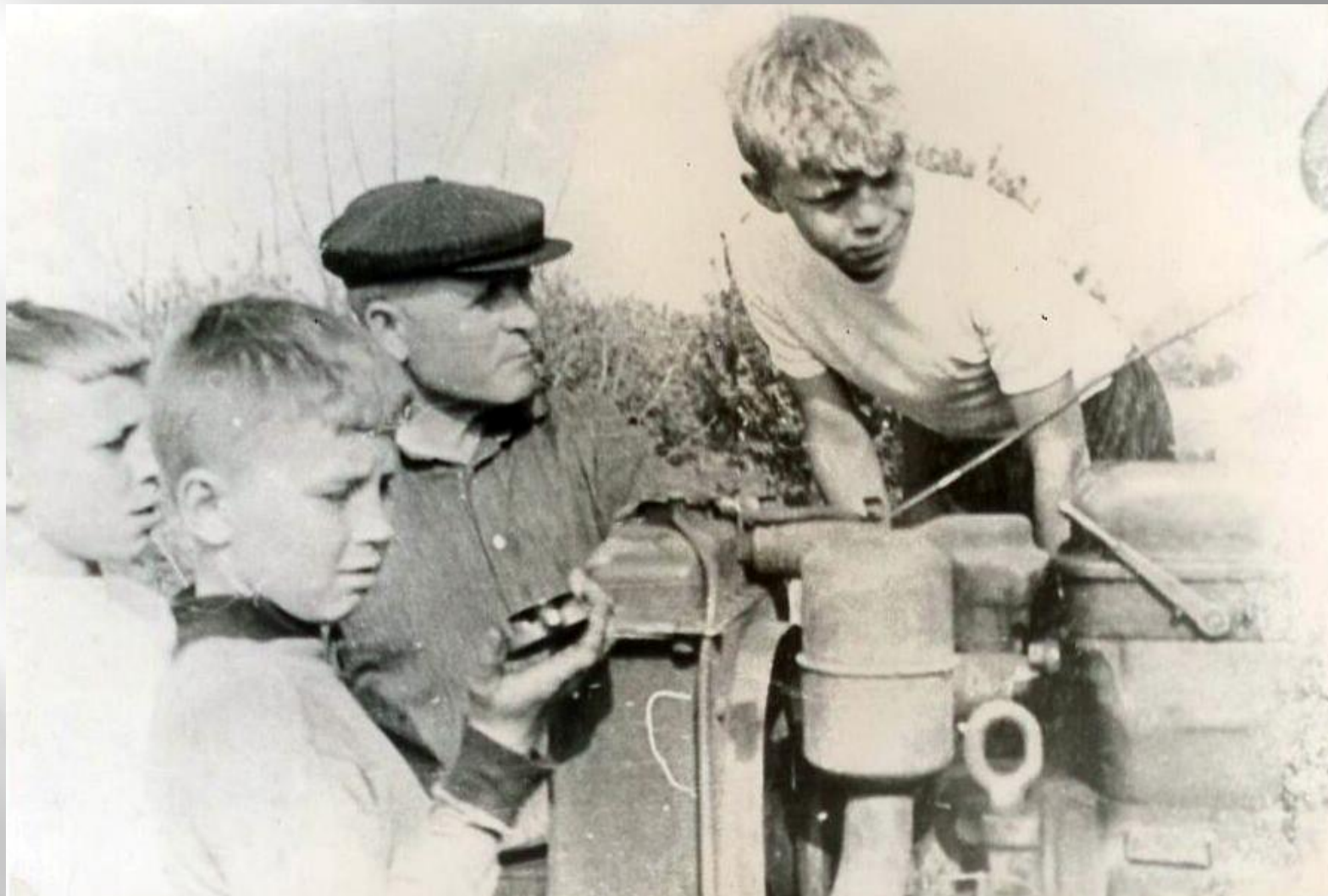
Занятия юных механизаторов