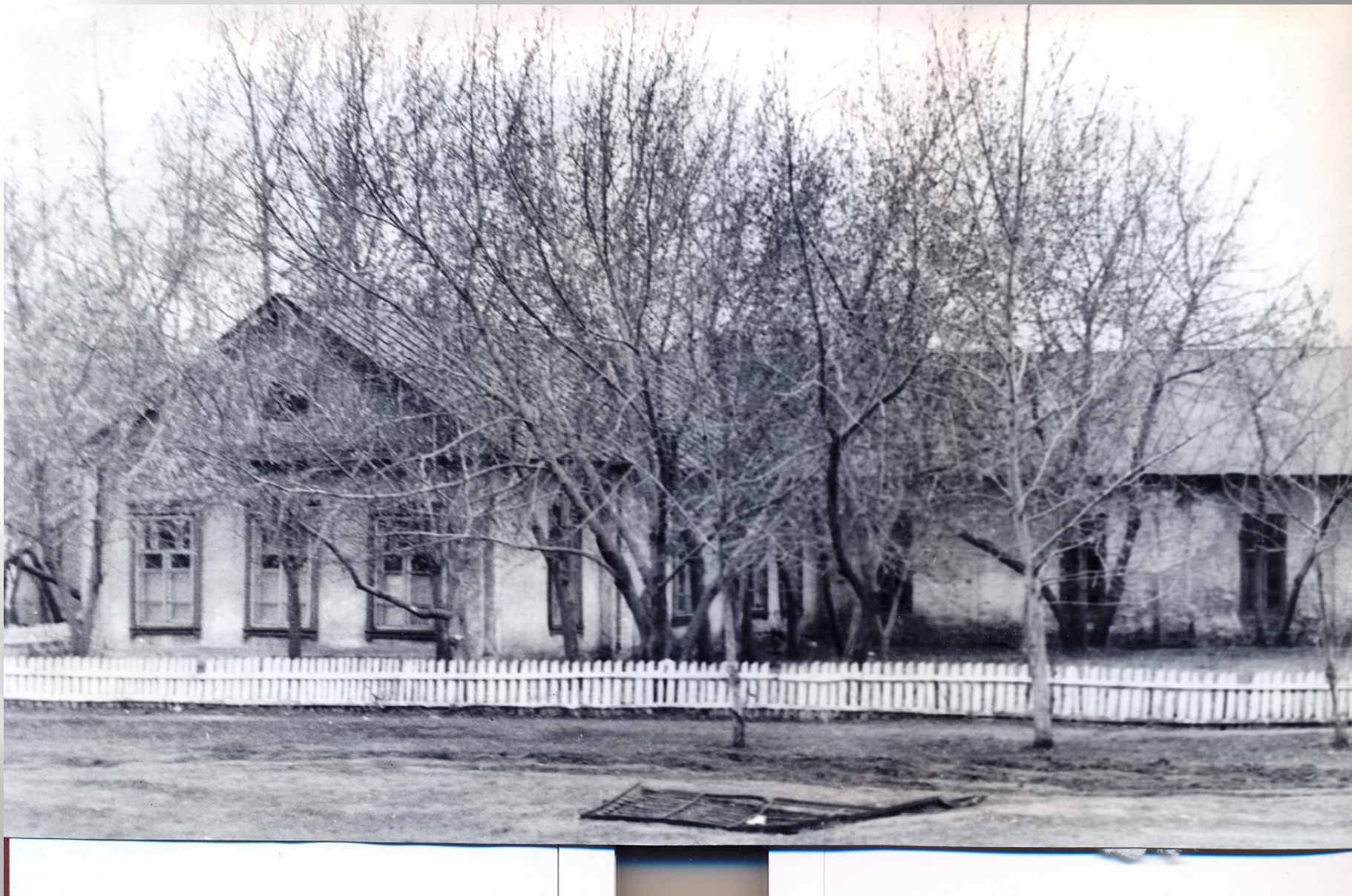
Здание старой школы