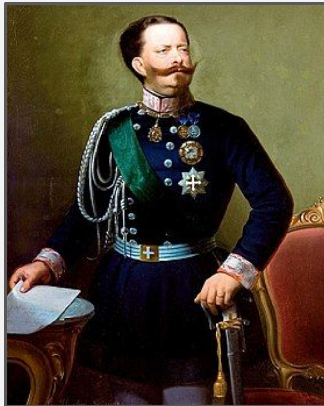
Сардин Виктор Эммануил II

Неожиданно заключенное в Виллафранке перемирие между императором Франции и Австрией, по которому Венеция оставалась в составе Австрии, ускорило отставку Кавура. Но в результате войны почти вся Северная Италия оказалась под властью короля Пьемонта и Сардинии Виктора Эммануила II.