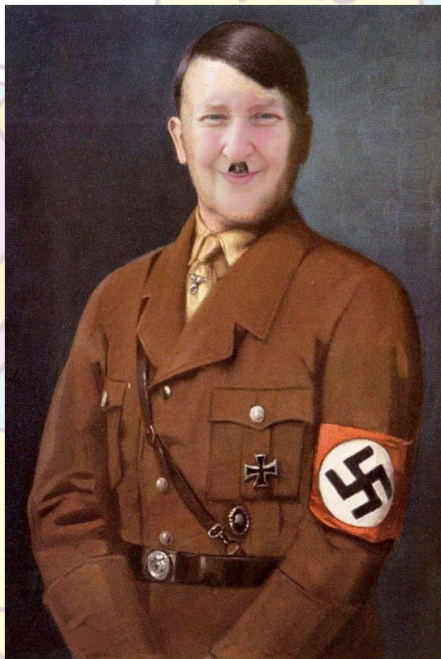
Лидер нацисткой партии Германии