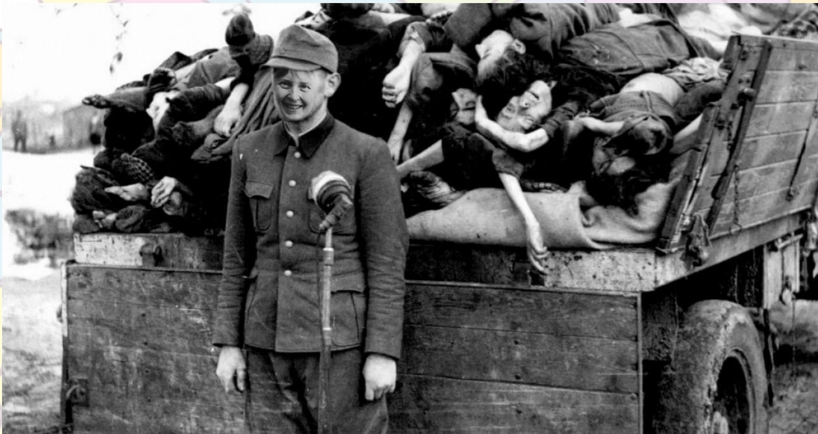
Вывоз трупов из немецкого концлагеря “Майданек” на сжигание