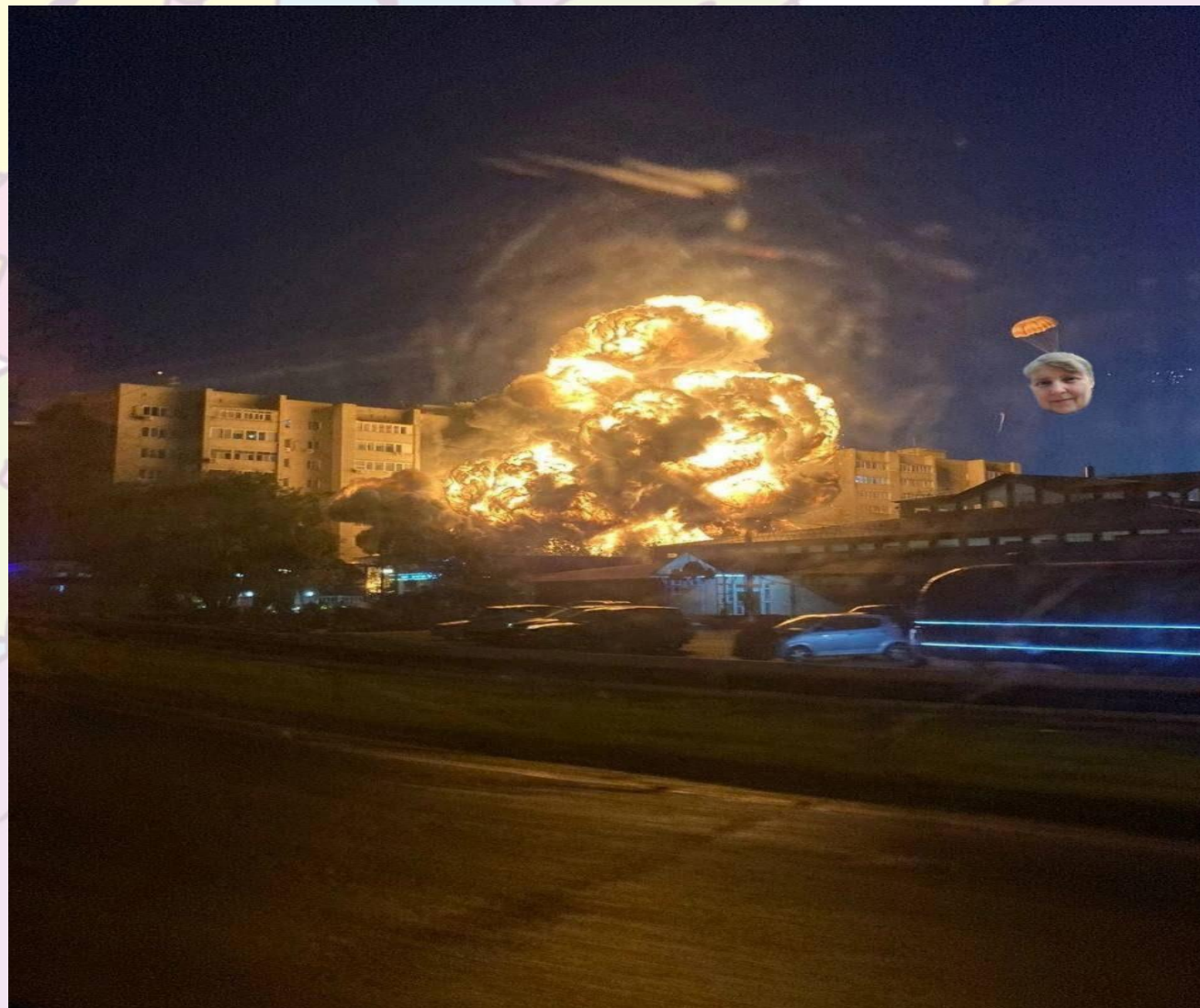
Крушение боевого самолета Су-34 на жилой дом в Ейске и его катапультировавшийся пилот