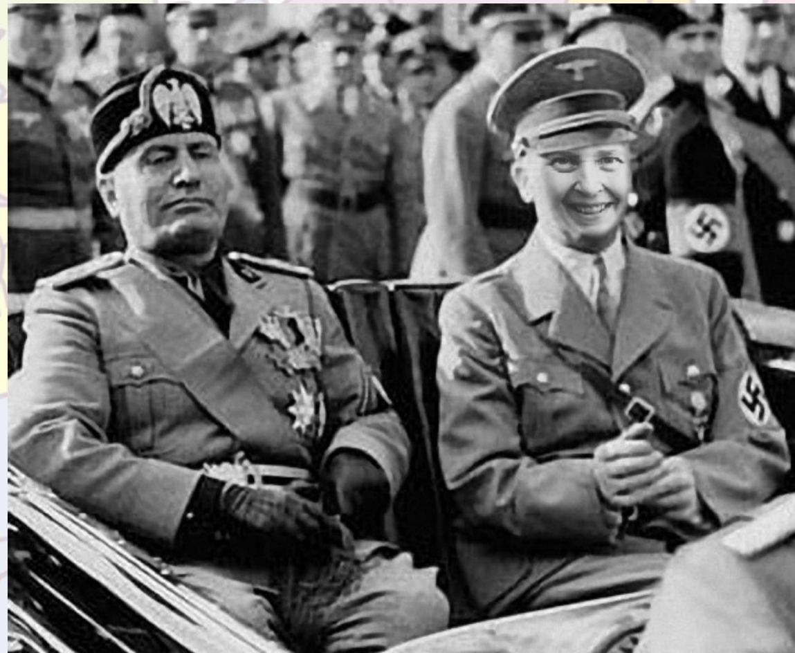
Встреча лидеров радикальных партий Италии и Германии, ответственных за геноцид народов Европы в 1939-1945 года