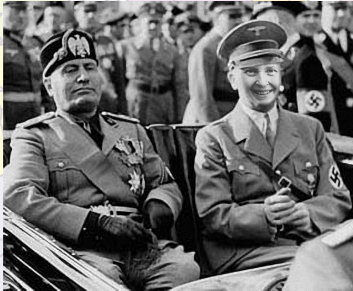
Встреча лидеров радикальных партий Италии и Германии, ответственных за геноцид народов Европы в 1939-1945 года