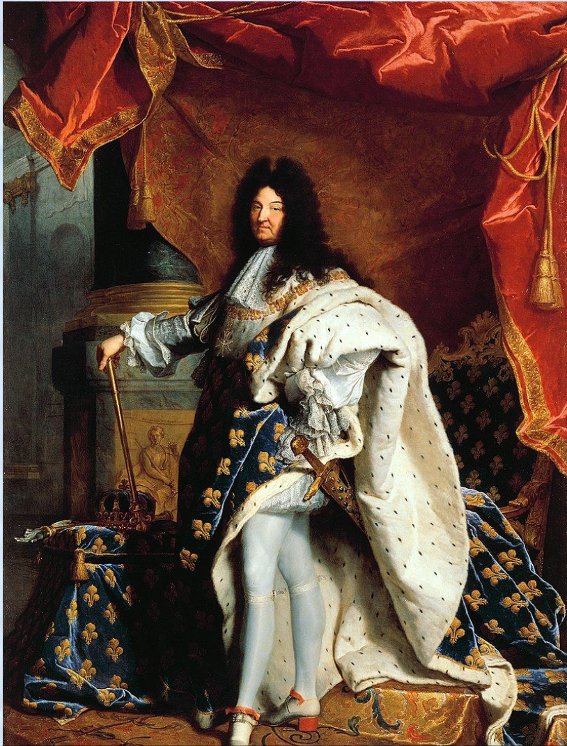
Людовик XIV (1643 – 1715)

В правление Людовика XIV Франция достигла пика своего могущества, но заплатила за политику короля немалую цену. Франция лишилась части населения: давление на протестантов заставило их тысячами бежать за границу. Деревню истощили постоянные налоги на ведение далеко не всегда успешных кровопролитных войн. Франция потеряла значительную часть колоний, настроила против себя многие европейские страны.