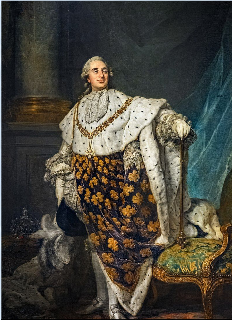
Людовик XVI (1774 – 1791)

Людовик XVI , не желая конфликтов, отменил парламентскую реформу.