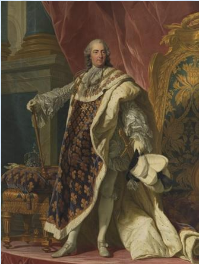
Людовик XV (1715 – 1774)

Людовику XV поначалу удалось выправить ситуацию: налоги были снижены, производство росло. Однако затем неудачная внешняя политика, роскошь и распутство королевского двора, всевластие фавориток короля и неизбежные попытки реформ, задевавших интересы дворянства, привели к тому, что правительство столкнулось с жёстким противодействием парламентов. Монархия нуждалась в деньгах, но парламенты отвергли в 1749 г. налоговую реформу,