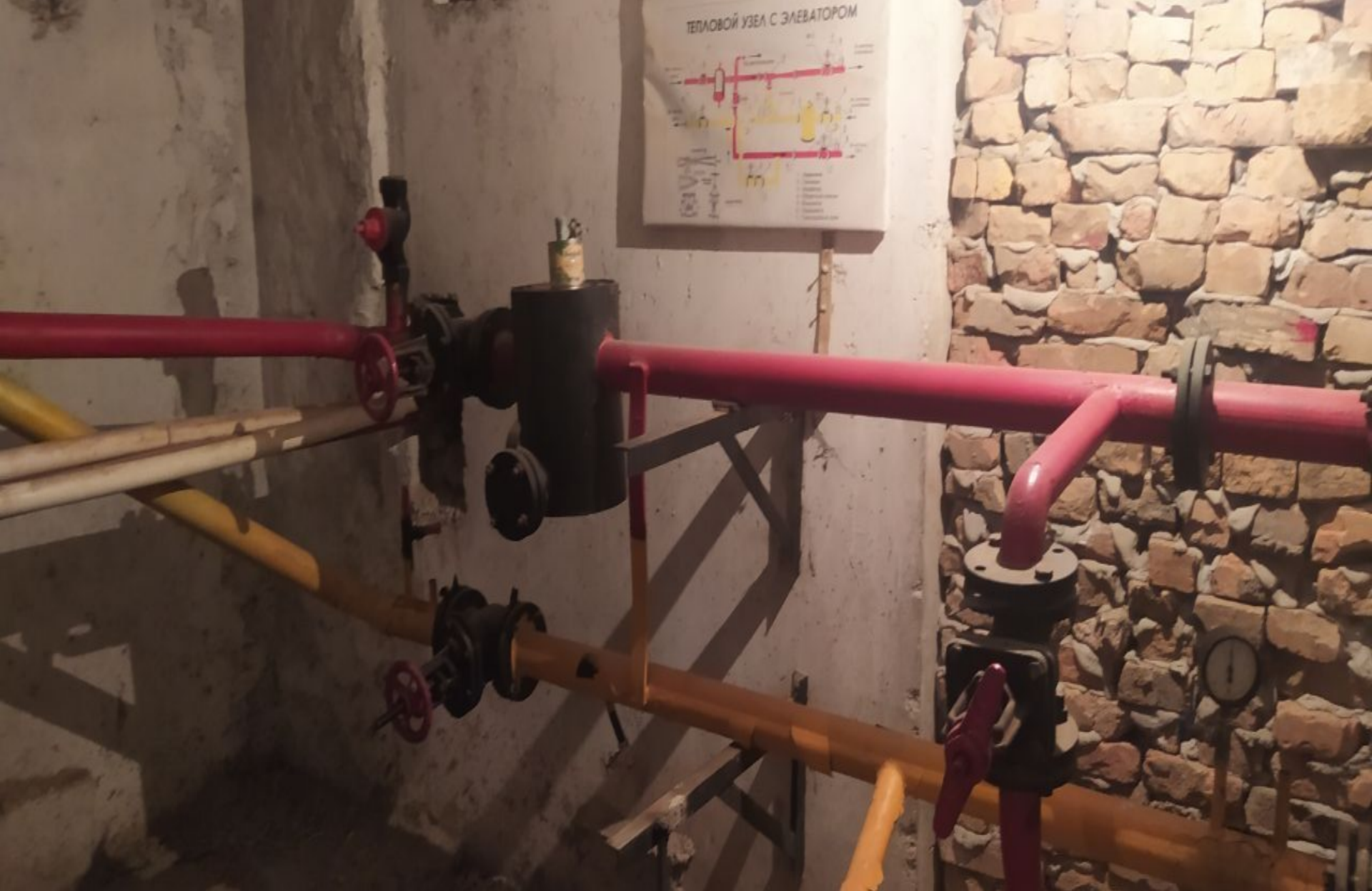
Яшинобод тумани Истиқлол маҳалласи Риёзий мавзе 2а-уй ер тўласи муаммо мавжуд эмас (2-сектор). (Бориб ўрганилган вақти 17.10.2022 йил соат (10:10)