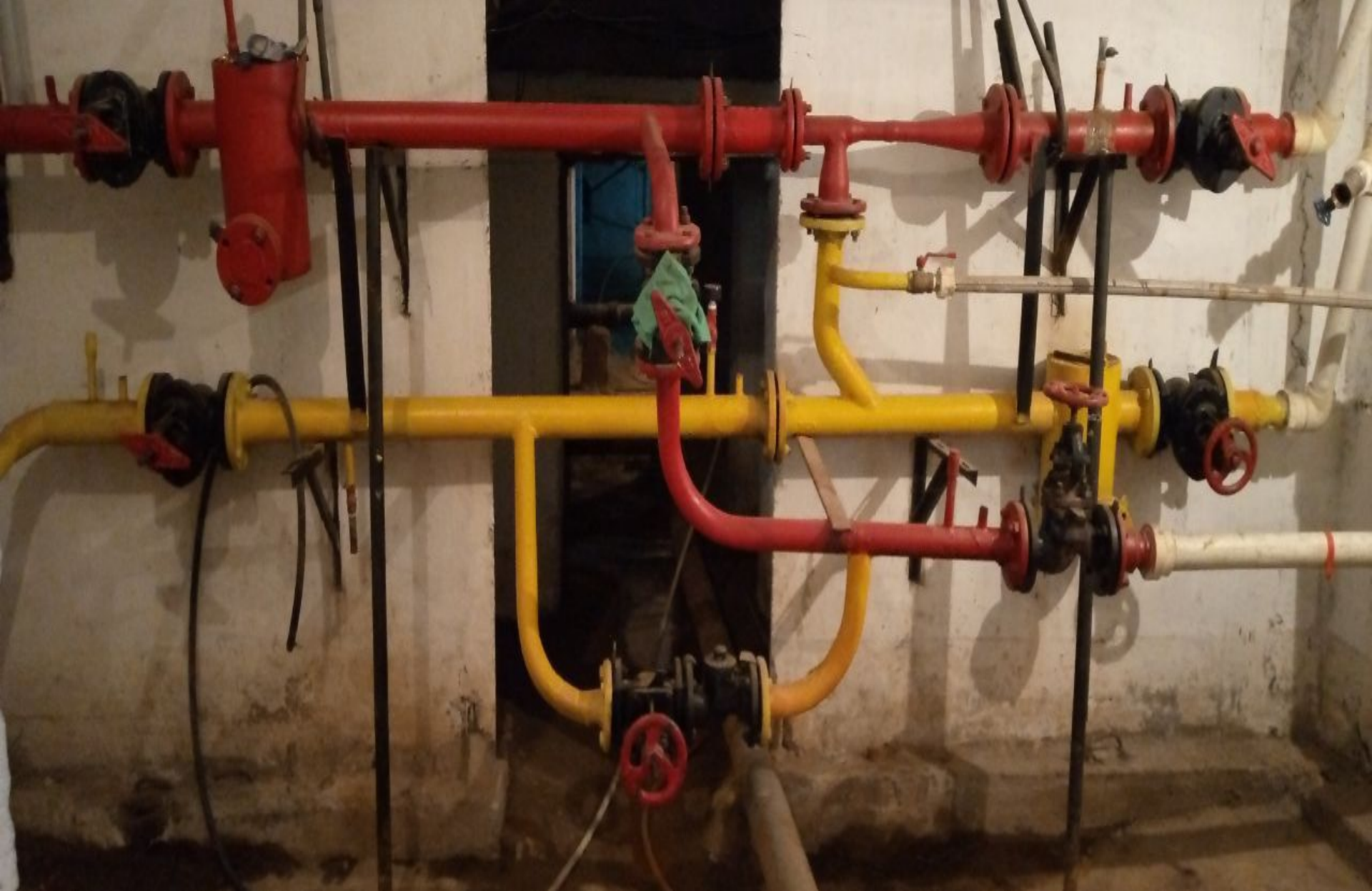
Яшинобод тумани Семурғ маҳалласи 21-уй муаммо мавжуд эмас. (2-сектор). (Бориб ўрганилган вақти 17.10.2022 йил соат (12:40))