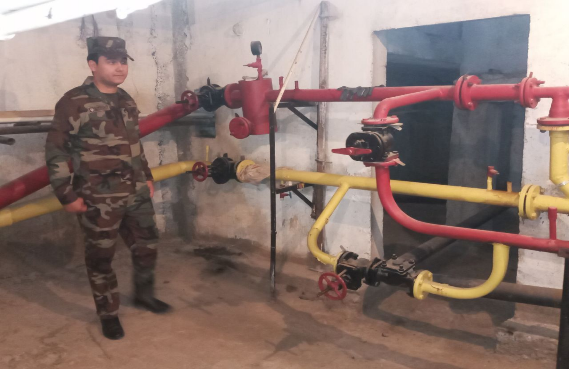
Яшинобод тумани Семурғ маҳалласи М.Риёзий кўчаси 20-уй муаммо мавжуд эмас (2-сектор). (Бориб ўрганилган вақти 17.10.2022 йил соат (9:40)