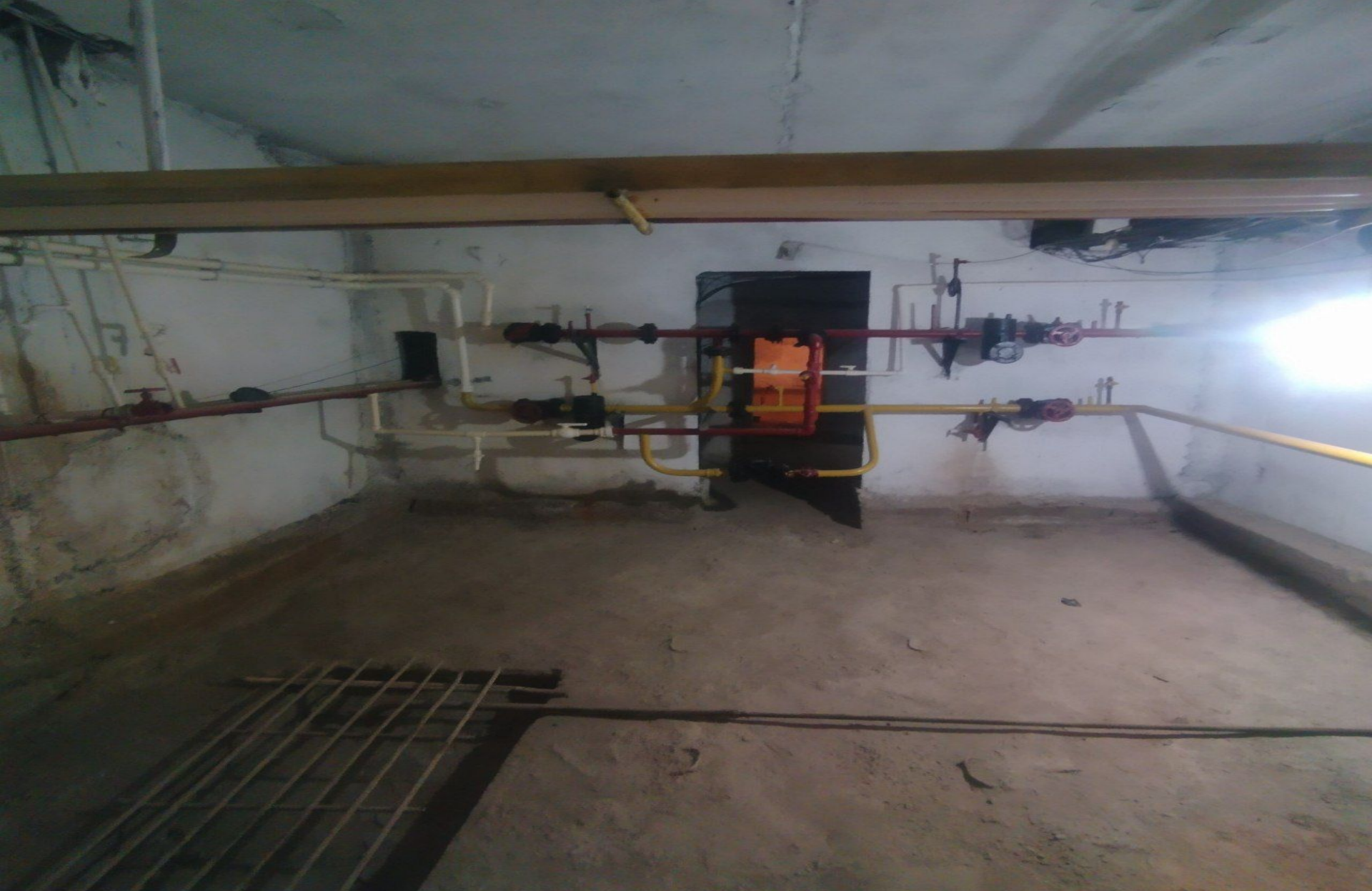
Яшинобод тумани Истиқлол маҳалласи М Риёзий кўчаси 3-уй куз-қиш мавсумига тайёр (2-сектор). (Бориб ўрганилган вақти 17.10.2022 йил соат (12:10))