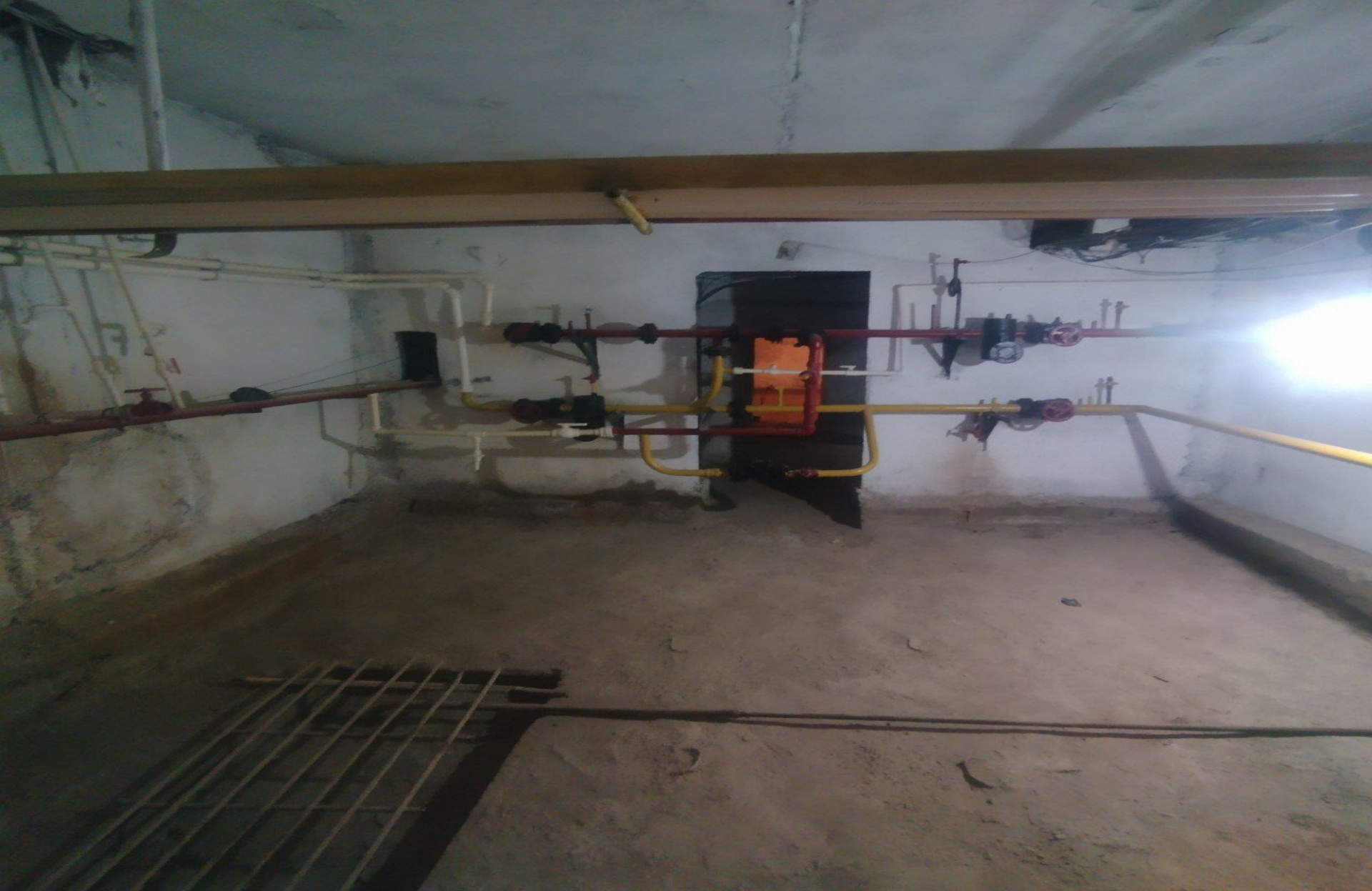
Яшинобод тумани Истиклол маҳалласи М.Риёзий кўчаси 2-уй муаммо мавжуд эмас (2-сектор). (Бориб ўрганилган вақти 17.10.2022 йил соат (12:00))