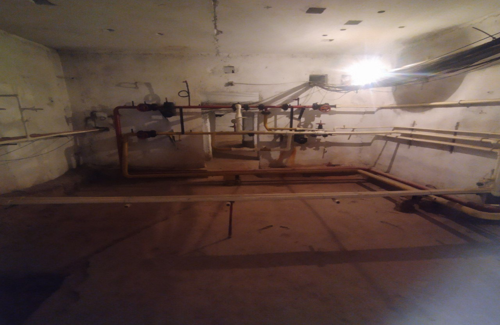
Яшинобод тумани Истиқлол маҳалласи М.Риёзий мавзеси 5-уй муаммо мавжуд эмас. (2-сектор). (Бориб ўрганилган вақти 17.10.2022 йил соат (11:40))