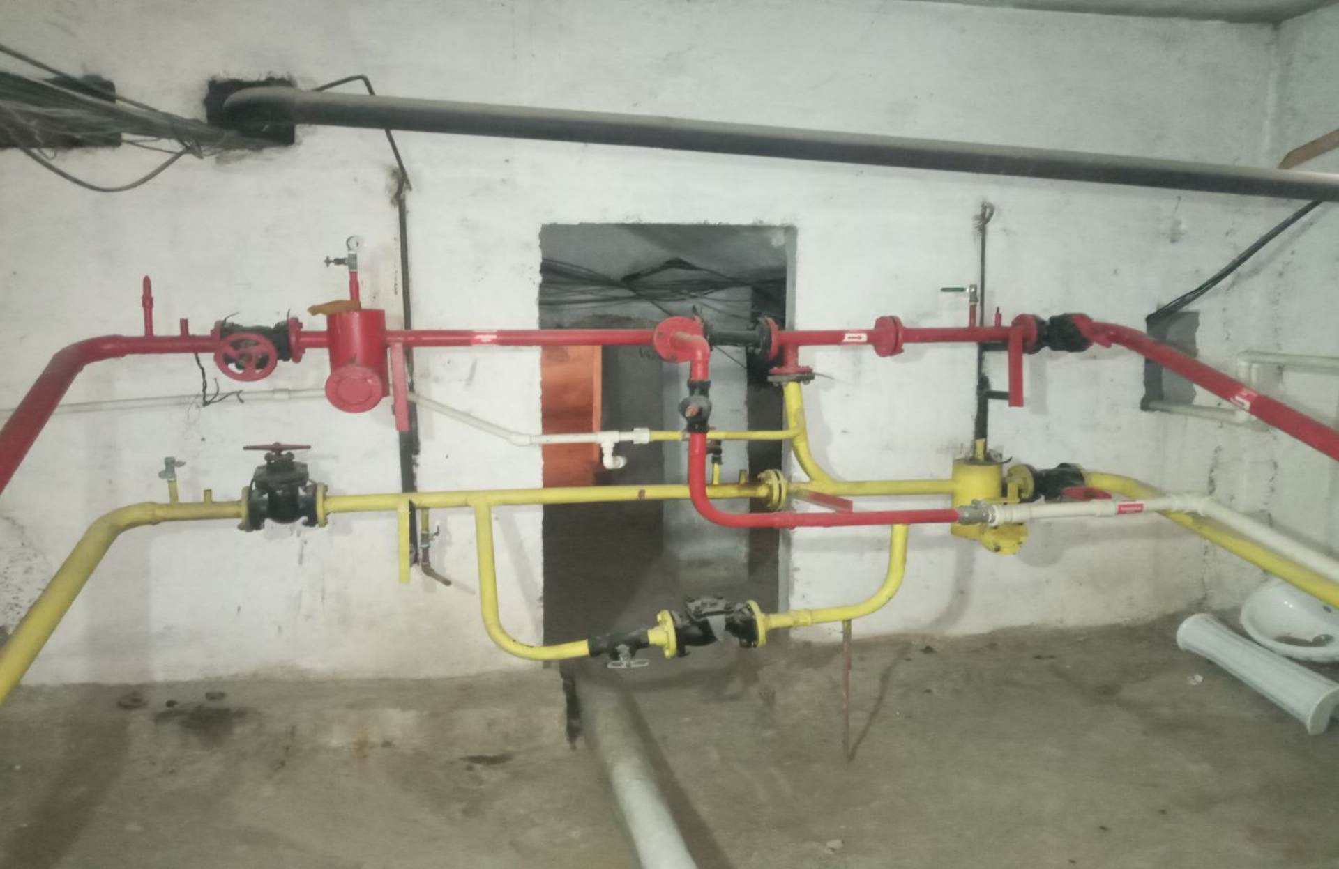
Яшинобод тумани Семурғ махалласи М.Риёзий кўчаси 24-уй ер тўласи муаммо мавжуд эмас. (2-сектор). (Бориб ўрганилган вақти 17.10.2022 йил соат (12:20))