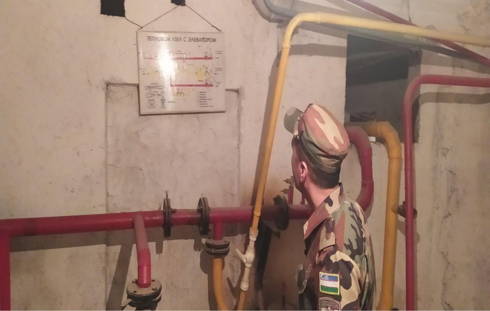
Яшинобод тумани Истиклол маҳалласи Паркент “Призавой” мавзе 1а-уй куз-қиш мавсумига тайёр (2-сектор). (Бориб ўрганилган вақти 17.10.2022 йил соат (9:35))