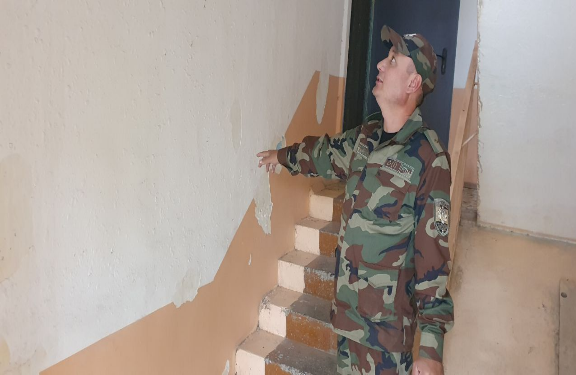
Яшинобод тумани Машинасозлар маҳалласи 6-уй кириш йўлаги таъмир талаб. (2-сектор). (Бориб ўрганилган вақти 17.10.2022 йил соат (15:00))