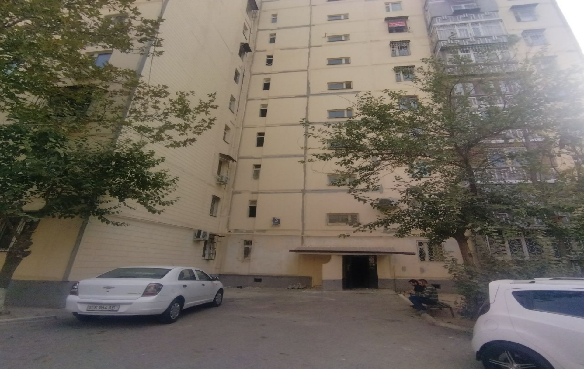
Яшнобод тумани Истиқлол маҳалласи 3а-уй муаммо мавжуд эмас. (2-сектор). (Бориб ўрганилган вақти 17.10.2022 йил соат (11:35))