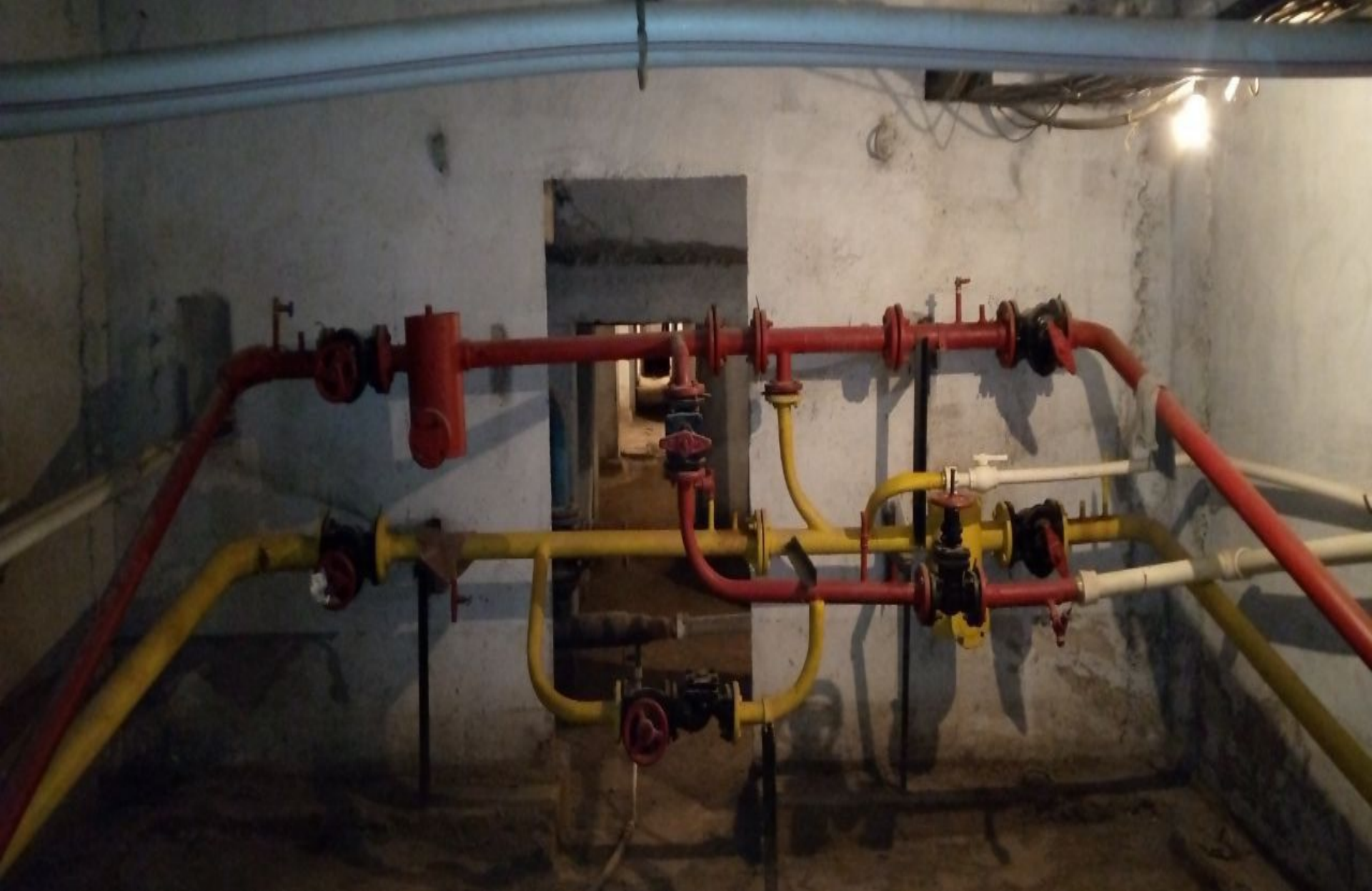
Яшинобод тумани Семурғ маҳалласи 22-уй муаммо мавжуд эмас. (2-сектор). (Бориб ўрганилган вақти 17.10.2022 йил соат (13:00))