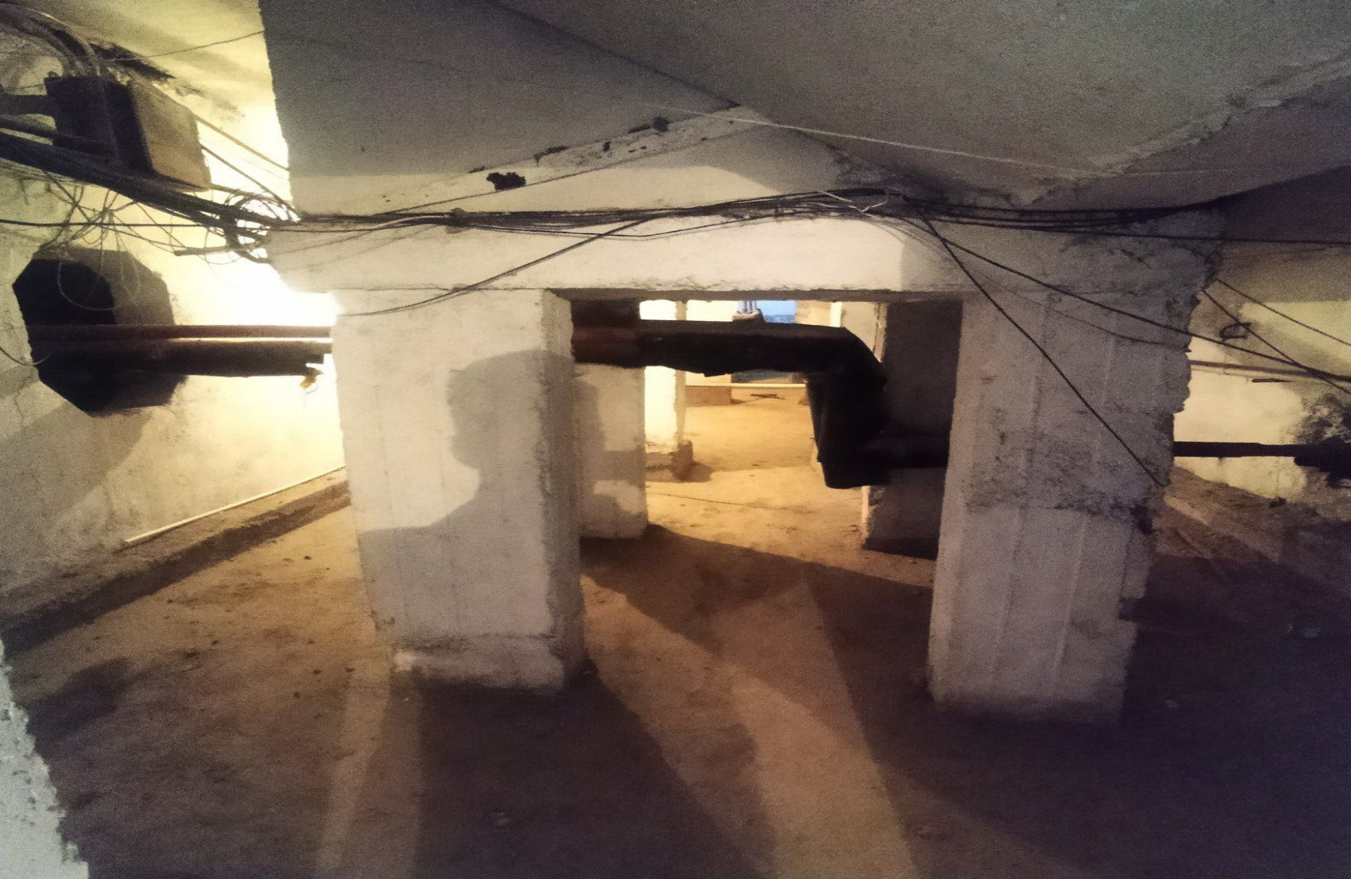
Яшинобод тумани Истиқлол маҳалласи М.Риёзий мавзеси 13-уй муаммо мавжуд эмас (2-сектор). (Бориб ўрганилган вақти 17.10.2022 йил соат (12:00))