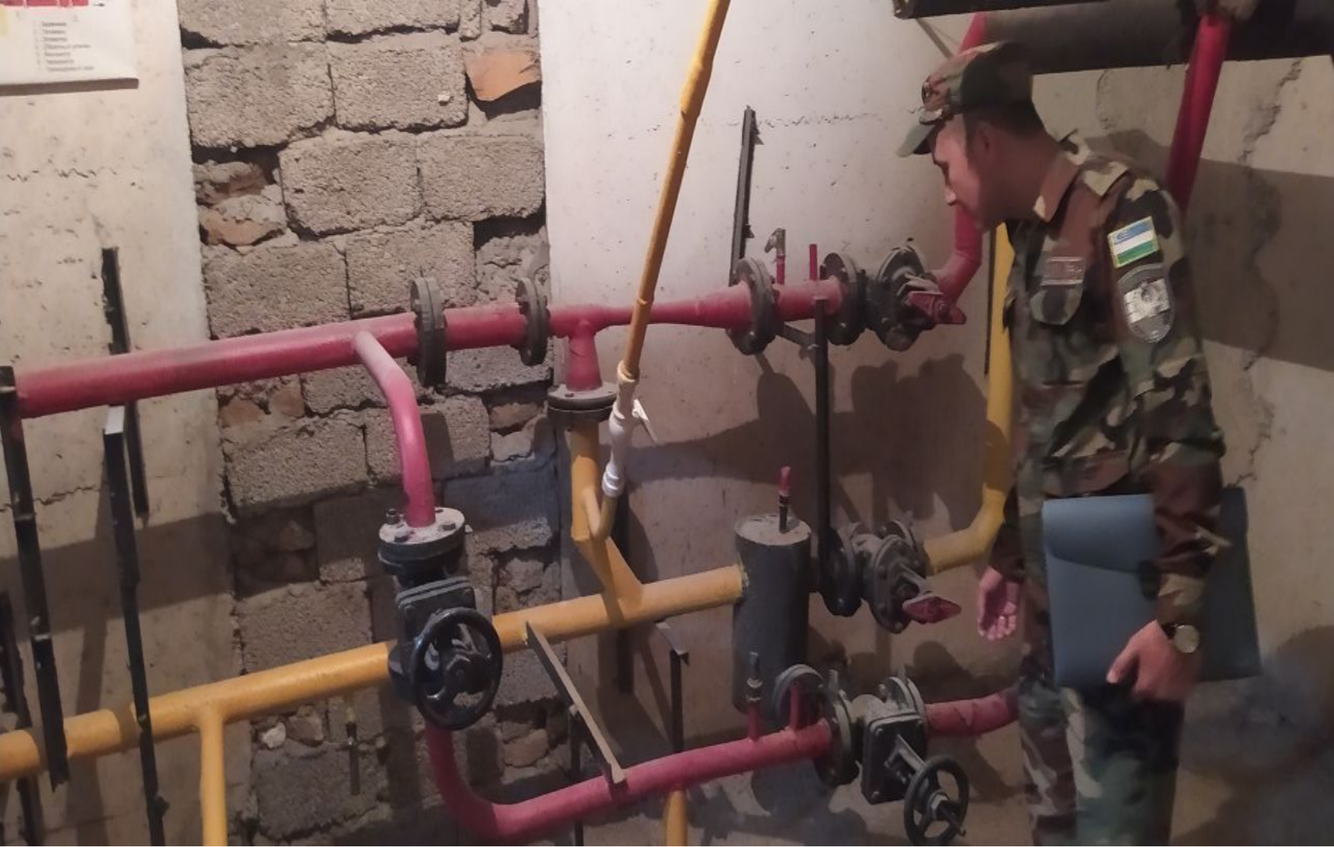
Яшинобод тумани Истиклол маҳалласи Паркент “Призавой” мавзе 6/7-уй куз-қиш мавсумига тайёр (2-сектор). (Бориб ўрганилган вақти 17.10.2022 йил соат (9:35)