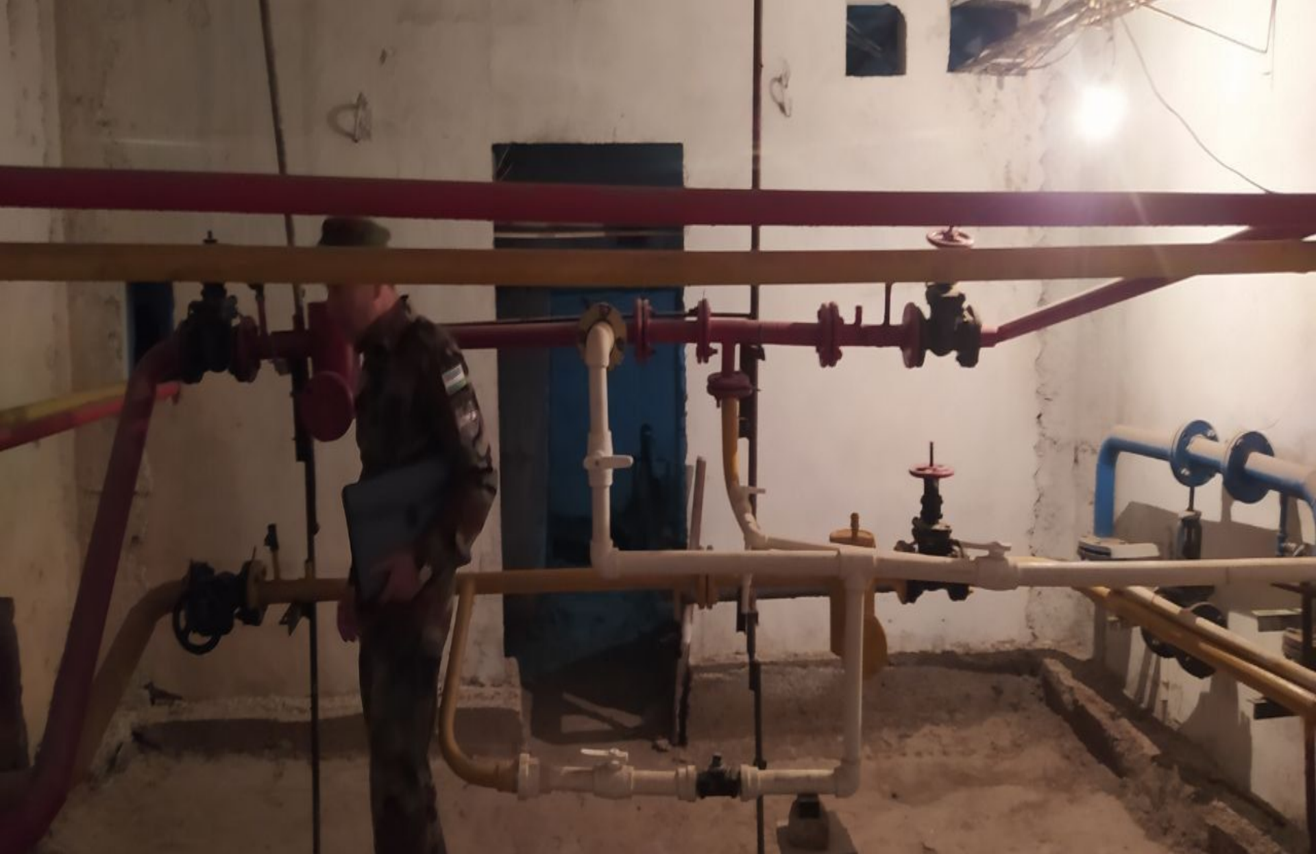
Яшинобод тумани Истиқлол маҳалласи М.Риёзий мавзеси 10-уй муаммо мавжуд эмас. (2-сектор). (Бориб ўрганилган вақти 17.10.2022 йил соат (11:30))