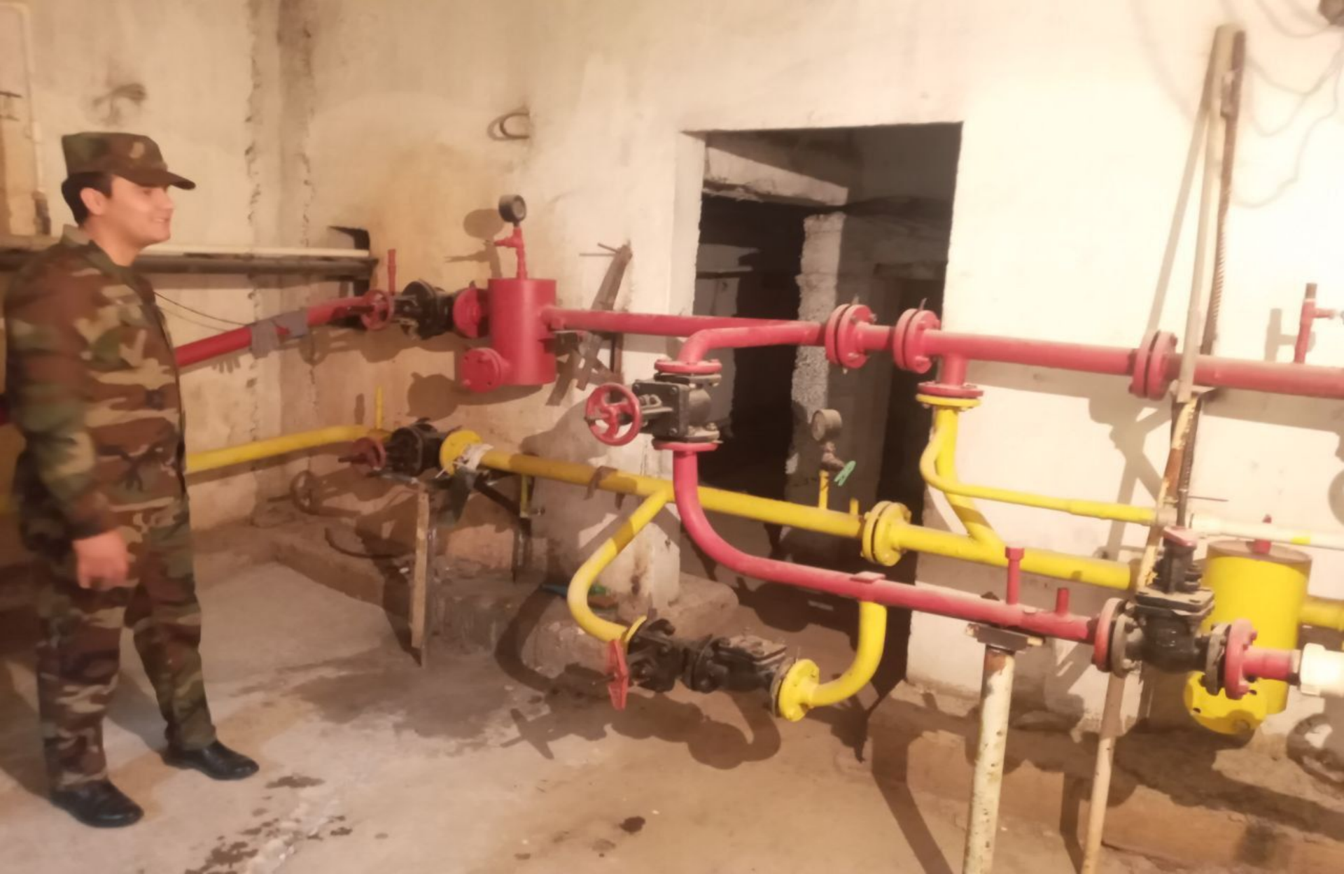
Яшинобод тумани Семурғ маҳалласи М.Риёзий кўчаси 19-уй муаммо мавжуд эмас (2-сектор). (Бориб ўрганилган вақти 17.10.2022 йил соат (9:50))