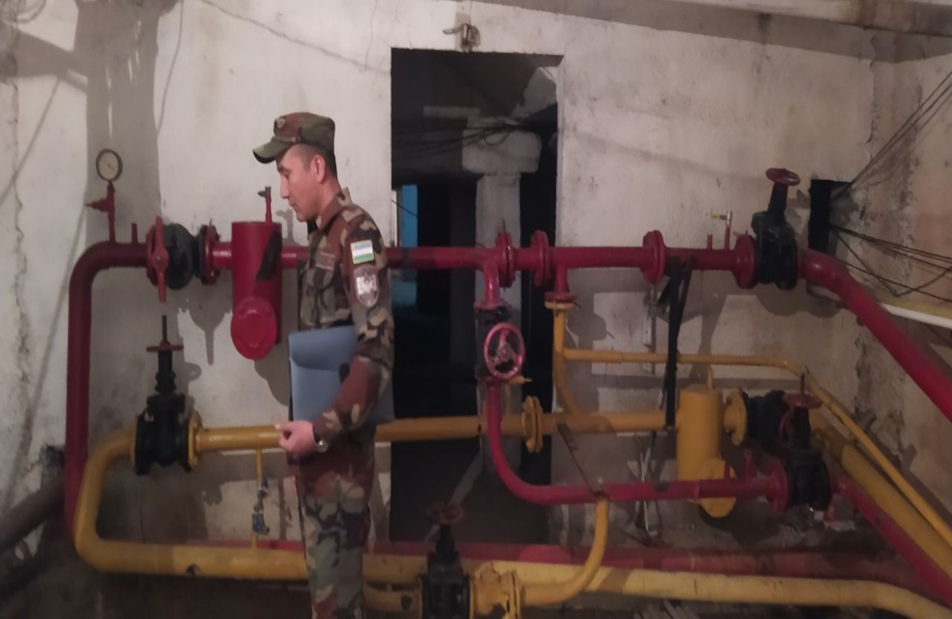
Яшинобод тумани Истиклол маҳалласи М Риёзий кўчаси 6-уй муаммо мавжуд эмас (2-сектор). (Бориб ўрганилган вақти 17.10.2022 йил соат (12:20))