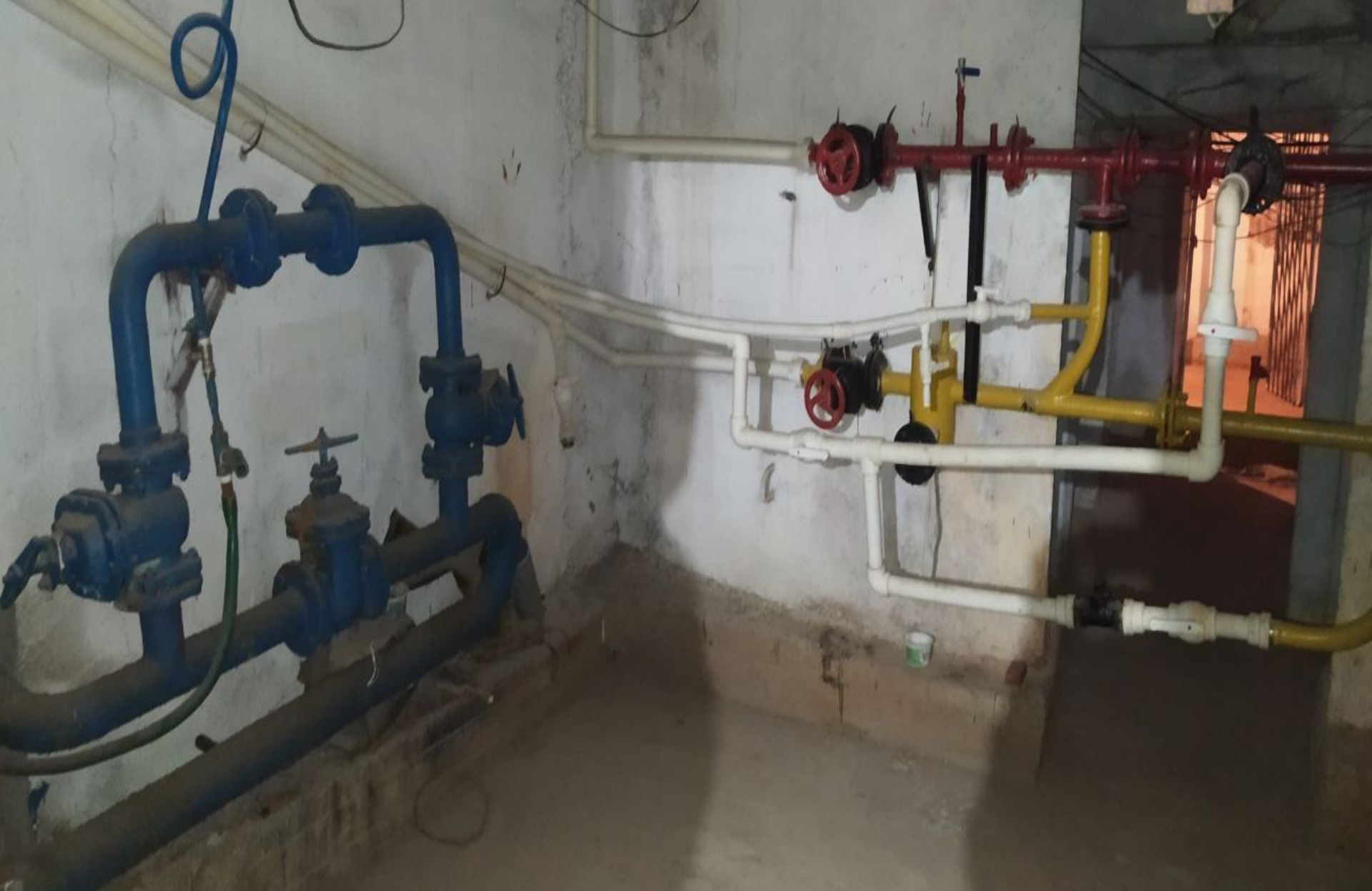
Яшинобод тумани Истиклол маҳалласи М Риёзий кўчаси 11-уй муаммо мавжуд эмас. (2-сектор). (Бориб ўрганилган вақти 17.10.2022 йил соат (12:30))