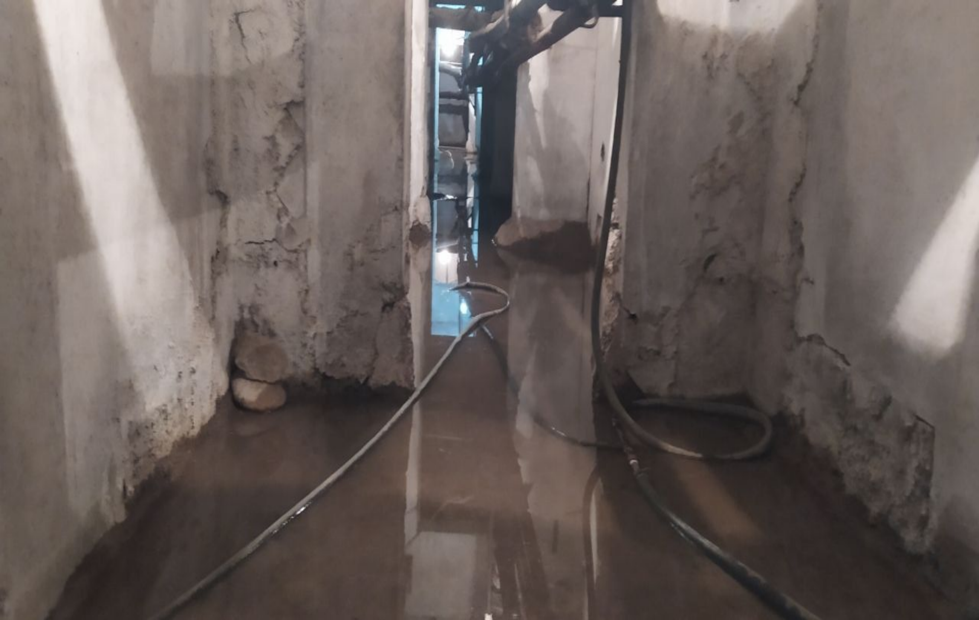
Яшинобод тумани Истиқлол маҳалласи Паркент “Призавой” мавзе 4/5-уй ер тўласи канализация турбалари таъмир талаб сув оқади (2-сектор). (Бориб ўрганилган вақти 17.10.2022 йил соат (9:35))