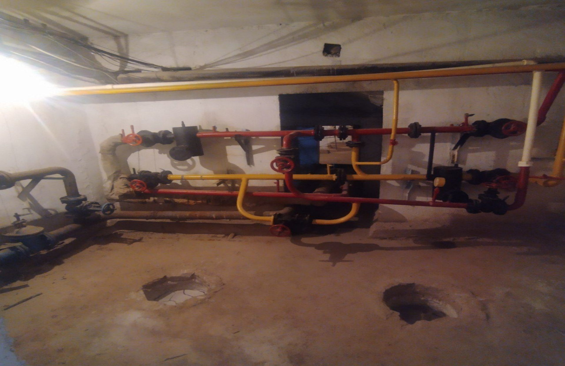
Яшинобод тумани Истиклол маҳалласи М Риёзий кўчаси 4-уй муаммо мавжуд эмас. (2-сектор). (Бориб ўрганилган вақти 17.10.2022 йил соат (12:35))