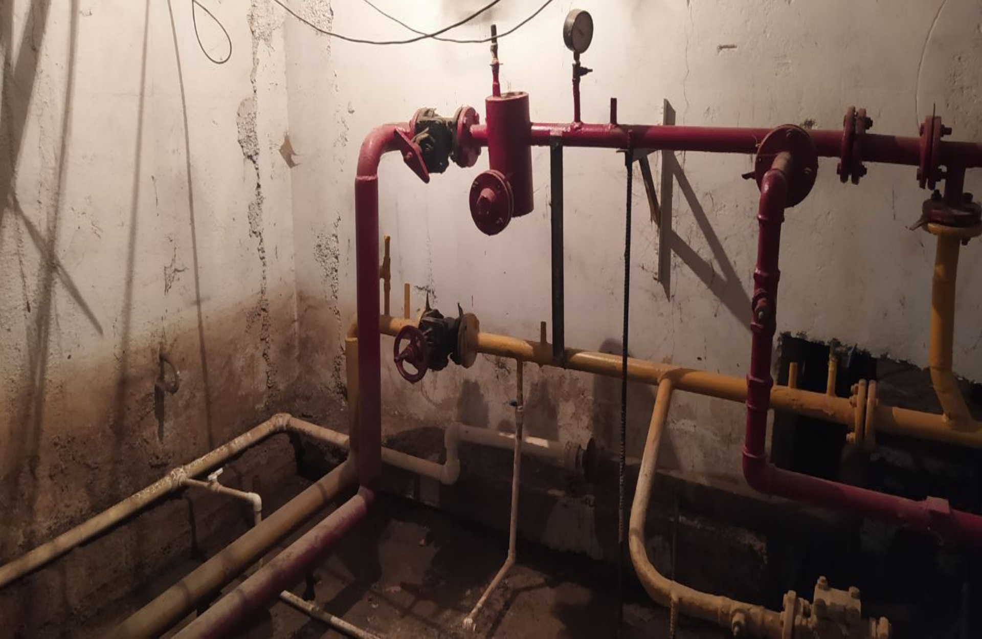
Яшинобод тумани Истиқлол махалласи М.Риёзий мавзеси 9-уй муаммо мавжуд эмас. (2-сектор). (Бориб ўрганилган вақти 17.10.2022 йил соат (11:50))