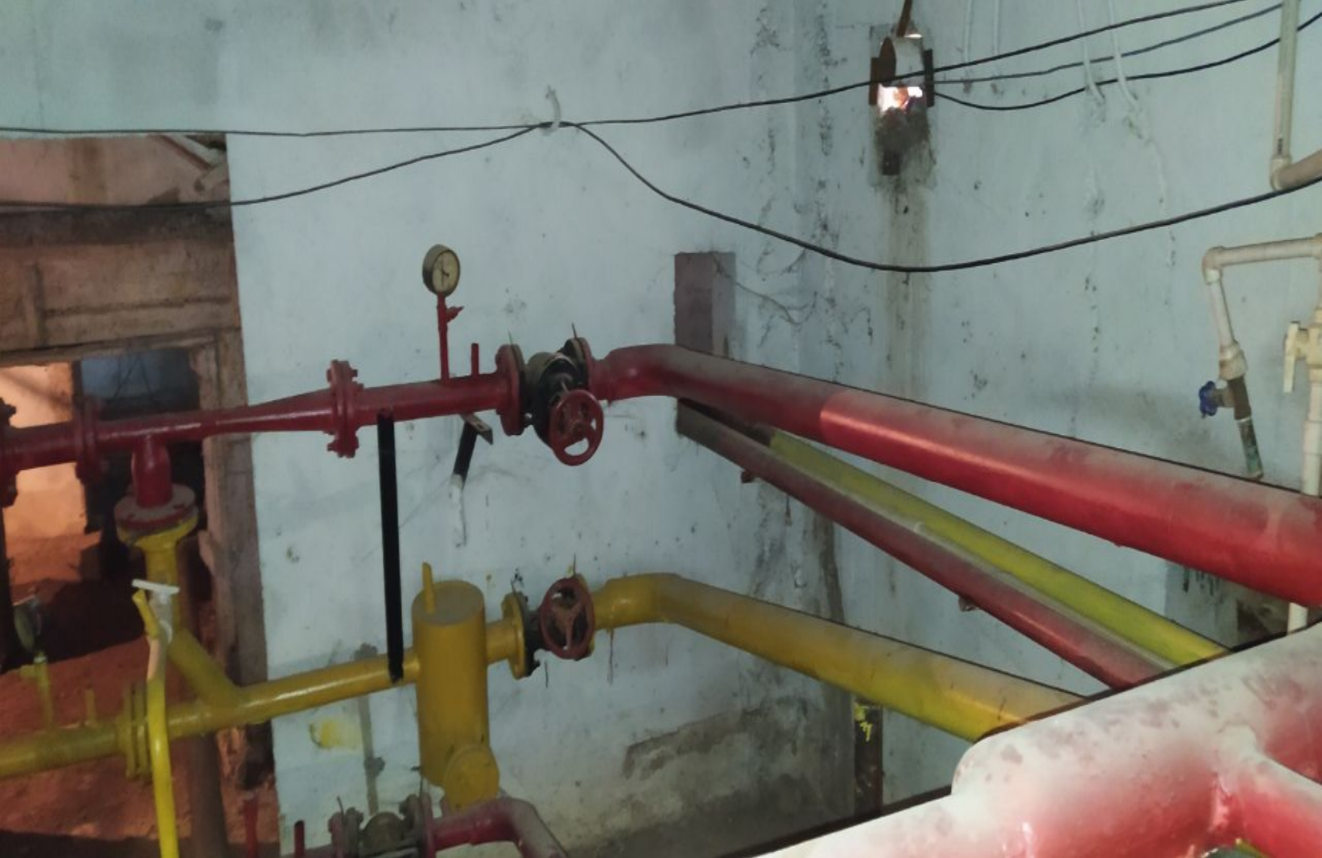
Яшинобод тумани Истиқлол маҳалласи М.Риёзий мавзеси 9-уй муаммо мавжуд эмас. (2-сектор). (Бориб ўрганилган вақти 17.10.2022 йил соат (11:50))