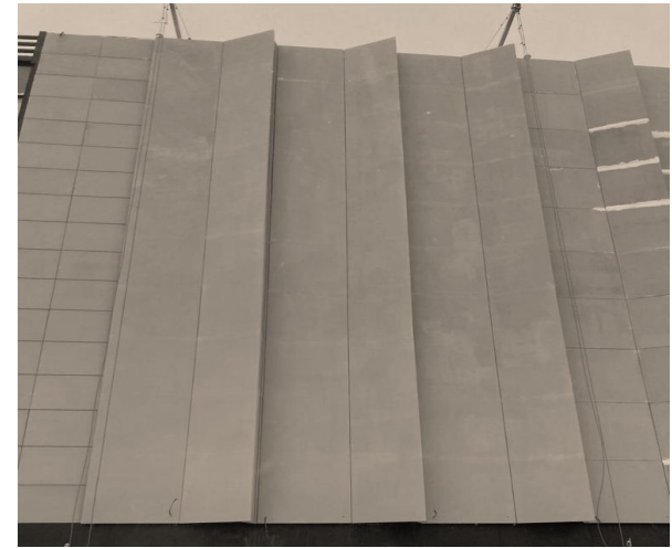
Фасадные панели из фибробетона

Физкультурно-оздоровительный комплекс с катком проспект Динамо, д. 44 г. Санкт-Петербург, Россия