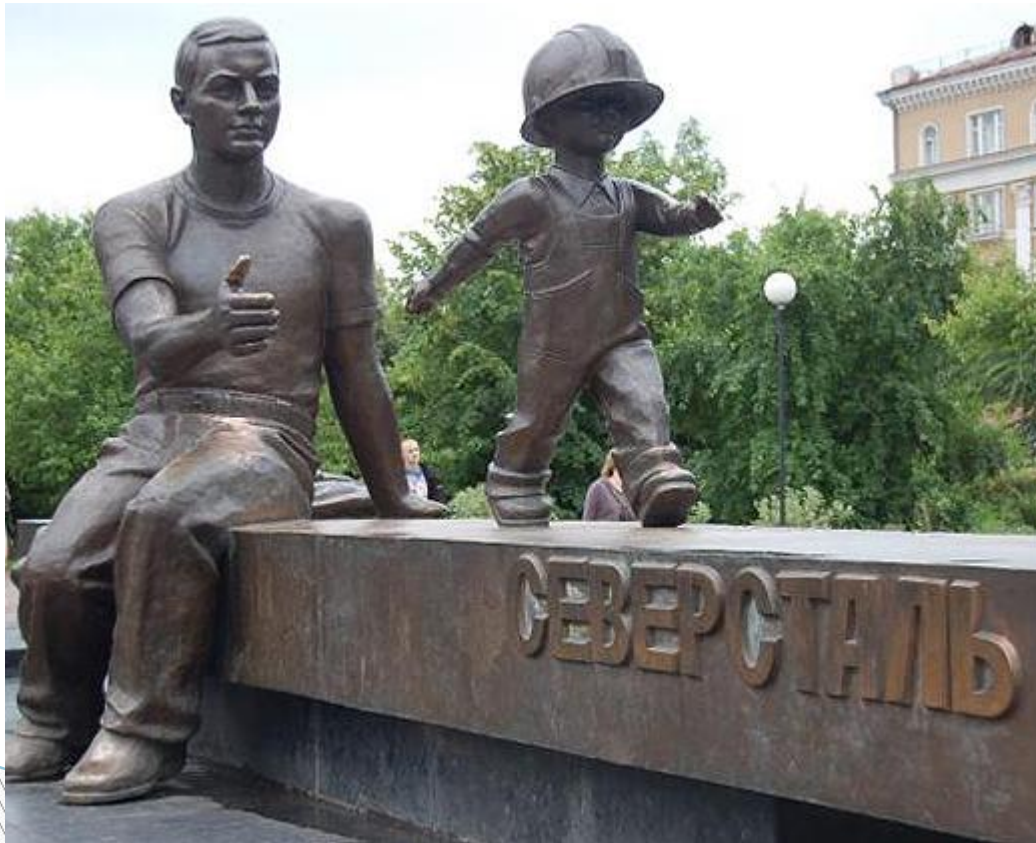
Памятник отцу, г. Стерлитамак