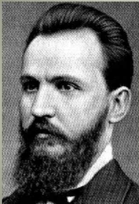
Петр Федорович Каптерев (1849–1922)