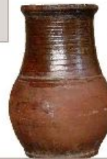
Крынка - для хранения и подачи молока на стол