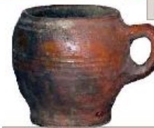
Канопка использовалась в качестве кружки