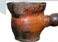
Горшок для топления масла