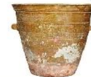
Опарница - для подготовки теста