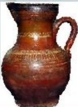
Кувшин – для подачи воды на стол