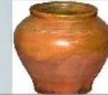
Горшок - для приготовления пищи