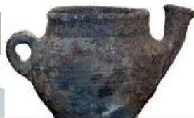
Рыльник - для топления масла