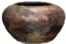
Корчага – для варки кваса, нагревания воды