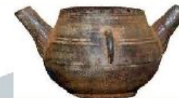
Умывальник - для умывания