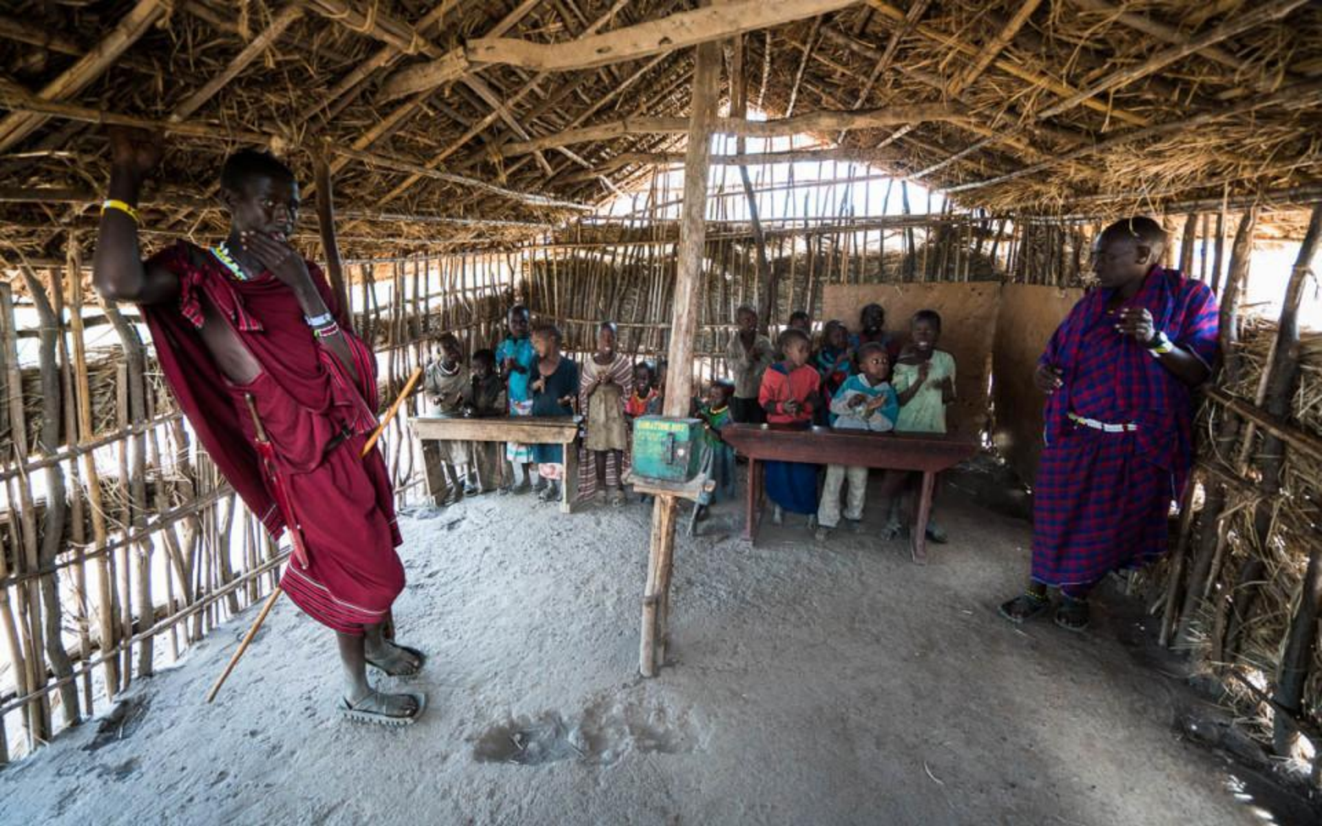
Начальная школа масаев в Танзании