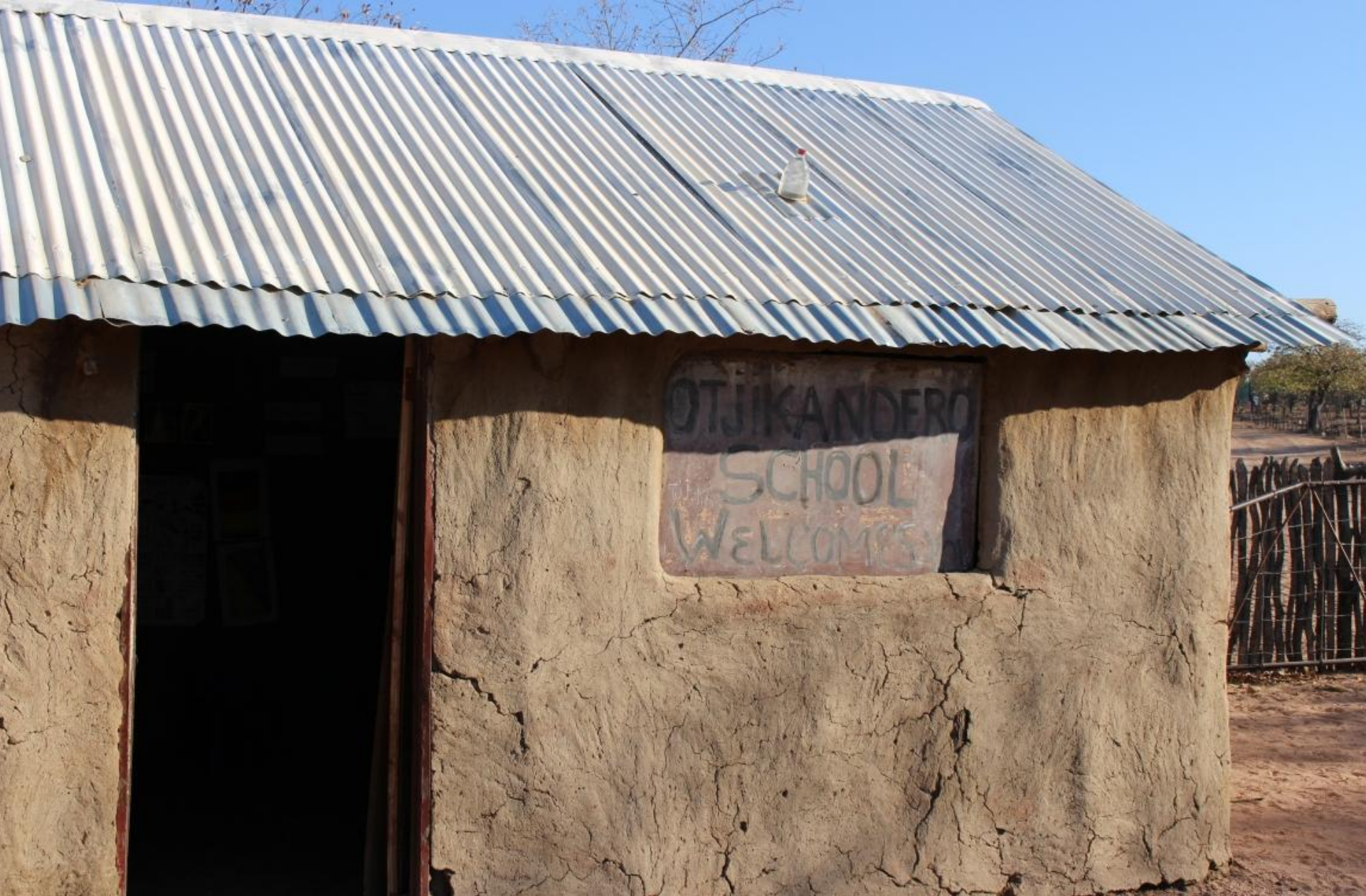
Здание начальной школы в Намибии