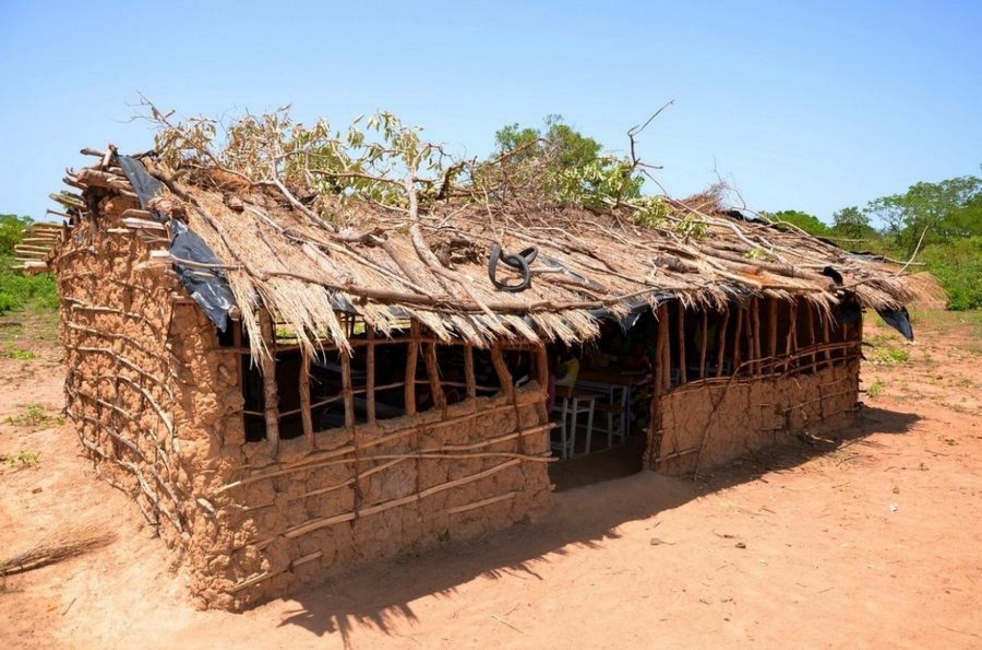
Здание начальной школы в Буркина-Фасо