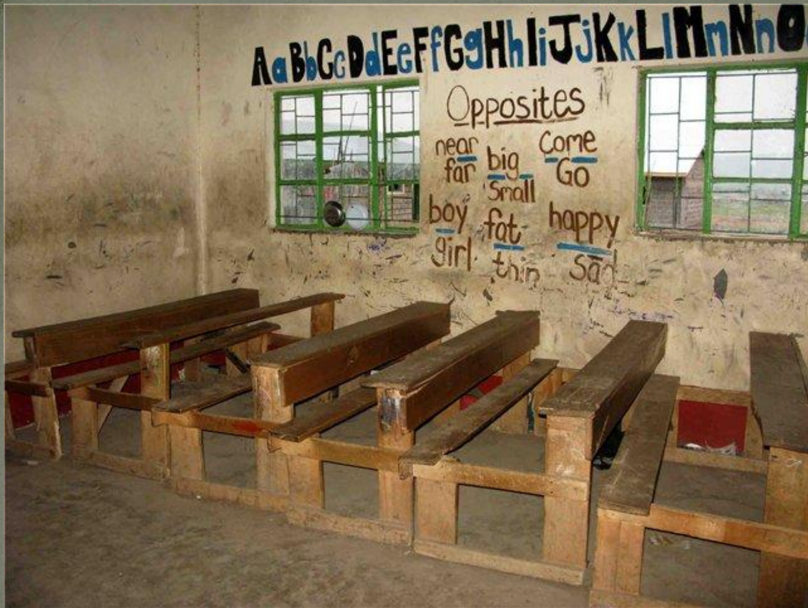
Английский алфавит на стенах класса кенийской школы