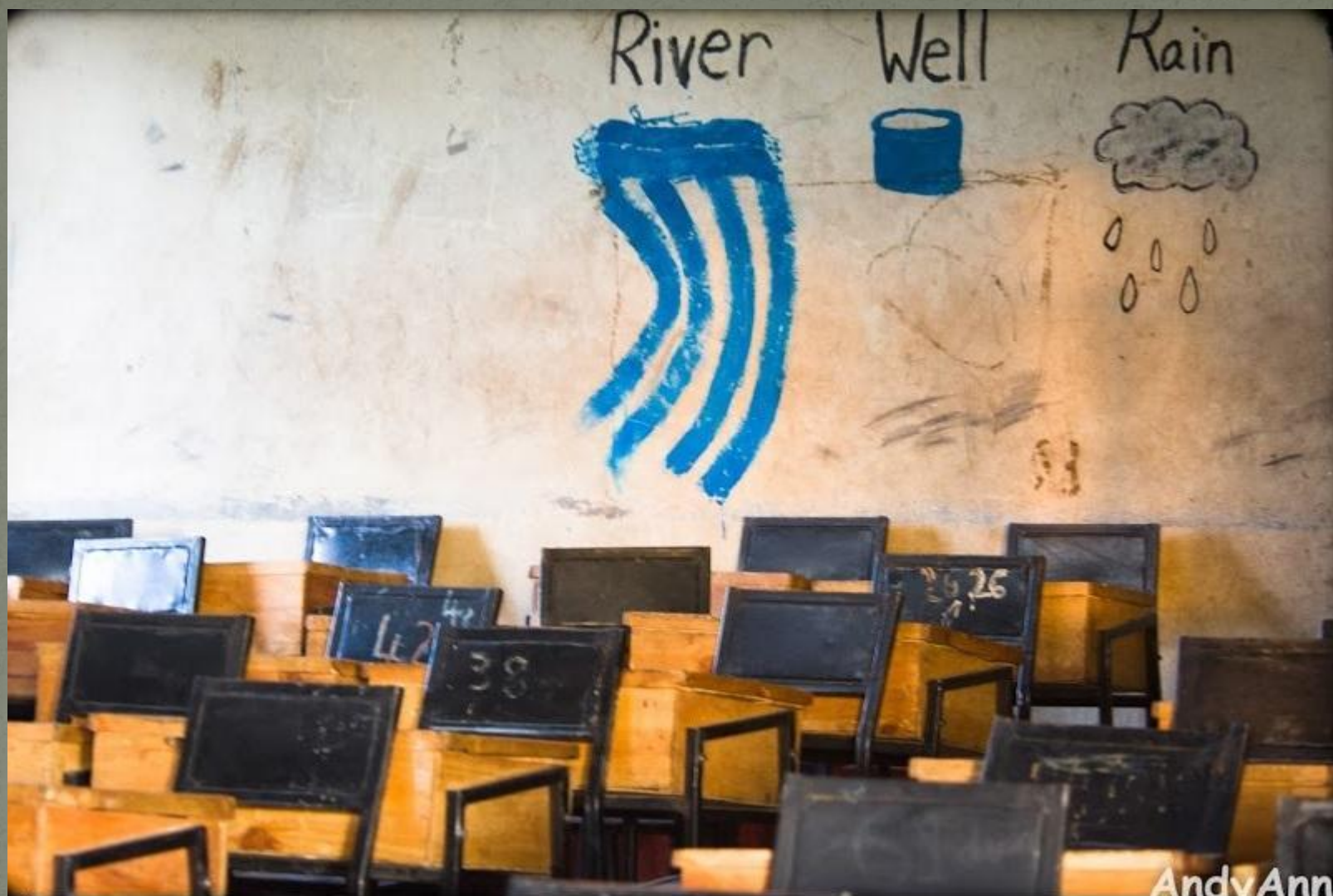
Настенные рисунки по географии в школе Танзании