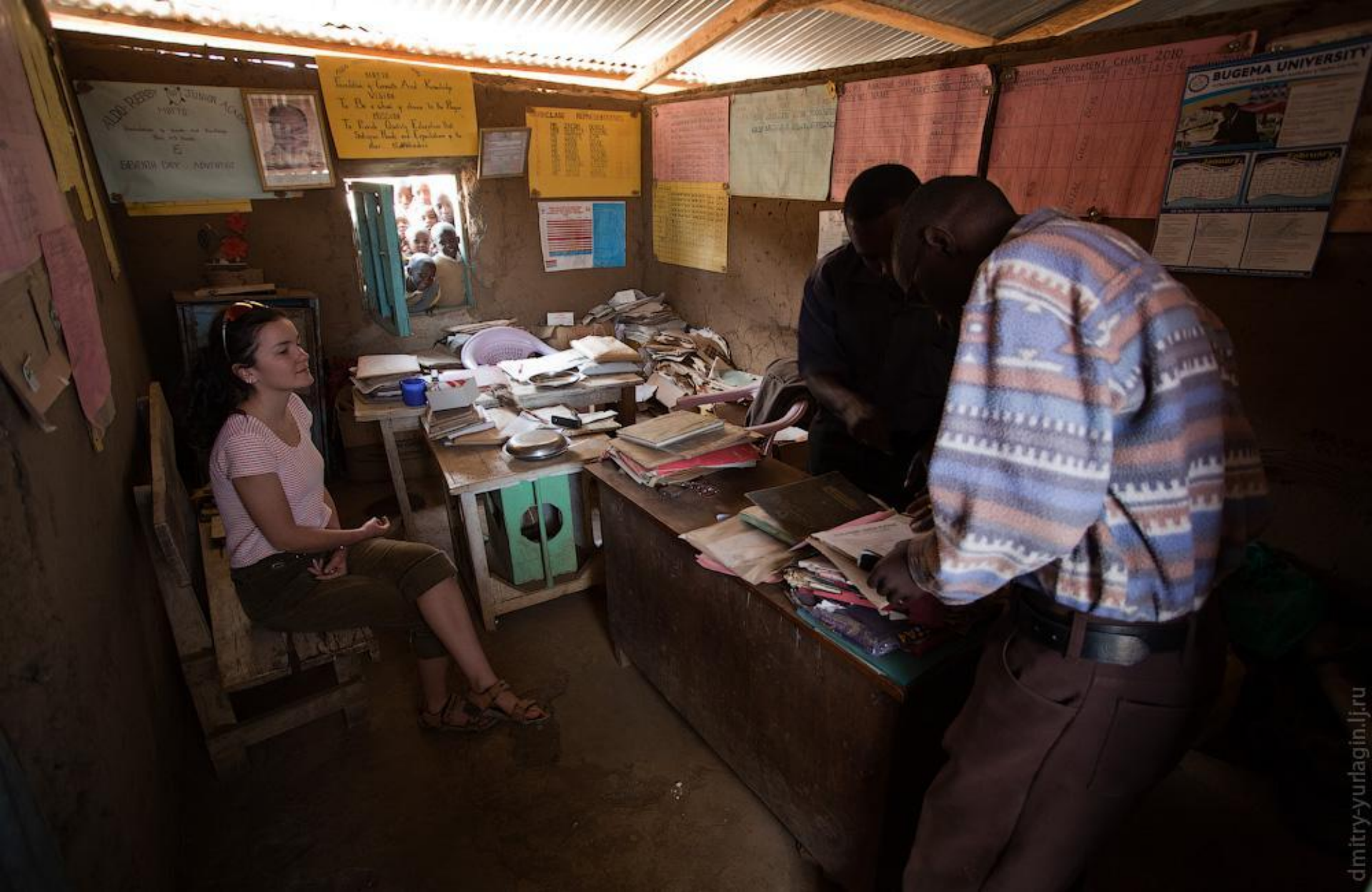
Школьная учительская в Кении