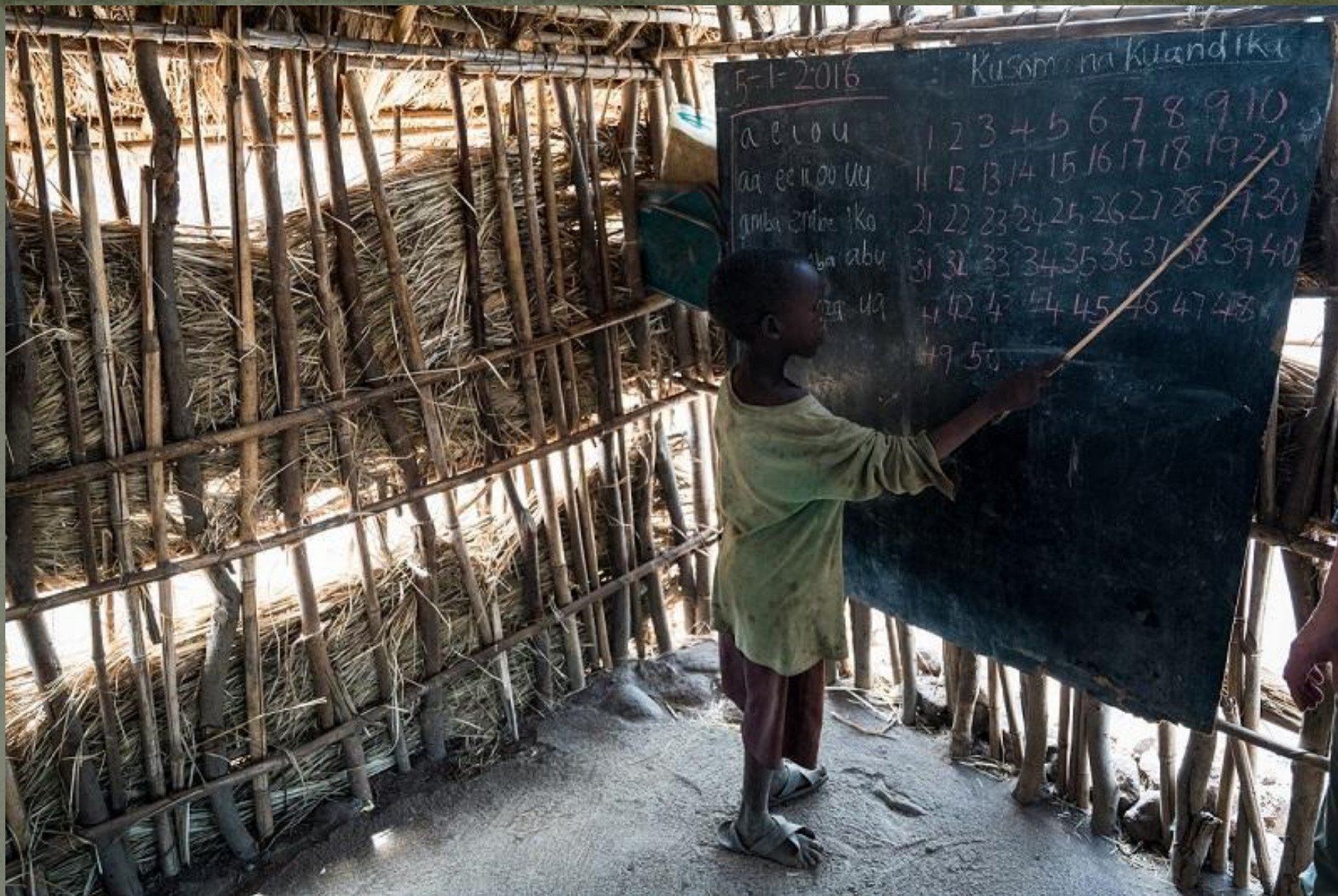
Урок математики в школе масаев в Танзании