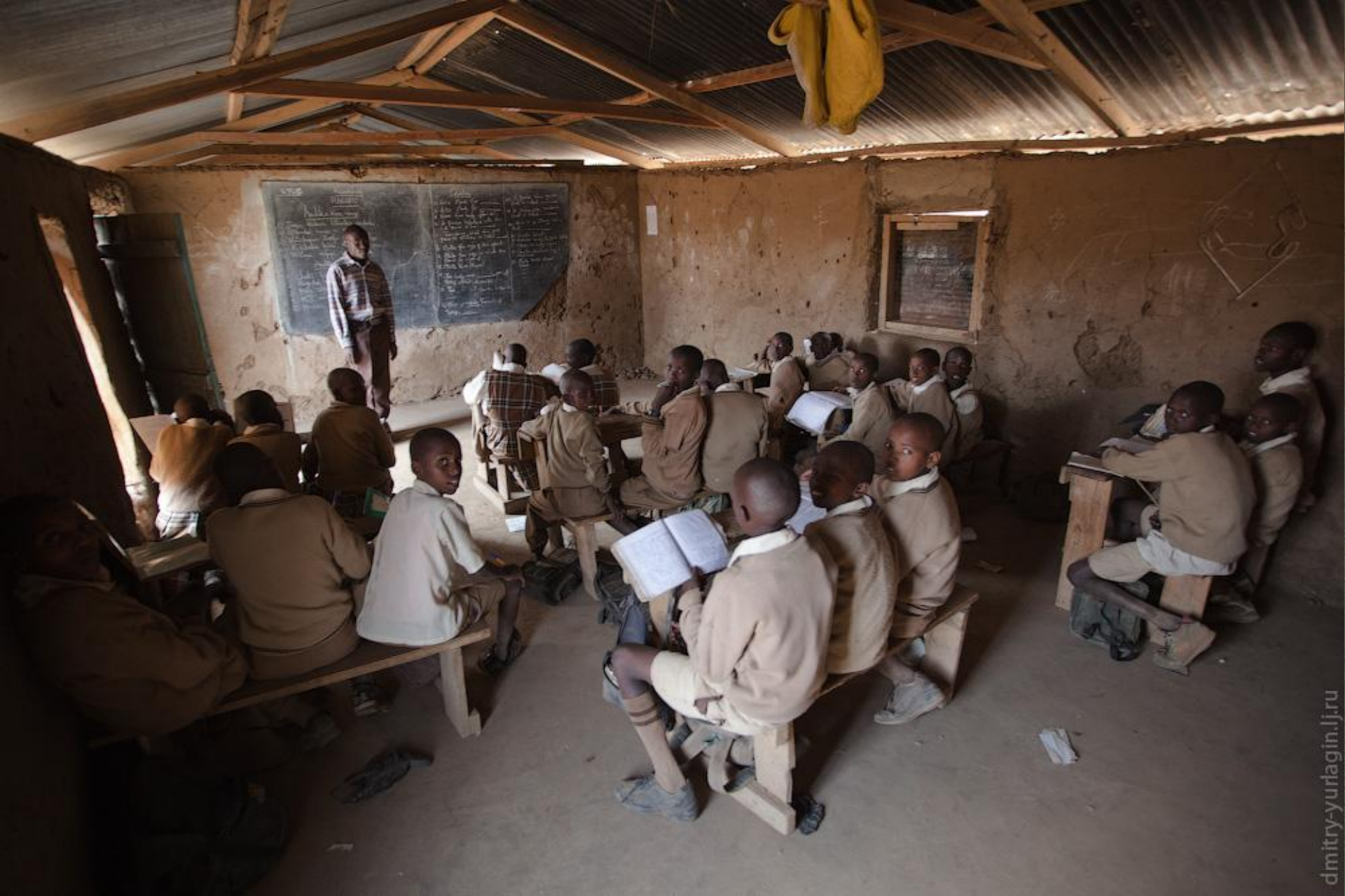
Начальная школа в Кении