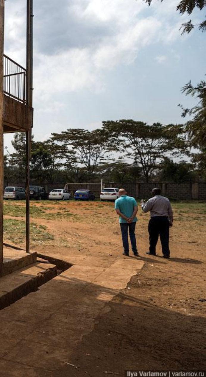
Наглядное пособие по математике в Кении