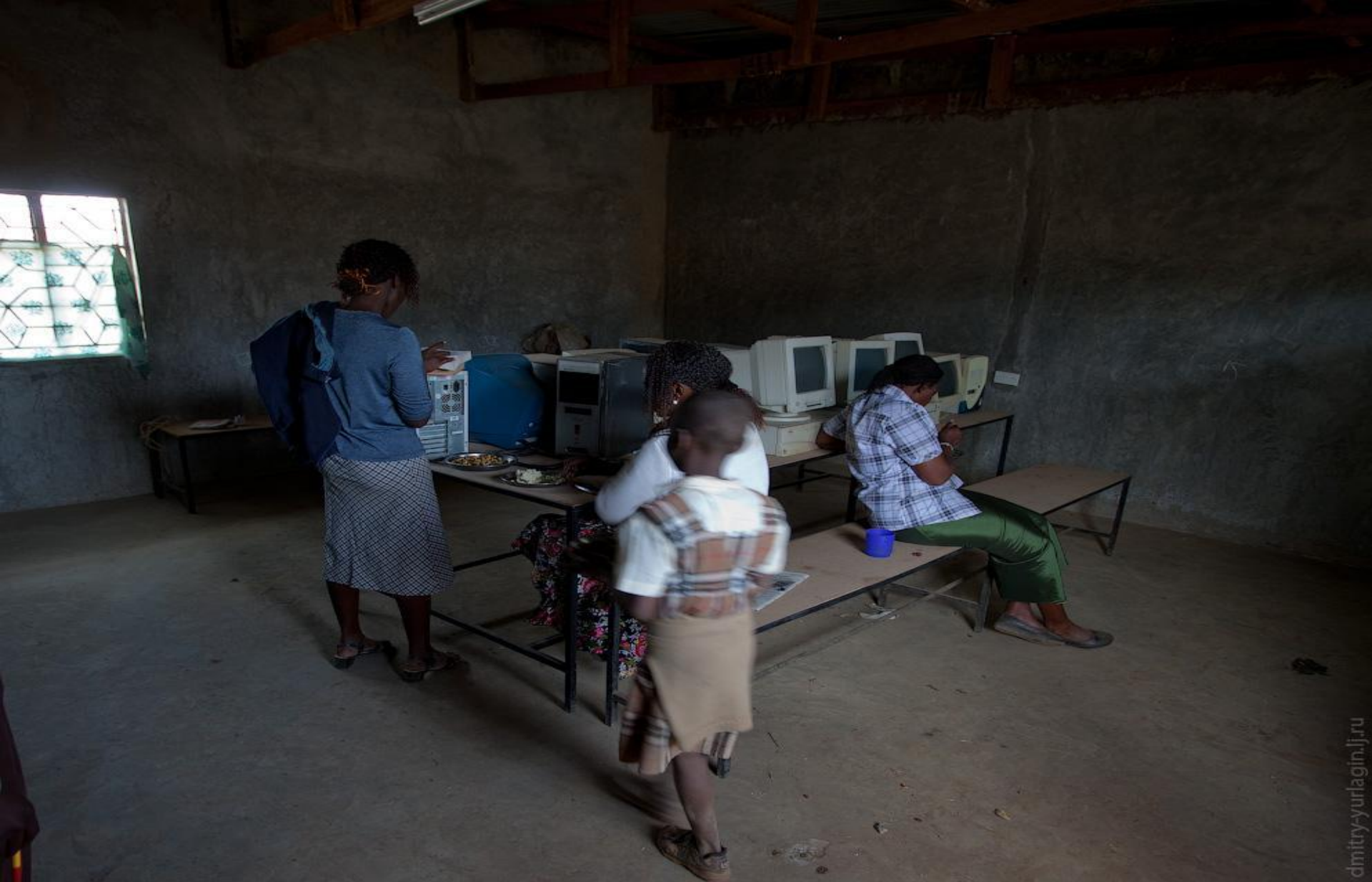
Компьютерный класс в Кении (пока без электричества)