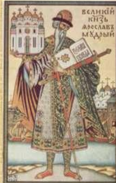
Ярослав Мудрий. Ілюстрація Івана Білібіна.