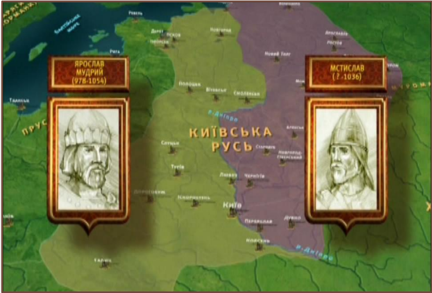
ЯРОСЛАВ МУДРИЙ (978-1054)