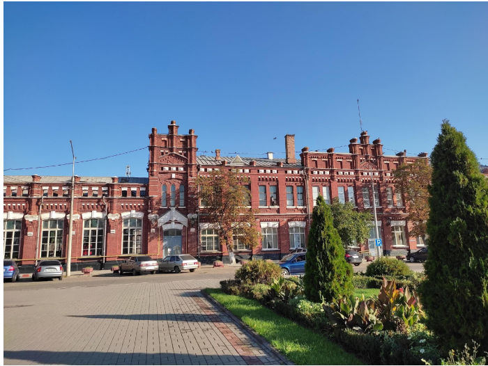
Рис. 1 (узловая железнодорожная станция)

Город Кропоткин основан в 1879 г. как хутор Романовский. Название хутора принято по ранее существовавшему на его месте воен. посту [ОВ] Романовский, на котором служили казаки, переведенные из донской ст-цы Романовская. В 1921 г. хутор преобразован в город и переименован в Кропоткин по фамилии теоретика анархизма и географа кн. П.А.Кропоткина