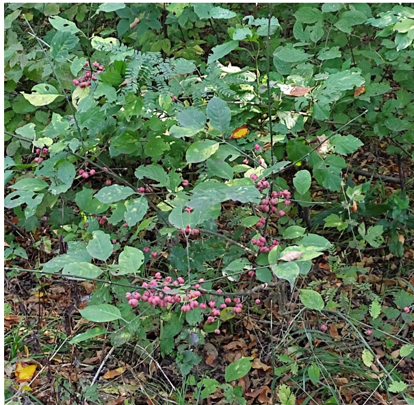
Рис. 4 (волчьи ягоды)

Жимолость настоящая , или Жимолость обыкновенная , или Жимолость лесная [ОБ] ( лат. Lonicera xylosteum ), — кустарник , вид рода Жимолость ( Lonicera ) семейства Жимолостные ( Caprifoliaceae ). В диком виде встречается в Северной , Центральной и Восточной Европе, на Урале и в Западной Сибири . Растёт в подлеске хвойных и смешанных лесов, в зарослях кустарника в оврагах и возле рек. Культивируется как декоративное растение . Плоды ядовиты , в связи с чем жимолость настоящая (как и некоторые другие растения с ядовитыми плодами) известна также под названием волчьи ягоды