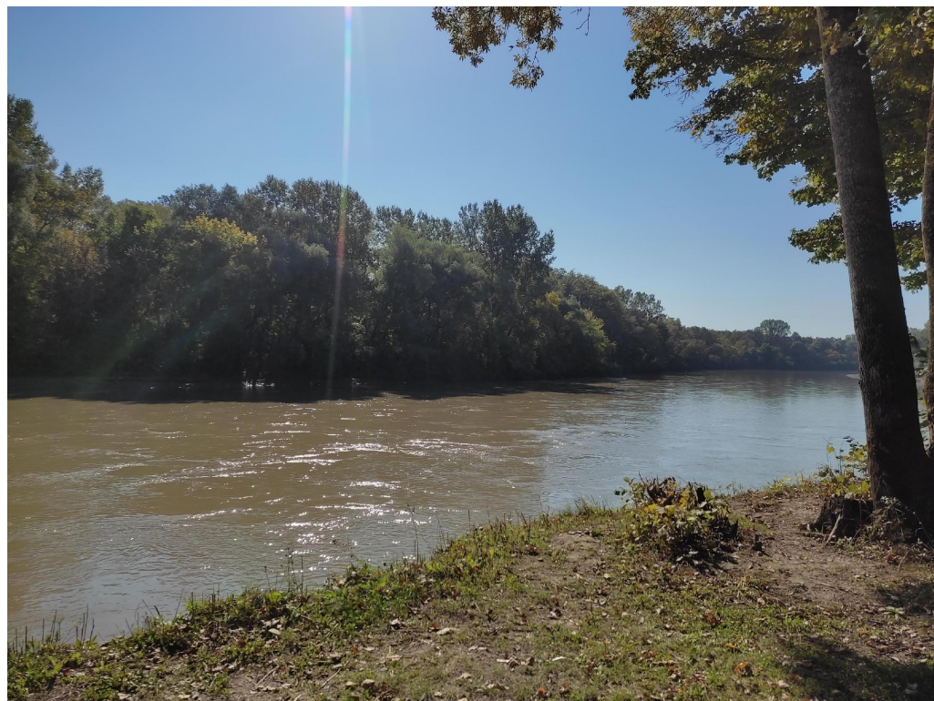
Рис. 7 (Кубань)

Великая река Кубань берет свое начало на западе Эльбруса, на высоте более 1300 м над уровнем моря, в том месте, где сливаются Уччулап и Уллукам. Исток водоема надежно скрыт под мощнейшим ледником Эльбруса. Общая протяженность русла составляет 870 км, а если считать и длину притока Уллукам, то превысит 900 км. Площадь бассейна — 57,9 тыс. км. Путь реки проходит по низменностям и равнинам, а также по областям средних и высоких гор.