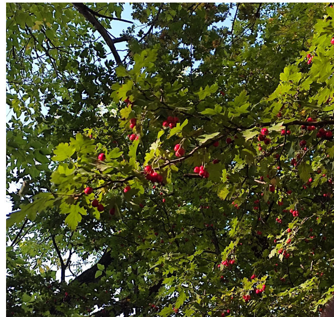
Рис. 5 (Боярышник)

Боярышник – род листопадных, редко полувечнозелёных высоких кустарников или небольших деревьев, относящихся к семейству Розовые. Широко используется как декоративное и лекарственное растение