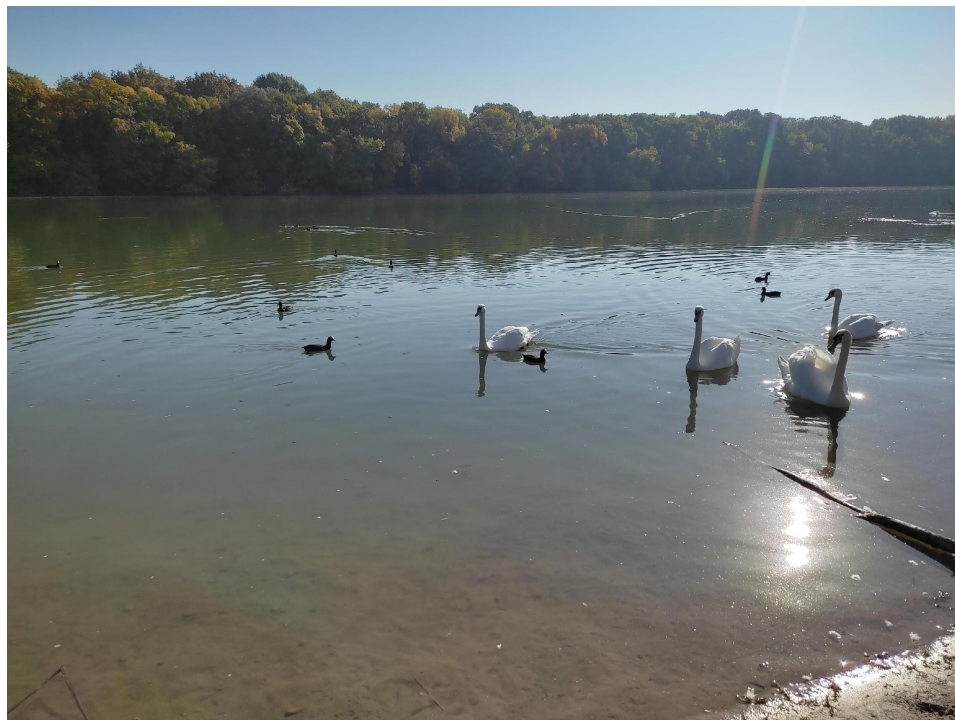
Рис 3. (старое русло кубани.)

Старая Кубань — рукав Кубани в Анапском районе и Темрюкском районе Краснодарского края России . Находится в дельте Кубани . Длина реки — 28 км