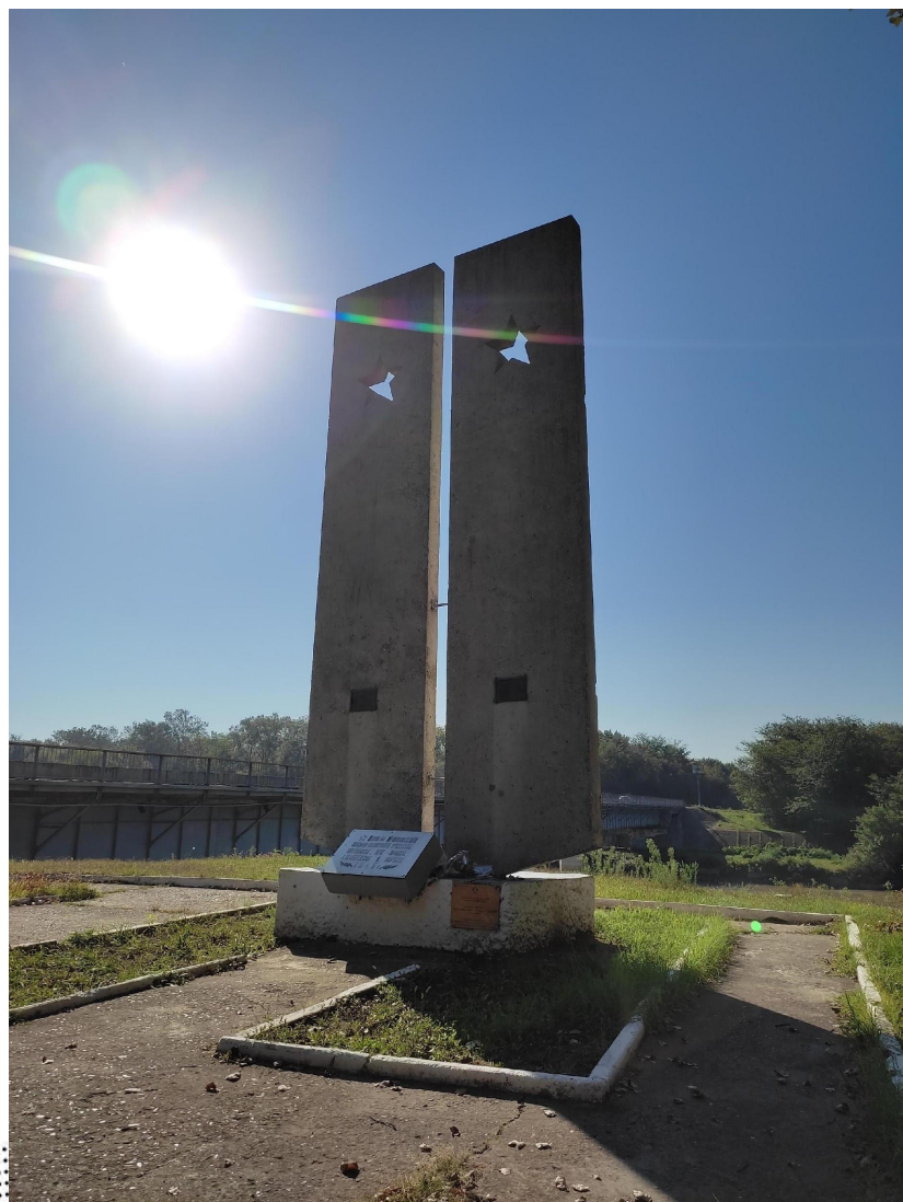
Рис. 6 (Памятник курсантам урюпинского училища)

В память о погибших курсантах и офицерах Урюпинского военно-пехотного училища на берегу Кубани создан монумент. Здесь на кубанской земле, за один год погибло 1140 урюпинцев. У города Кропоткина погибло 640 курсантов и командиров училища. Все они похоронены в окрестностях города, многие из них были представлены к наградам.