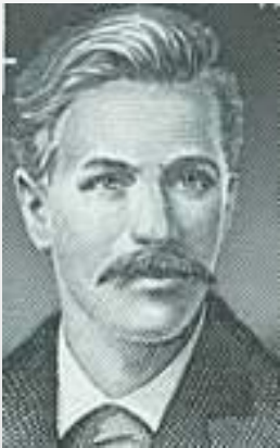
Иван Васильевич Бабушкин