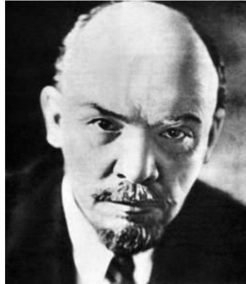
Владимир Ильич Ленин (Ульянов), председатель