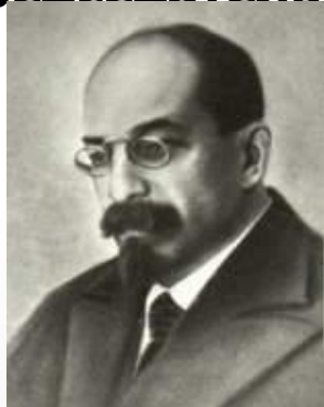
Анатолий Иванович Луначарский