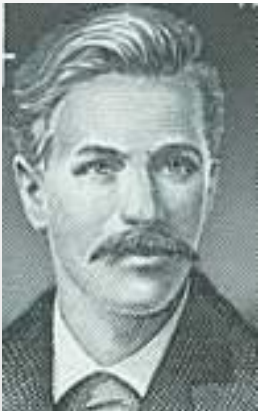
Иван Васильевич Бабушкин