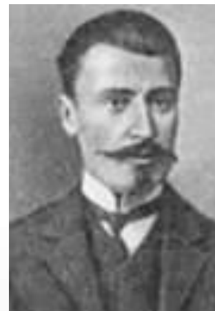
Ираклий Георгиевич Церетели