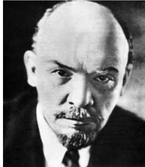
Владимир Ильич Ленин (Ульянов), председатель