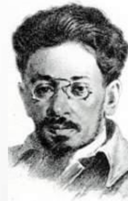
Яков Михайлович Свердлов