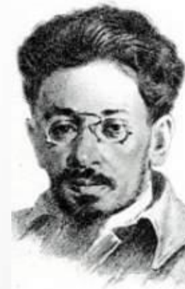
Яков Михайлович Свердлов