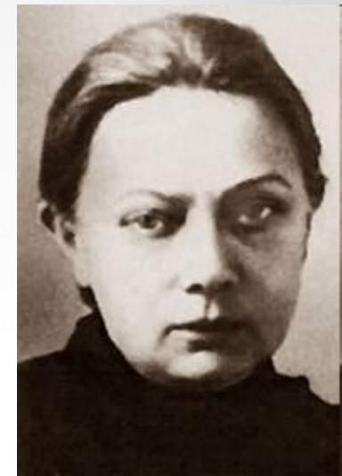
Надежда Константиновна Крупская (жена Ленина)