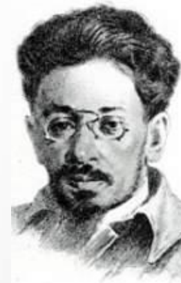
Яков Михайлович Свердлов