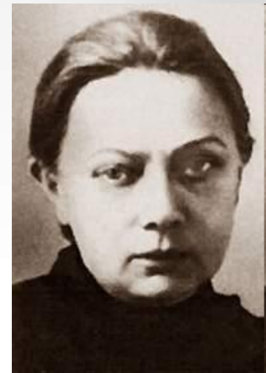
Надежда Константиновна Крупская (жена Ленина)