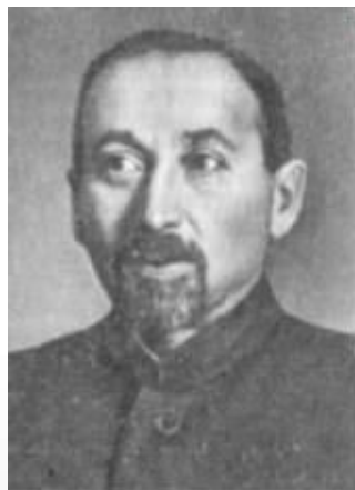
Фёдор Ильич Дан