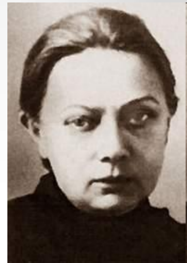
Надежда Константиновна Крупская (жена Ленина)