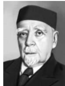
Глеб Максимилианович Кржижановский