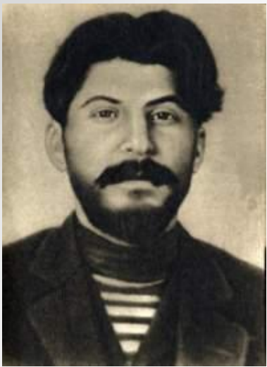
Иосиф Виссарионович Сталин (Джугашвили)