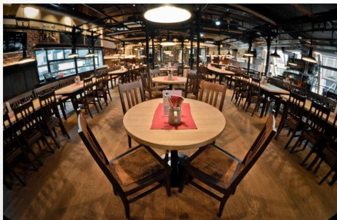
Ресторан «Макс Брой»