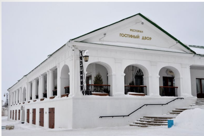
Ресторан «Гостинный двор»