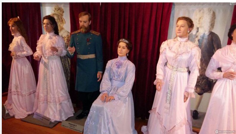
Музей восковых фигур