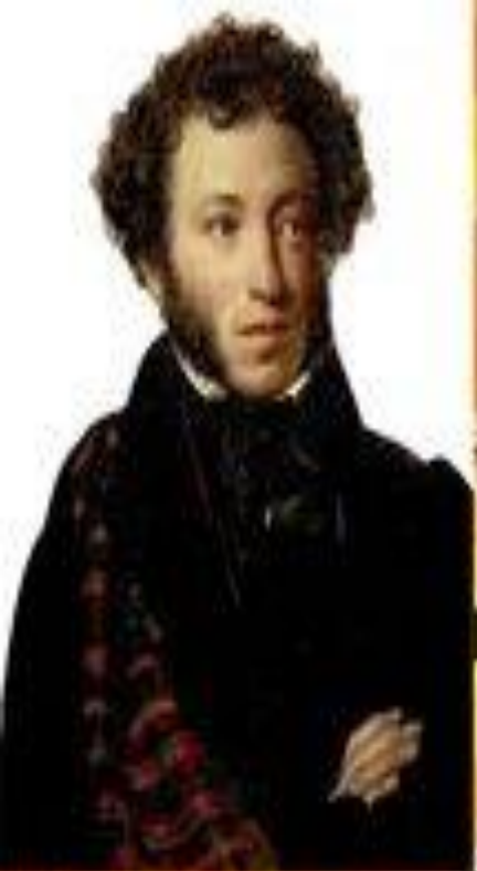
Александр Сергеевич Пушкин