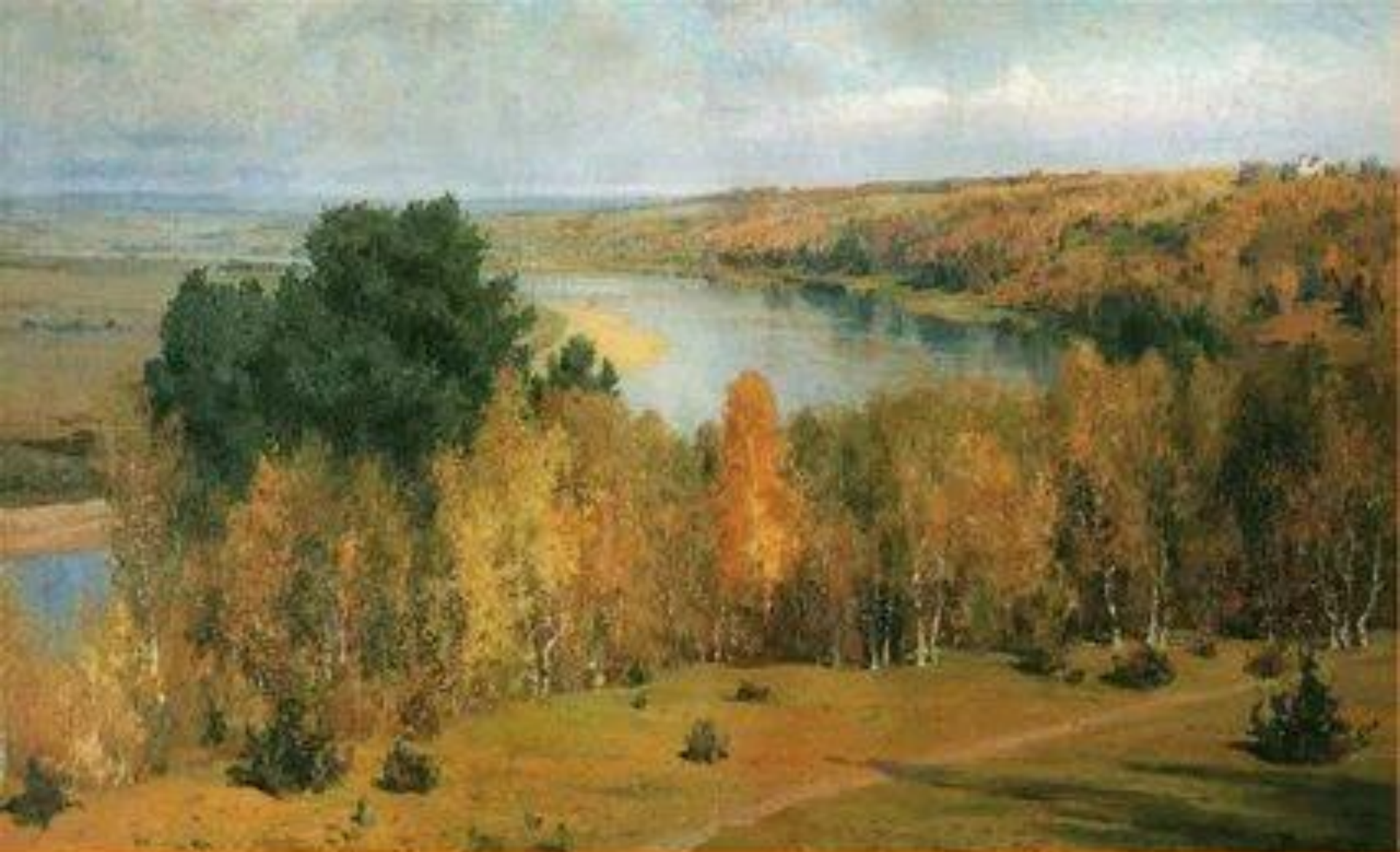
В. Поленов «Золотая осень»