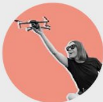
ОПЕРАТОР БЕСПИЛОТНЫХ АВИАСИСТЕМ