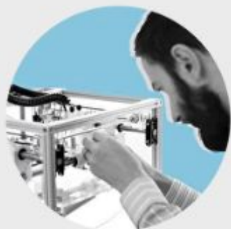
СПЕЦИАЛИСТ ПО АДДИТИВНЫМ ЛОГИЯМ