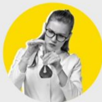
ЛАБОРАНТ ХИМИЧЕСКОГО АНАЛИЗА