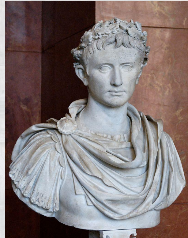
Гай Октавиан Август