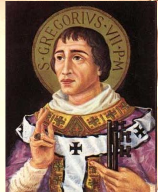
Римский папа Григорий VII