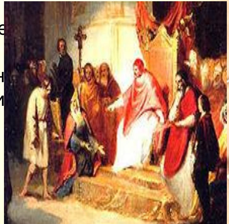
Генрих IV и Григорий VII в Каноссе в 1077

Ламберт Герсфельдский о встрече Генриха IV и Григория VII в замке Каносса