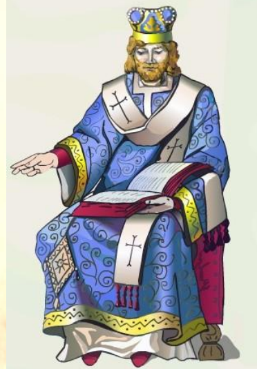
Константинопольский патриарх Михаил