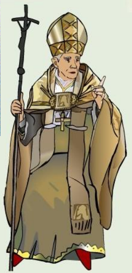
Римский папа Лев IX