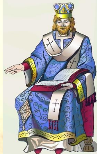
Константинопольский патриарх Михаил