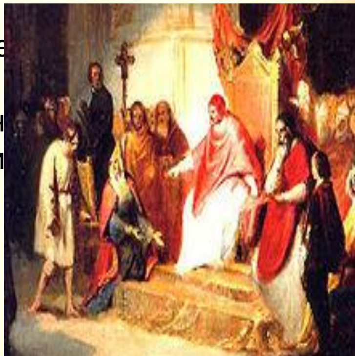
Генрих IV и Григорий VII в Каноссе в 1077

Ламберт Герсфельдский о встрече Генриха IV и Григория VII в замке Каносса