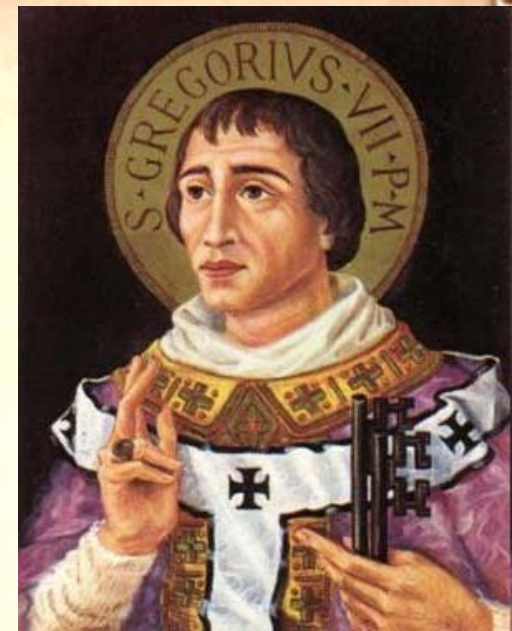
Римский папа Григорий VII