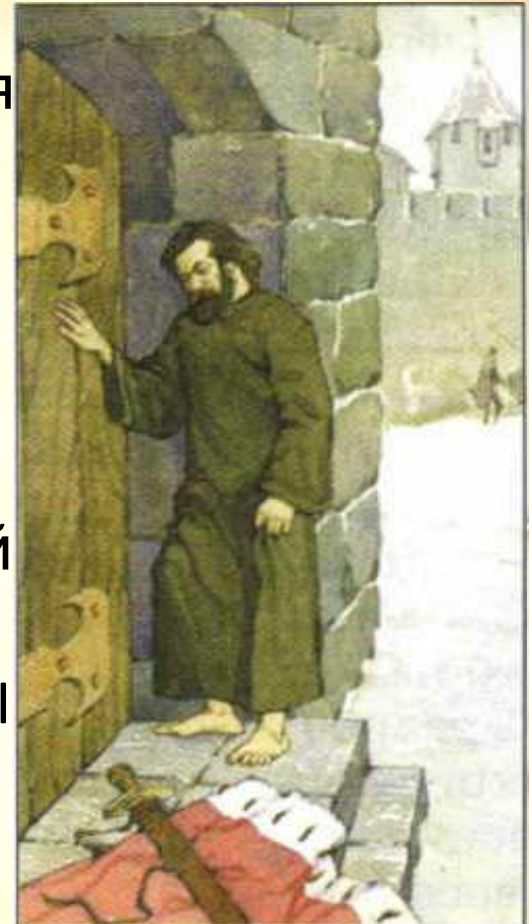
Генрих IV у ворот Каносского замка

Униженный император и торжествующий Папа встретились в небольшом замке Каносса в Северной Италии. Григорий VII смилостивился, пригласил его к себе и освободил от проклятия.