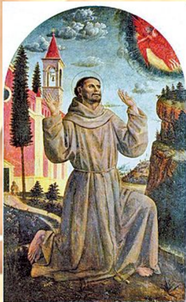
Основатель: Франциск Ассизский