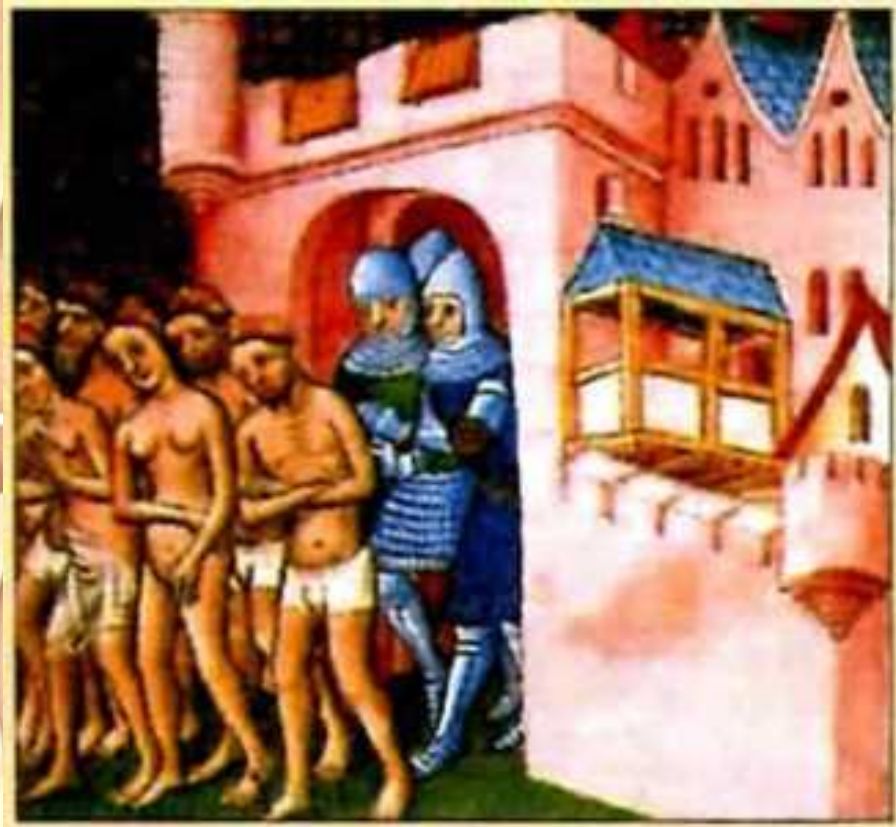
Расправа над еретиками. Миниатюра XIII в.

В течении 20 лет были убиты несколько десятков тысяч человек. Когда папского посла спросили, как отличить еретиков от «добрых католиков», он ответил: «Убивайте всех подряд. Бог на небе узнает своих!»