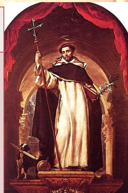
Основатель: Доминик Гусман

Когда Франциск видел множество цветов, он начинал проповедовать им и призывал к восхвалению Господа, как будто они обладали разумом. С самым искренним простодушием он приглашал любить и почитать Господа нивы и виноградники, камни и леса, красу полей, зелень садов и воды ручьев, землю и огонь, воздух и ветер... Даже к червям Франциск питал любовь... И он их собирал с дороги и относил в безопасное место, чтобы путники не раздавили их.