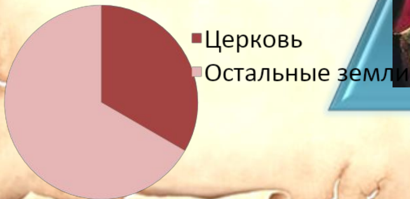
Распределение земель в Средневековой Европе