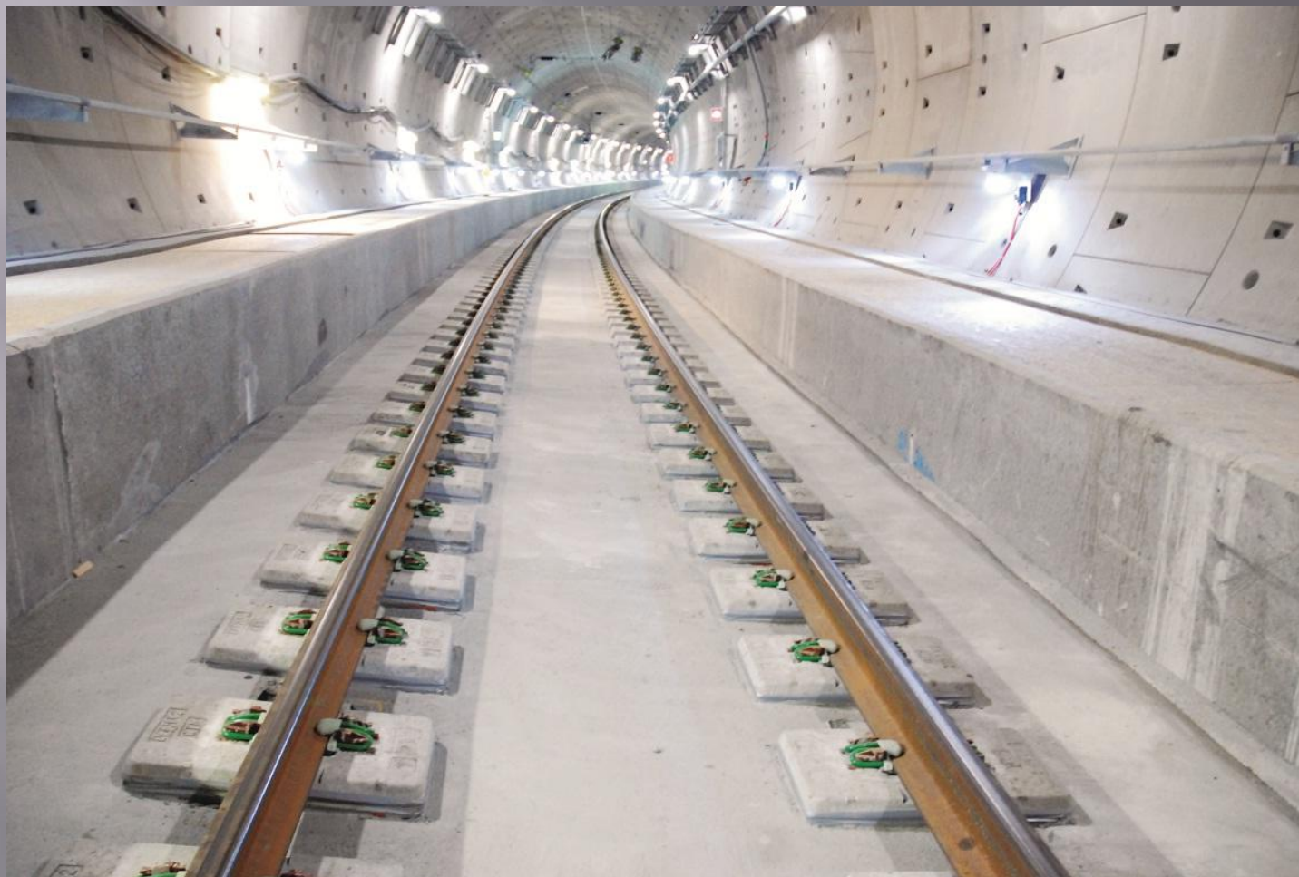
Путь пониженной вибрации (LVT)