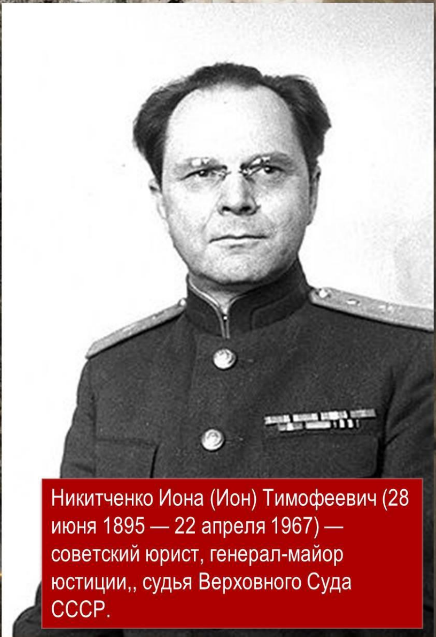
Никитченко Иона (Ион) Тимофеевич (28 июня 1895 — 22 апреля 1967) — советский юрист, генерал-майор юстиции, судья Верховного Суда СССР.

По некоторым данным, он говорил: «Весь смысл Нюрнбергского процесса состоит в том, чтобы обеспечить быстрое и справедливое наказание за преступления». Под председательством И. Т. Никитченко открылось первое заседание Международного трибунала 18 октября 1945 г. в Берлине. После провозглашения приговора И. Т. Никитченко выразил своё особое мнение, не согласившись с оправданием фон Папена, Фриче и Шахта, чрезвычайно мягким, по мнению советской стороны, наказанием для Гесса, а также отказом Трибунала от признания преступными организациями правительственного кабинета, генерального штаба и высшего командования германских Вооружённых сил