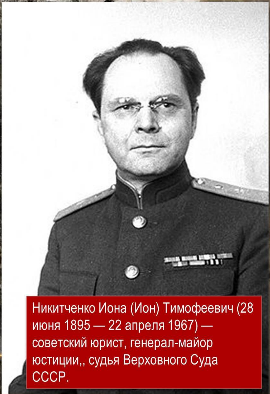
Никитченко Иона (Ион) Тимофеевич (28 июня 1895 — 22 апреля 1967) — советский юрист, генерал-майор юстиции, судья Верховного Суда СССР.

По некоторым данным, он говорил: «Весь смысл Нюрнбергского процесса состоит в том, чтобы обеспечить быстрое и справедливое наказание за преступления». Под председательством И. Т. Никитченко открылось первое заседание Международного трибунала 18 октября 1945 г. в Берлине. После провозглашения приговора И. Т. Никитченко выразил своё особое мнение, не согласившись с оправданием фон Папена, Фриче и Шахта, чрезвычайно мягким, по мнению советской стороны, наказанием для Гесса, а также отказом Трибунала от признания преступными организациями правительственного кабинета, генерального штаба и высшего командования германских Вооружённых сил