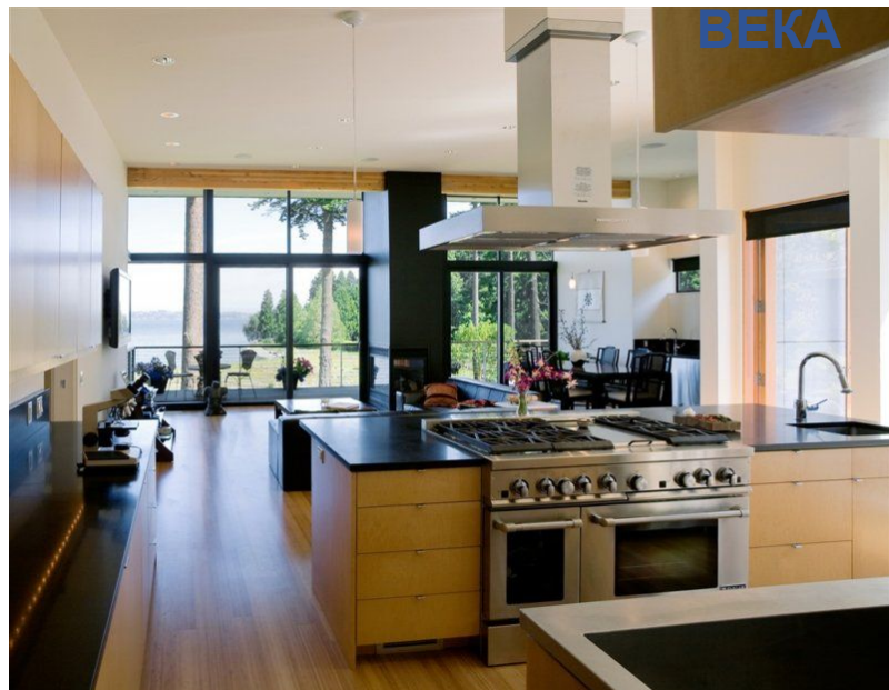
НАЧАЛО 21 ВЕКА