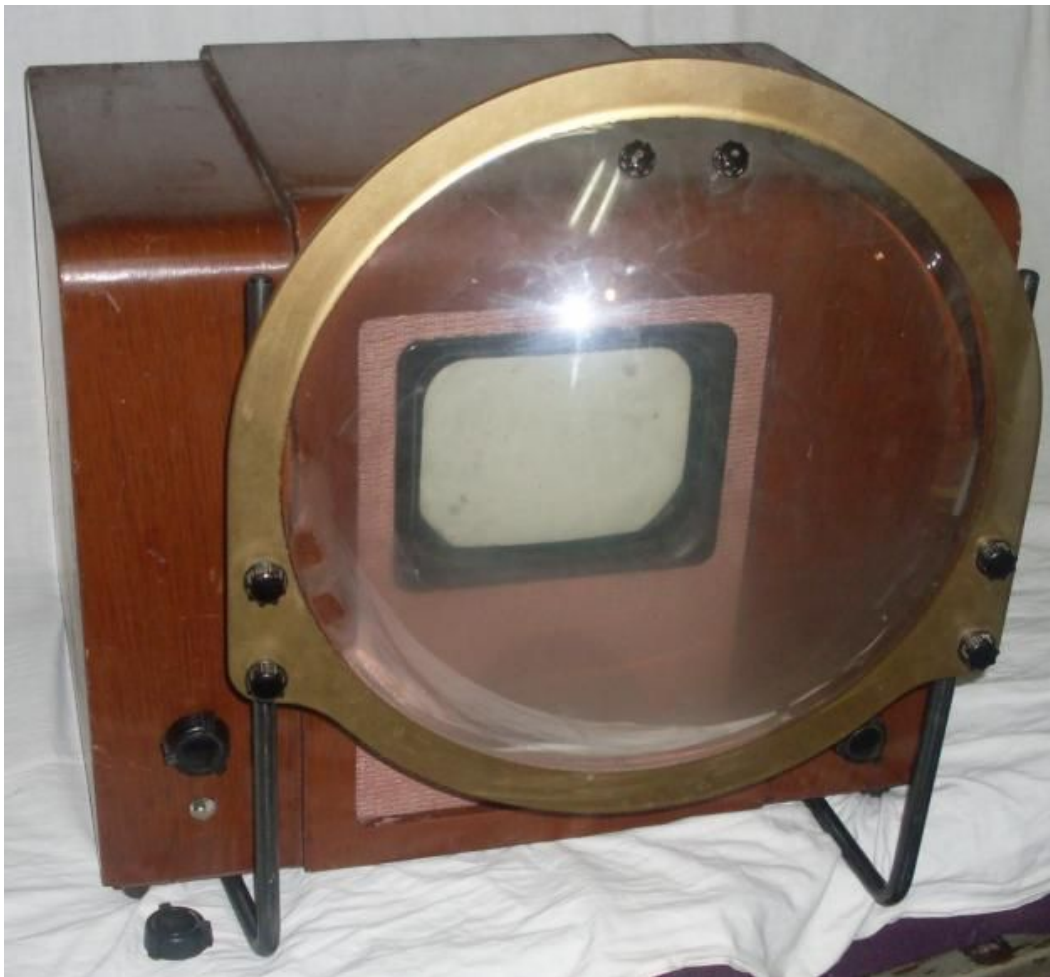
ТЕЛЕВИЗОР С ПИНЗОЙ