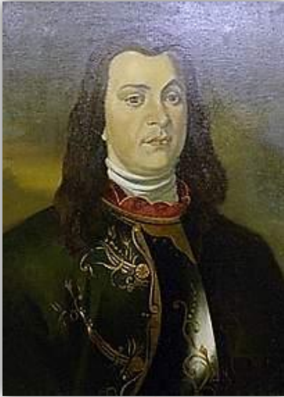
АНТОН МАНУИЛОВИЧ ДЕВИЕР – первый генерал- полицмейстер Санкт-Петербурга