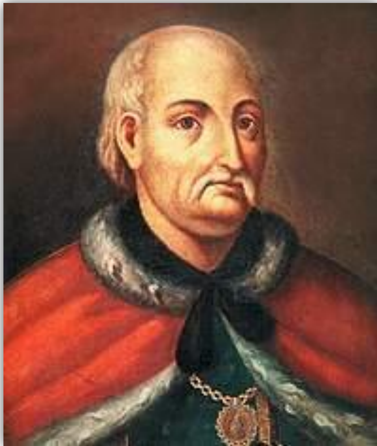
ИВАН ИЛЬИЧ СКОРОПАДСКИЙ

Особый режим местного самоуправления существовал на Украине: