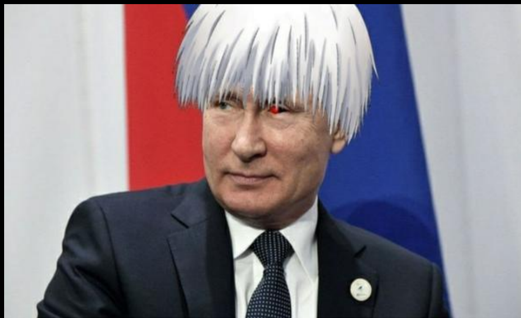
Владимир Владимирович, простите