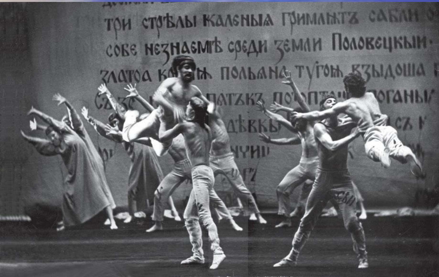
Фото из балета «Ярославна»