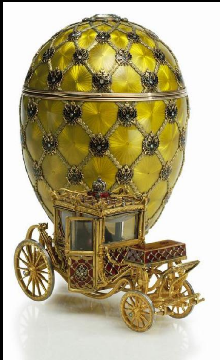
Коронационное яйцо Фаберже, 1897