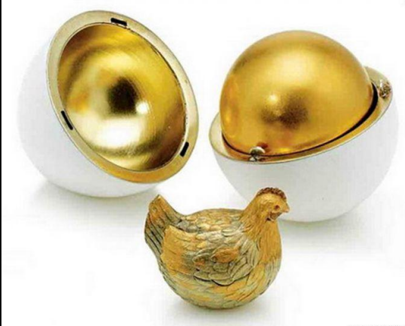
Первое яйцо Фаберже, 1885